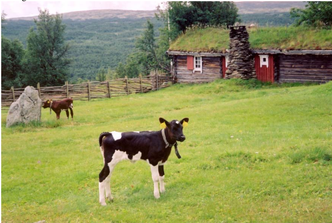
Seter, Kløftåsen i Vangrøftdalen.

Innenfor Vangrøftdalen/Kjurrudalen landskapsvernområde er det i dag registrert rundt 100 setre. Av disse er 30 setre i drift med mjølkeproduksjon og 60 i drift med slått og beite. Se vedlagte seterkart over området. Med et gjennomsnittlig antall hus pr. setervoll på 4 er det rundt regnet 400 bygninger innenfor dette området. Vi foreslår imidlertid et noe utvidet område der vårsetrene i fremre del av Vangrøftdalen og Kjurrudalen, samt setrene på nordvestsida av Setersjøen inngår i det prioriterte kulturlandskapsområdet (se pkt angående områdeavgrensning under). Med en slik områdeavgrensning blir det totale antall registrerte setre 130. Av disse er totalt ca. 40 setre i aktiv drift med mjølkeproduksjon. I tillegg kommer de som er i drift med slått og beite. Totalt antall bygninger blir rundt 520. De fleste setrene i aktiv drift ligger i Vangrøftdalen, mens flere av setrene i Kjurrudalen har tilknytning til de samme eierne og brukes til slått eller beite. Innenfor landskapsvernområdet er det ingen fastboende. I den fremre delen av Vangrøftdalen og Kjurrudalen er det i tillegg til vårsetrene noen gårdsbruk i aktiv drift.