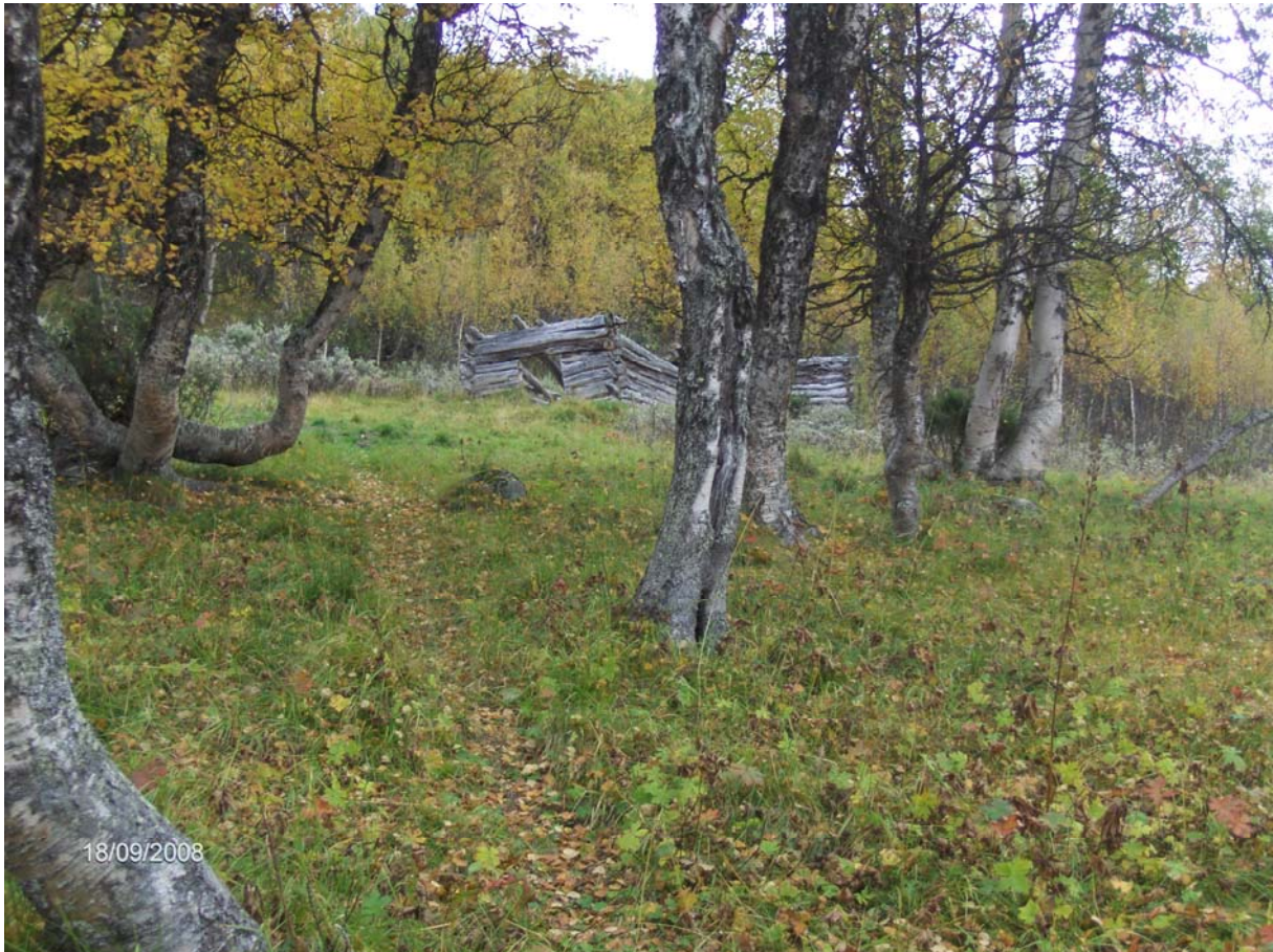
Nedfallen slåttebu i utkanten av gammel slåtteeng.

Alle bygninger i området er tidligere SEFRAK-registrert. Sommeren 2006 og 2007 har Nordøsterdalsmusèet på vegne av Os kommune foretatt en supplerende oppdatering og fotografering av alle hus i området. Innenfor dette området er det rundt 500 seter- og utmarkshus (seterstuer, seterfjøs, løer, staller, masstuer, kokhus, buer, avkjølinger). Disse husene dekker hele bredden fra velholdte setrer i aktiv drift, velholdte setrer ute av drift, til hus som trenger restaurering eller står for forfall.