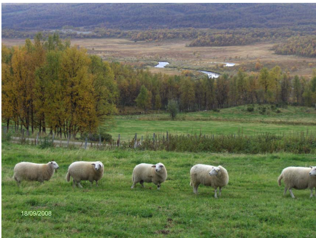
Sau på innmark på setra om høsten. Utsikt mot elveslettene i Vangrøftdalen.

Begge seterdalene ligger innenfor Vangrøftdalen - Kjurrudalen landskapsvernområde som ble vedtatt vernet 21. desember 2001. Formålet med vernet er å ta vare på et særegent og vakkert natur- og kulturlandskap, der seterlandskap med seterbebyggelse og setervoller, vegetasjon og kulturminner, skapt gjennom aktiv jordbruksdrift, utgjør en vesentlig del av landskapets egenart. Landskapsvernområdet dekker et areal på 126 km 2 . Setrene ved Setersjøens nordvestre side grenser opp mot landskapsvernområdet. Det totale arealet på det foreslåtte utvalgte området er ca 165 km 2 .