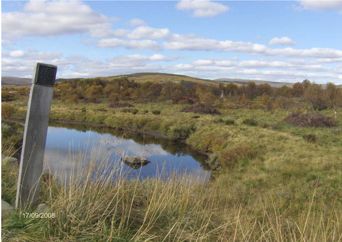
Elveslette langs Tverrelva ryddet sommeren 2008.