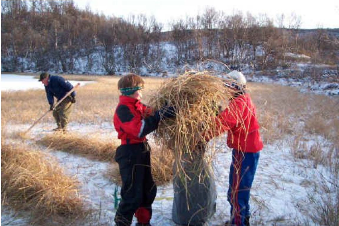
Skoleelever i arbeid på Nirsengen, Vangrøftdalen.