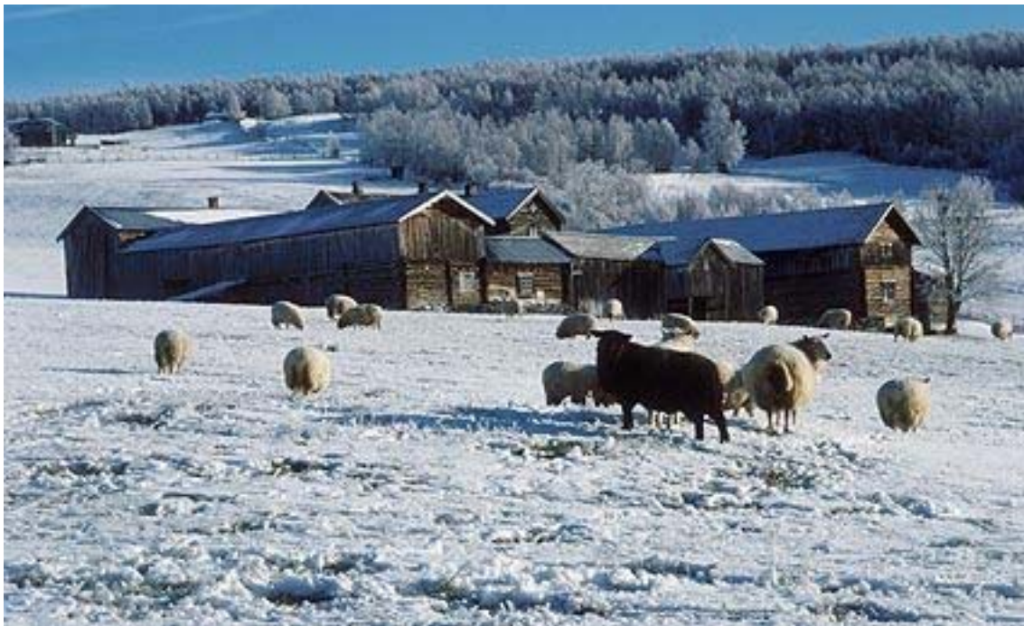
Garden "Utistu" i Dalsbygda.

Byggeskikken i bygda og i seterdalene viser at det ble knapphet på materialer. I Dalsbygda er dette særlig synlig på det foreslått fredede gardstunet "Utistu" som ligger i bygda og som har tilhørende seter i både Kjurrudalen og Vangrøftdalen. Setra i Vangrøftdalen (Dalvollen) er foreslått fredet (ligger hos Riksantikvaren for endelig fredning).