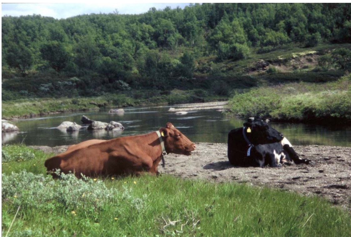
Kyr på beite i Vangrøftdalen.