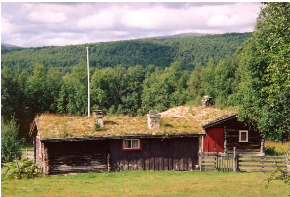
Seter i Mastukåsen, Vangrøftdalen.

Det vil i løpet av 2008 bli utarbeidet en rapport/fullstendig register av bygninger – sammenhold med tidligere SEFRAK-registrering som grunnlag for prioritering av særlig verdifulle bygninger og bygningsmiljø og for prioritering av bygninger som det haster å gjøre noe med pga. forfall.