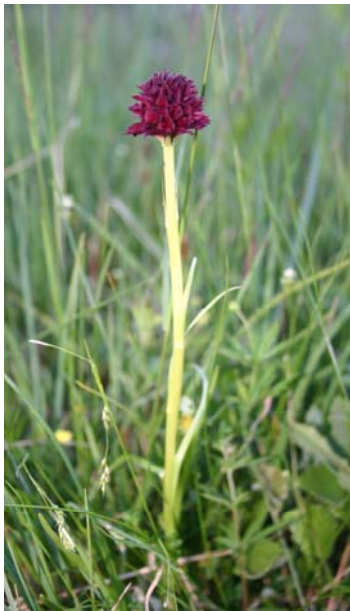
Svartkurle ( Nigritella nigra )