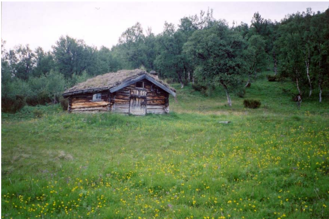
Bu/slått i Såttåhaugen i Vangrøftdalen.

I Vangrøftdalen og Kjurrudalen er det et betydelig antall bygninger og det er store utfordringer knyttet til ivaretagelse av bygningsmassen.