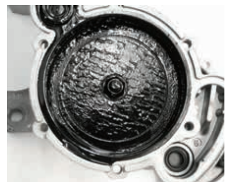
Abb. 3: Ölschlamm in der Vakuumpumpe vom VW Transporter führt zu Klappergeräuschen

Eine ähnliche Beanstandung ergibt sich, wenn eine falsche Vakuumpumpe mit einem zu kurzen Stößel (3) eingebaut wird.