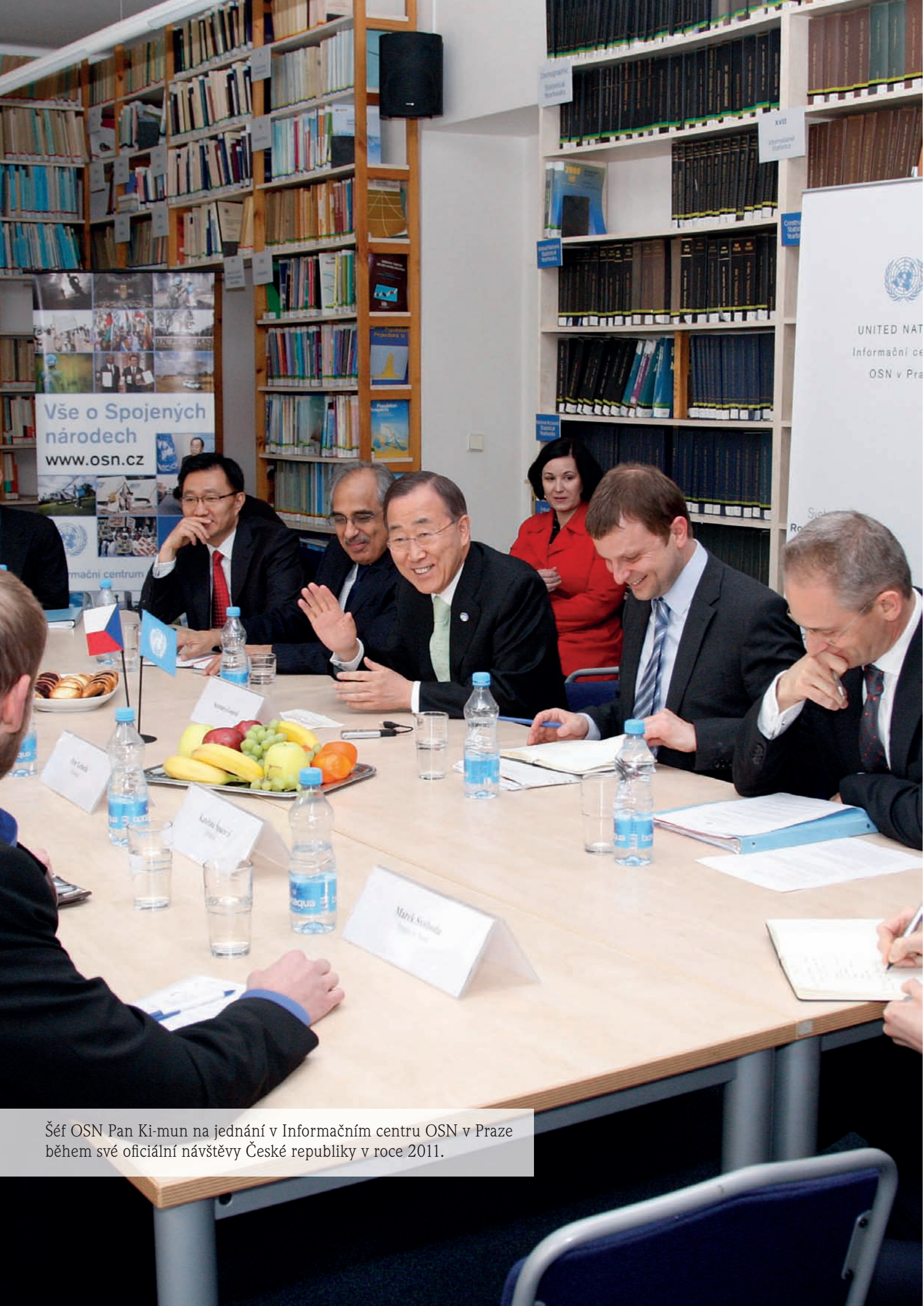
Šéf OSN Pan Ki-mun na jednání v Informačním centru OSN v Praze během své oficiální návštěvy České republiky v roce 2011.