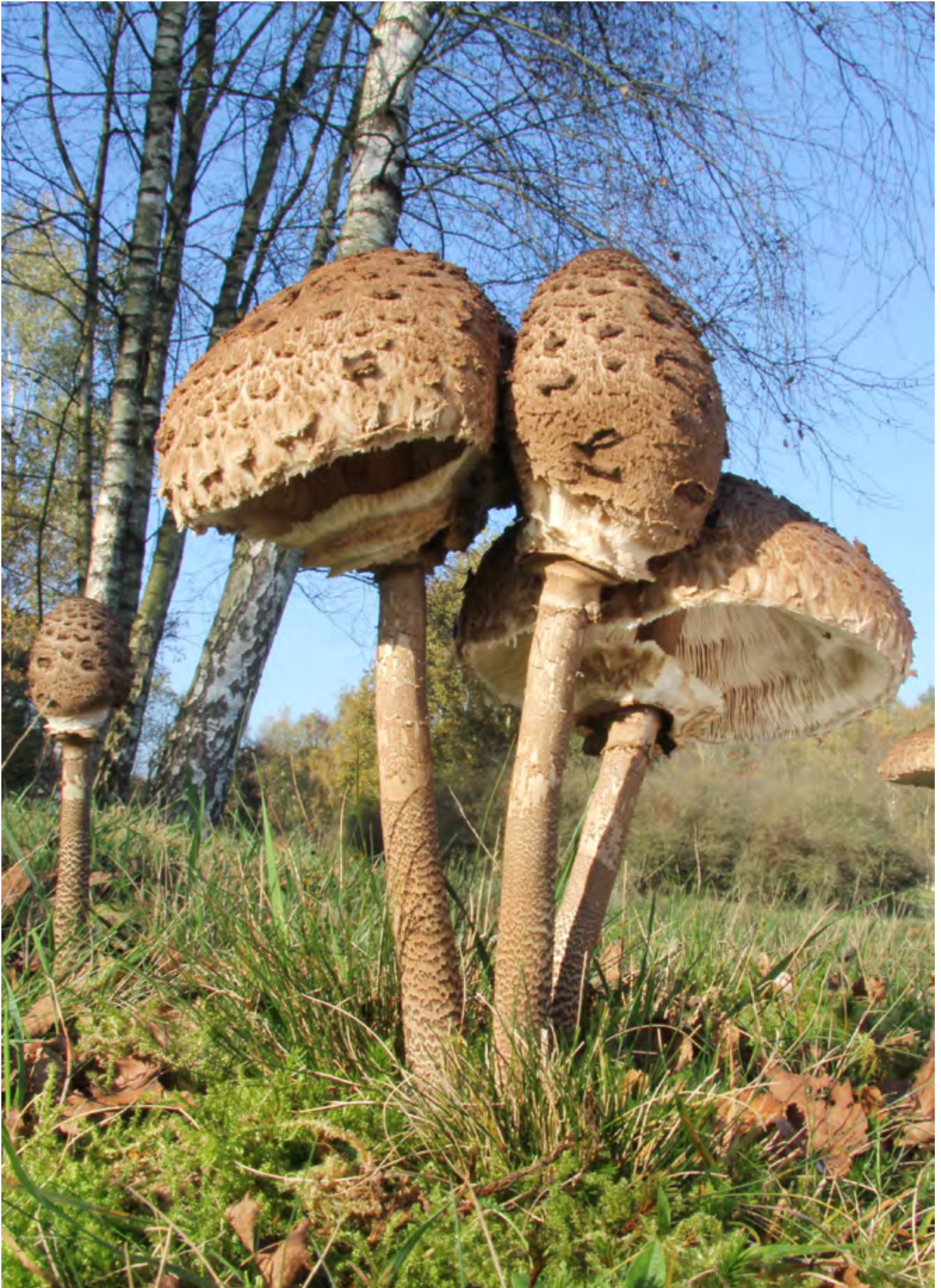
Grote parasolzwam ( Macrolepiota procera )