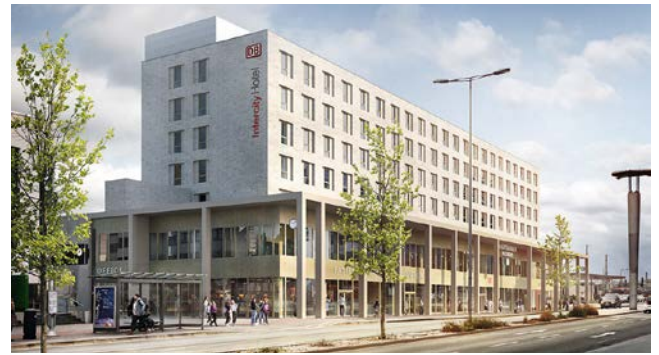
Mit dem neuen Bahnhof bekommt Paderborn eine neue Vistenkarte.

Paderborn. Die Zeiten werden hoffentlich wieder etwas ruhiger an den Paderquellen. Mit neuen Corona-Beschränkungen für 2023 rechnet derzeit wohl niemand mehr. Somit kann der Veranstaltungskalender wie gewohnt durchgezogen werden. Schon das vergangene Jahr hat gezeigt, wie ausgehungert die Menschen sind. Sie wollen wieder raus und sich treffen. Viele dürsten nach Geselligkeit. Kulturveranstaltungen wie Konzerte, Lesungen und Schauspiel finden wieder statt. Die Paderhalle und das Theater Paderborn verzeichnen wieder mehr Gäste. Das Diözesanmuseum und das Stadtmuseum machen den Auftakt ins neue Jahr mit einer Gemeinschaftsausstellung zum 100sten Geburtstag des heimischen Künstlers Josef Rikus. Im Naturkundemuseum in Schloß Neuhäuser Marstall starten wieder die „Glanzlichter“, eine Ausstellung der TOP-Naturfotos des Jahres 2022. Der Schloßsommer wird wohl seine Veranstaltungen wieder wie gewohnt anbieten und so kann man