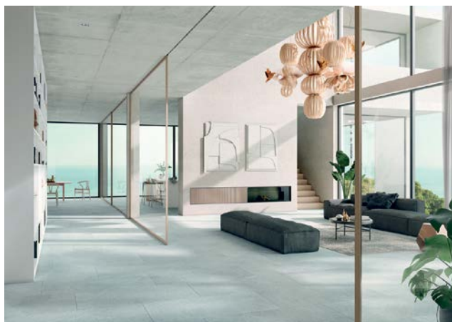
Durch die Wahl eines langlebigen, ökologisch verträglichen Materials wie der keramischen Fliese kann jeder Bauherr seinen CO 2 -Fußabdruck verbessern und zugleich Geld sparen.