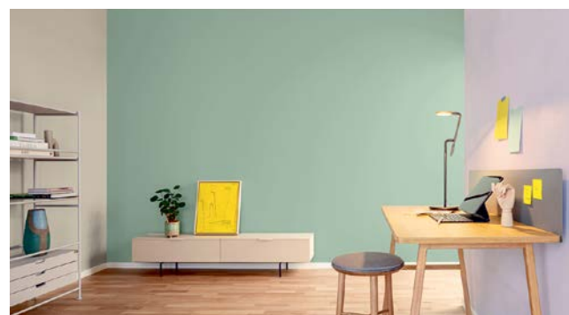
Natürlich kommt das dynamische Zusammenspiel der Farben besonders bei großflächigen, offenen Wänden zum Tragen. Klar wird hier: Bergsee-Grün ist ein idealer Farbpartner.

Die Farbharmonien sind so angelegt, dass sie sich klar voneinander differenzieren und sehr unterschiedliche Stimmungen erzeugen. Die erste Farbharmonie beispielsweise kombiniert Töne, die alle nahe beieinanderliegen, farblich zurückhaltend sind und tendenziell kühl wirken. Die zweite nutzt Komplementärkontraste und ist intensiv, charaktvoll, ein kraftvolles Statement. Die dritte gibt sich zurückhaltend, kombiniert leichte Töne mit dunklem Blau.