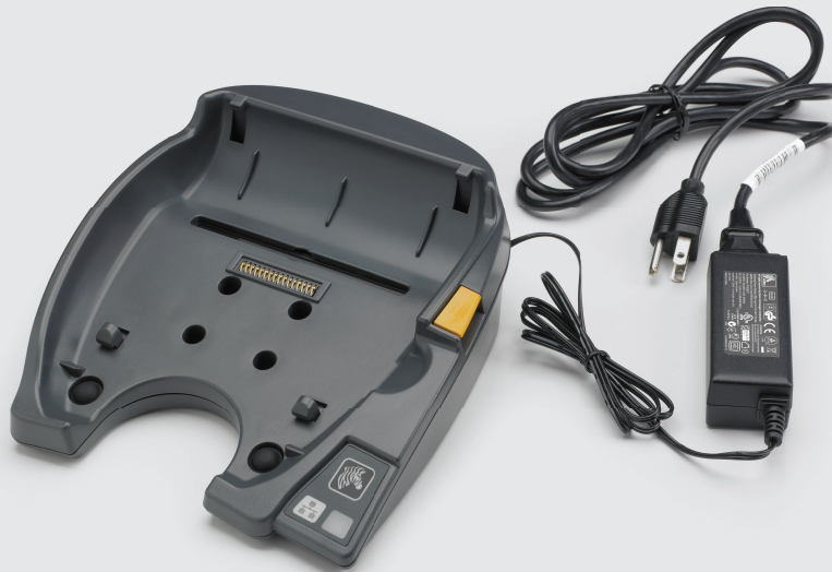
QLn420-Lade- und Ethernet-Docking-Station