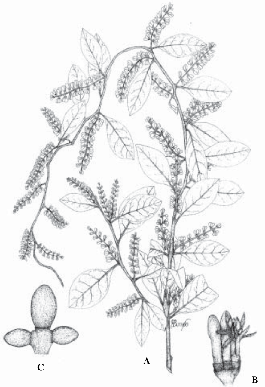
Fig. 4. Struthanthus interruptus (HBK) Bunme. A) Planta con flores (Cházaro et al. , 4773); B) Detalle de flor (Cházaro et al. , 4773) (XAL); C) Fruto (Cházaro et al. , 5898) (IEB).