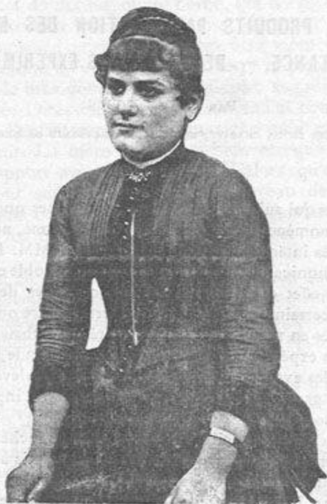
Fig. 1. — Sujet à l'état normal.

Ces phénomènes étranges et tout à fait imprévus, dont nous ne connaissons pas à l'heure actuelle le premier mot, déconcertent, comme on le pense bien, tout ce que nous croyons savoir de positif jusqu'ici sur l'action des médicaments sur l'organisme. Comment expliquer en effet ce fait réel en vertu duquel dix grammes de cognac enfermés dans un tube scellé à la lampe ont la possibilité de déterminer chez un sujet