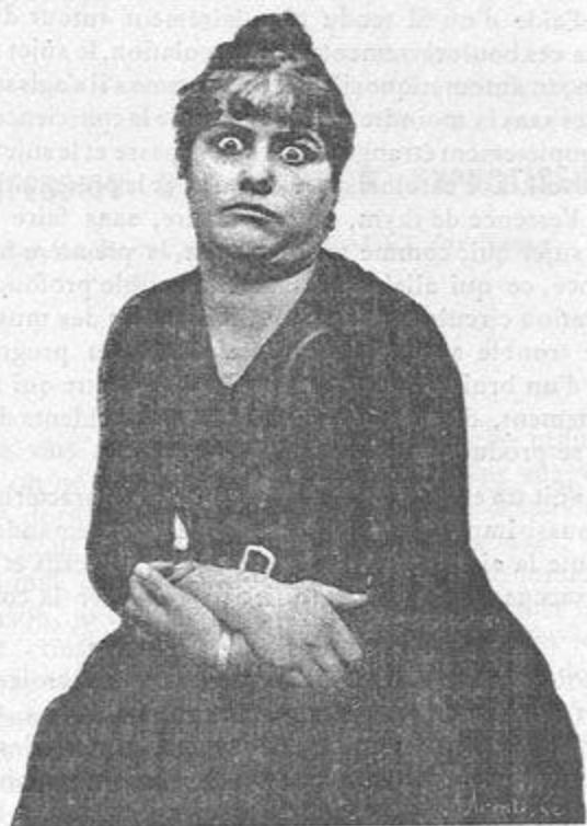
Fig. 2. — Le même sujet présentant le phénomène de l'exorbitis expérimental.

Je n'ai pas la prétention de convertir les esprits fermés qui, de parti pris, refusent de voir les faits. Je m'adresse exclusivement aux gens