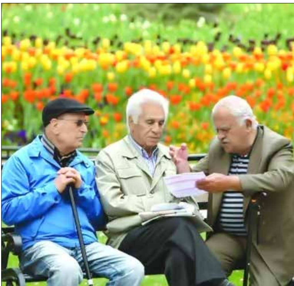
رئیس سازمان بازنشستگی کشوری در استان کرمان خبر داد: