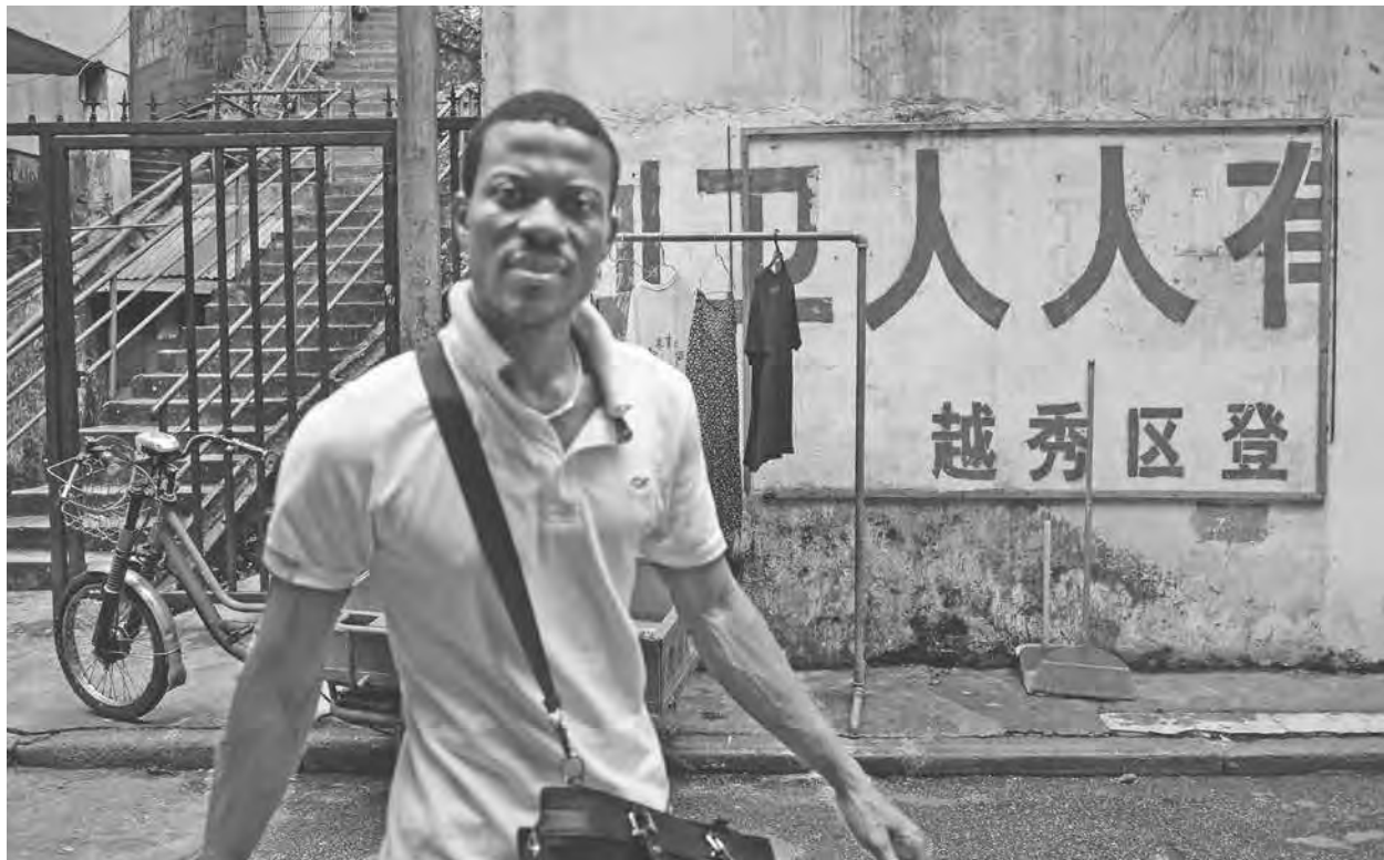
廣州街上的非洲人。

另一名尼日利亞商人則說，他原本在廣州租住公寓，疫情爆發後，房東竟在無理由的情況下，將他住的公寓斷水、斷電，房東甚至