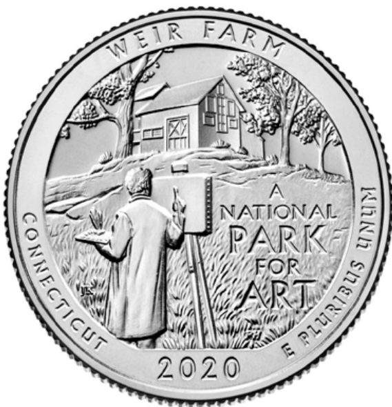
康涅狄格州威爾農場國家歷史遺蹟紀念幣