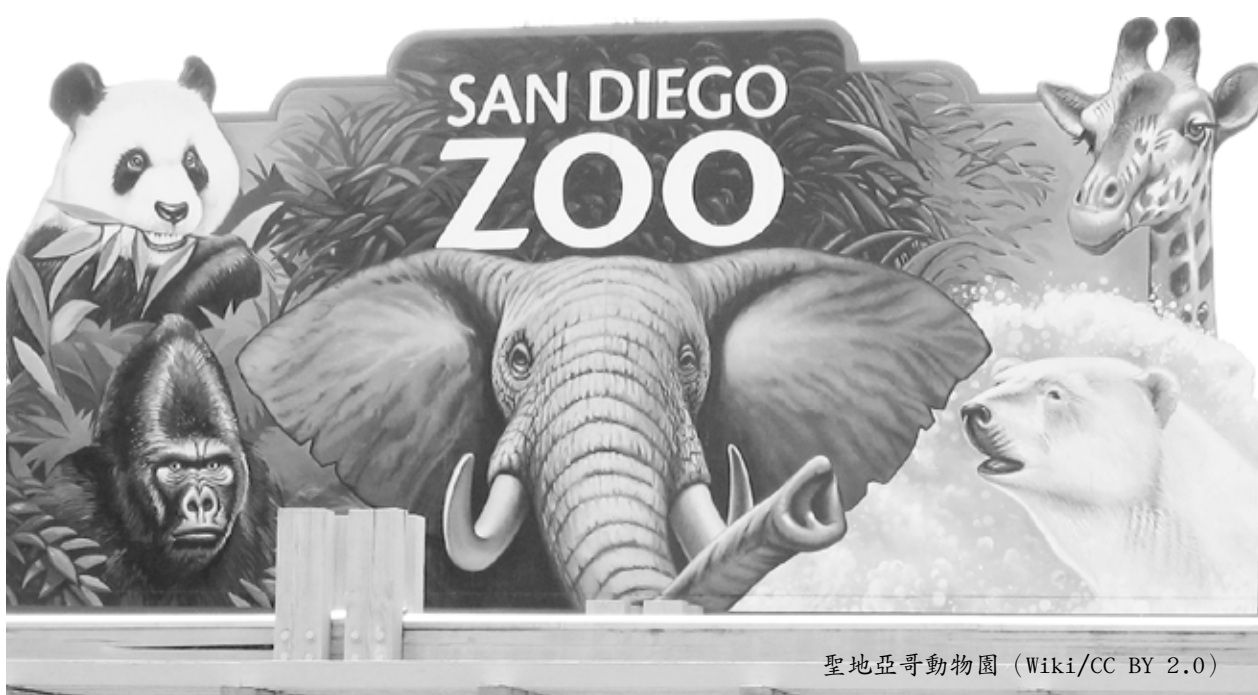
聖地亞哥動物園

目前，全世界許多動物園和水族館正在網上舉行直播或重播節目，可讓您盡情的觀賞各種陸地及水生動物，不論是溫順的小兔子到獸中之王的雄獅，還是從憨萌的小企鵝到巨型的大白鯨，真是應有盡有，一定令您大飽眼福！