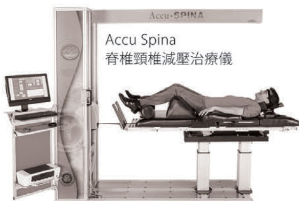
Accu Spina 脊椎頸椎減壓治療儀