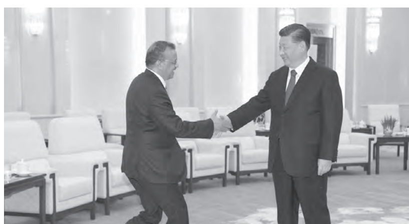
譚德塞1月28日到北京面見習近平。