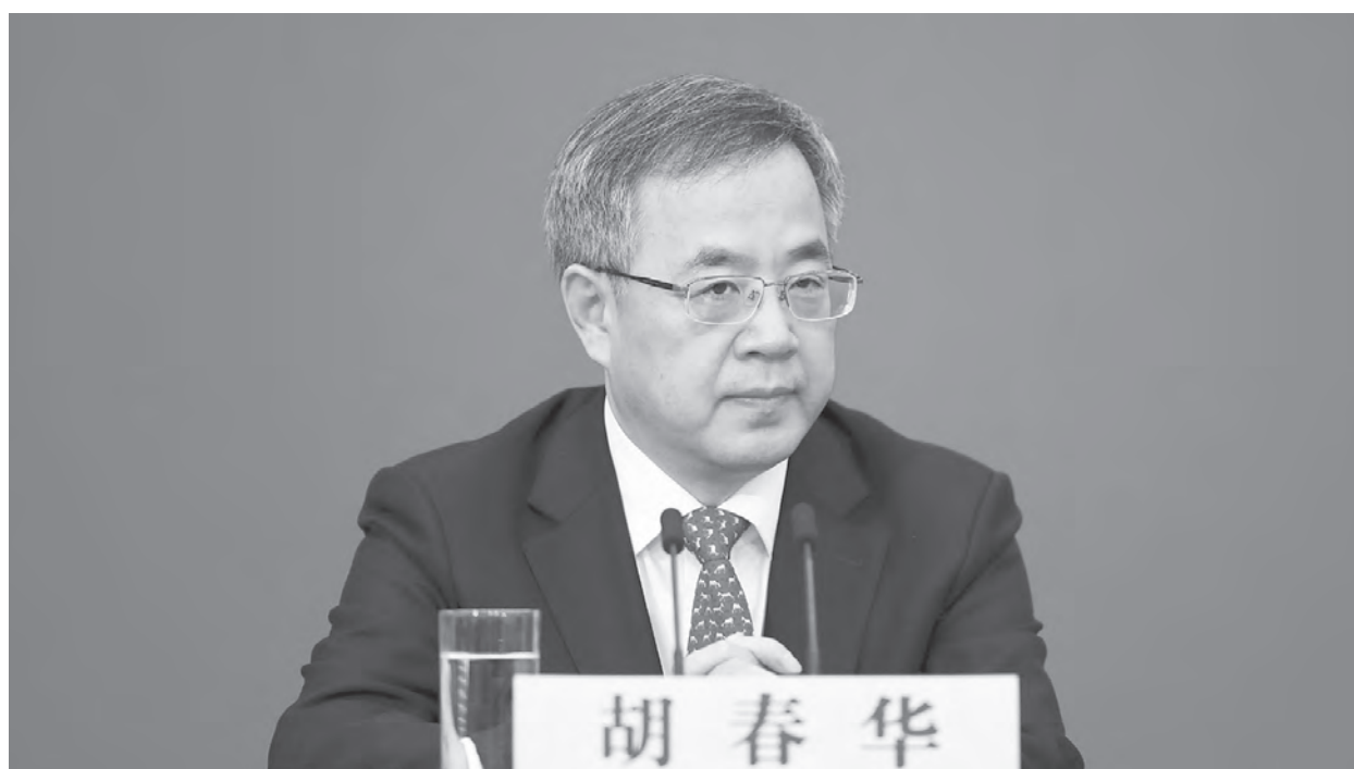
政治局委員、國務院副總理胡春華是「接班人」的熱門人選。