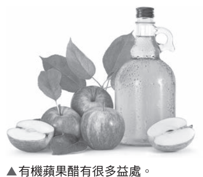
▲ 有機蘋果醋有很多益處。

5. 正如它的舊拉丁名稱「Panacea」（意思是「治癒所有」疾病），黑孜然油至少有20種不