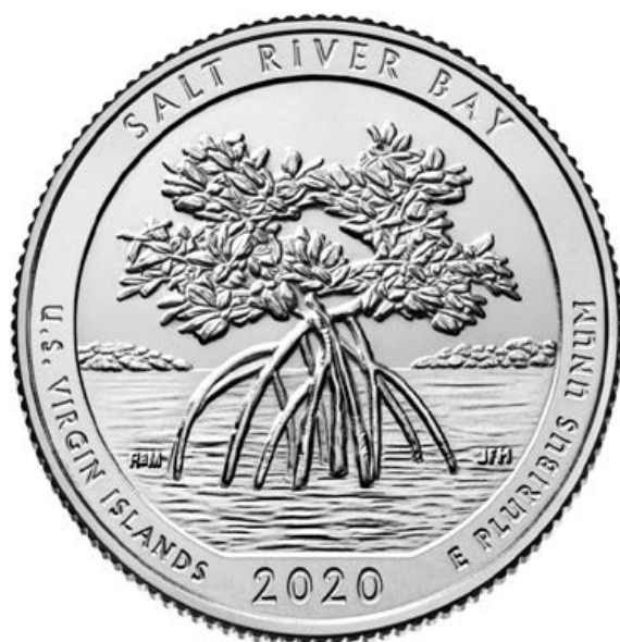
美屬維京群島鹽河海灣國家歷史公園及生態保護區紀念幣