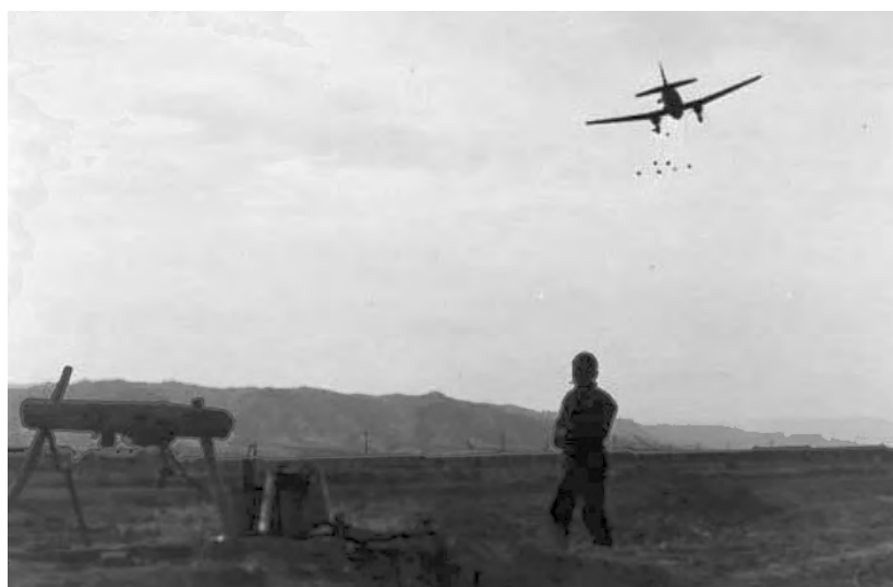
▲國軍守衛太原保衛戰。城內食糧極度困難，國民政府空投食糧。

1949年初，閻錫山6次致電華北剿匪總司令傅作義，勉其「只有犧牲奮鬥，萬不敢僥倖共存。」不想傅作義於1月23日與共黨簽訂所謂「和平協定」，