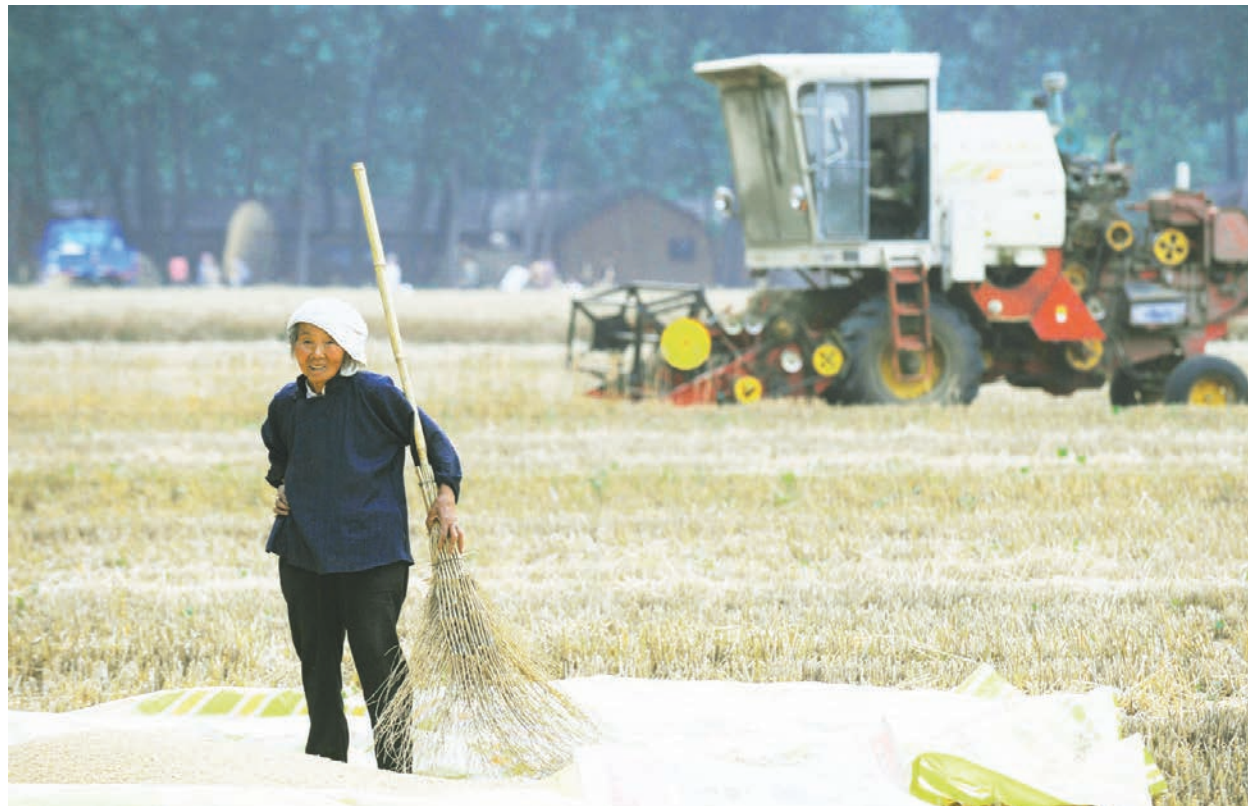
疫情下，中國大陸在全球大規模採購生活物資。

遼衛在接受官媒採訪時表示，中國糧食儲備充足，能夠自給自足。小麥、稻穀等口糧品種庫存，處於歷史最高水平。而中國進口的大米僅占大米消費總量的1%。