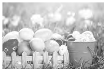
更多的人回歸對神的信仰。

Gbajabiamila在召見中共駐尼日利亞大使周平劍時，公開批評北京，並要求對方向北京通報及瞭解情況，再向其回復結果。尼日利亞外交部長奧涅亞馬(Geoffrey Onyeama)也召見中共駐尼日利亞大使並表示「極為關切」，要求北京立即作出反應。