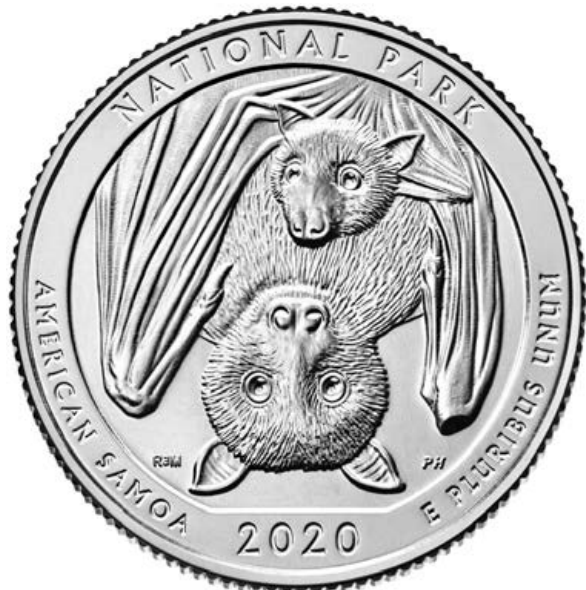
美屬薩摩亞美屬薩摩亞國家公園紀念幣