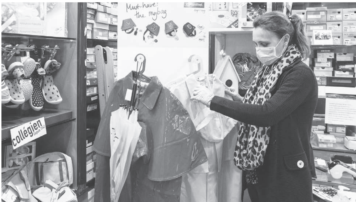
意大利各方疫情數據已呈現趨緩，當局為顧及小本生意的普羅大眾，近期優先讓小商家開張交易。

不過在約翰遜出院並與未婚妻西萊茲重聚後不久，英國官方公布的最新統計數字顯示，英國病毒確證死亡人數已經破萬。英國政府其中一位顧問專家法蘭教授警告說，英國最終可能成為疫情死亡人數最多的歐洲國家。