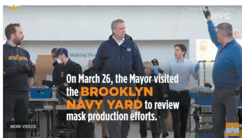
白思豪市長近日訪問了布魯克林的製作面罩工廠。

總部位於印第安納州的 Aria Diagnostics 近日向紐約捐贈 5 萬個測試套件。從 4 月 20 日開始，紐約市經濟發展公司 (EDC) 將