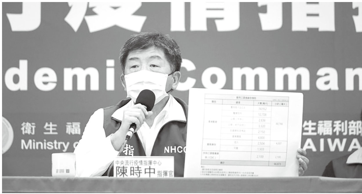
臺灣睽違36天再次迎來0確診，由於臺灣亮眼的防疫，讓澳洲朝野國會議員紛紛力挺臺灣加入WHO。(中央社)

此次與過往不同，澳洲執政自由黨參議院議員派特森（James Paterson）坦言，臺灣不應該被排除在WHO之外。「有鑑於（臺灣）至今在對抗冠狀病毒上的卓越表現，他們持續被排除在外是很可恥、很危險的。」至於在