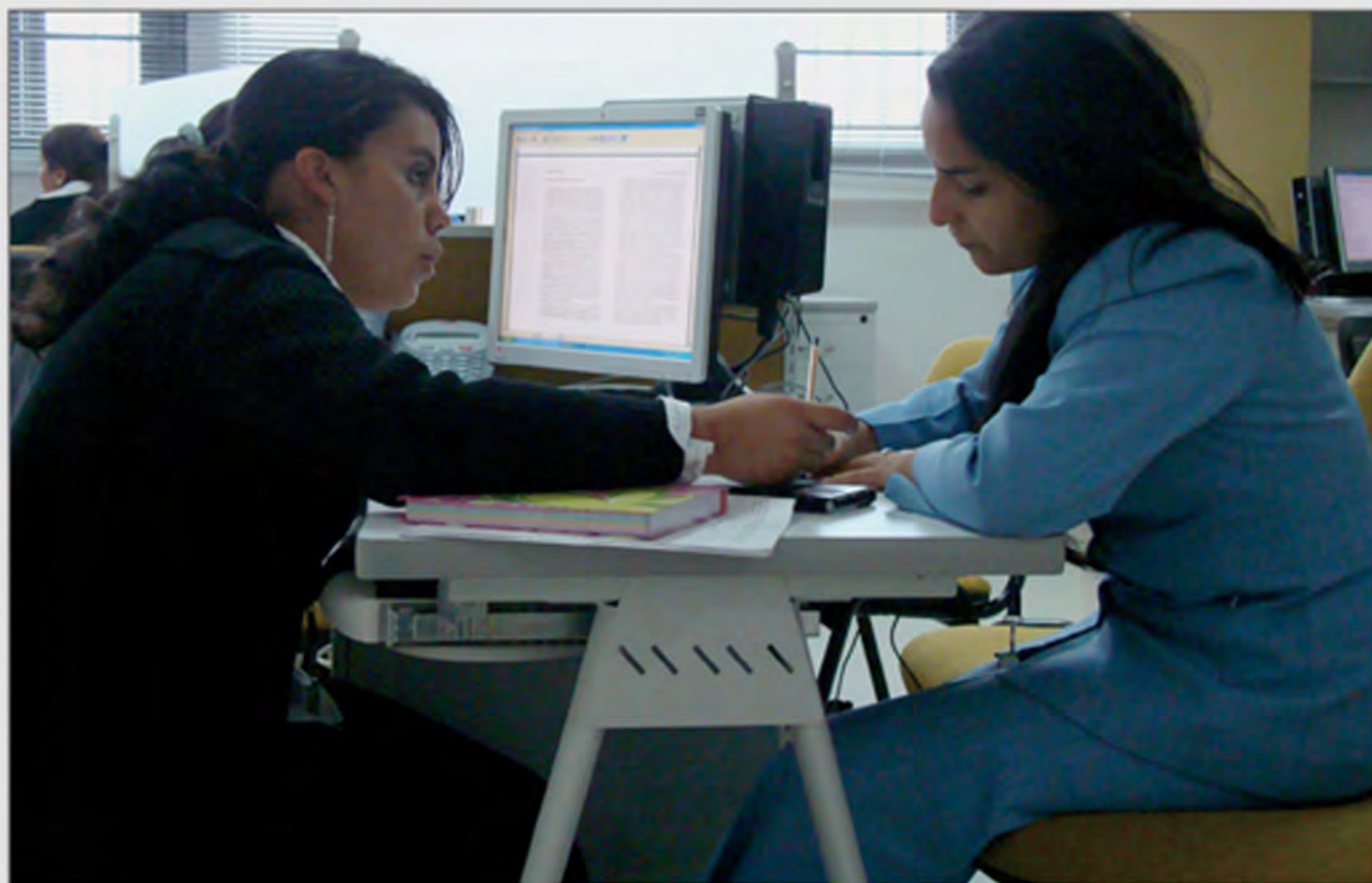
Centro de Atención a Víctimas CAV - Complejo Judicial Paloquemao