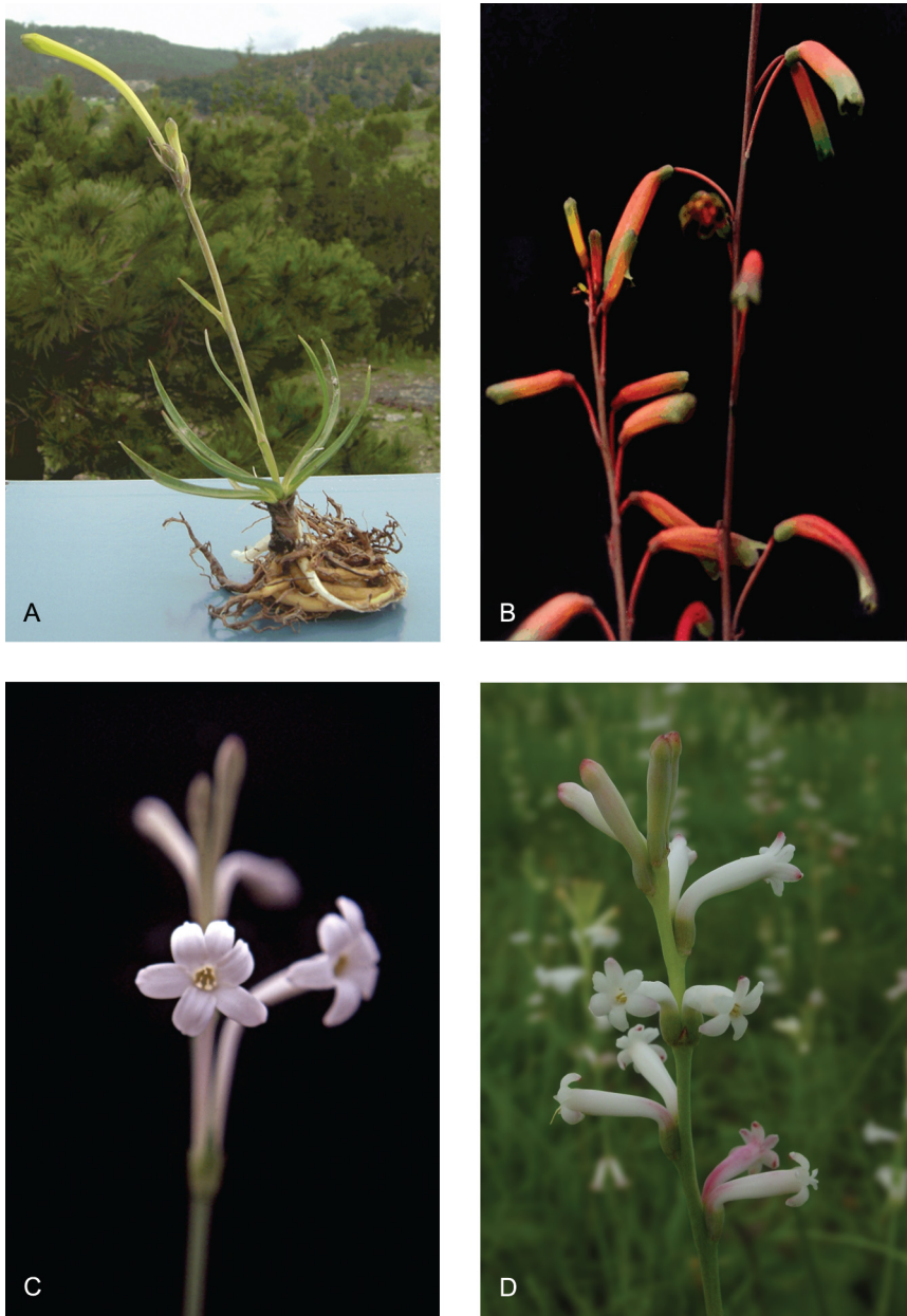
Fig. 2. A. Polianthes densiflora (B. L. Rob. & Fernald) Shinnery (Foto: E. Solano C.); B. P. howardii Verh.-Will. (Foto: C. Castillejos); C. P. longiflora Rose (Foto: E. Solano C.); D. P. platyphylla Rose (Foto: A. Rodríguez C.)