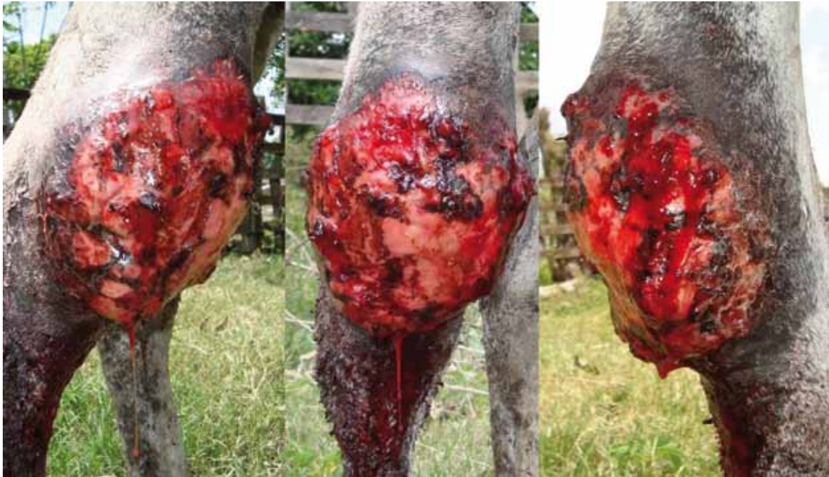
Figura 2. Compresión del granuloma con evidencia de trayectos fistulosos con salida de material blanco-amarillento llamados kunkers