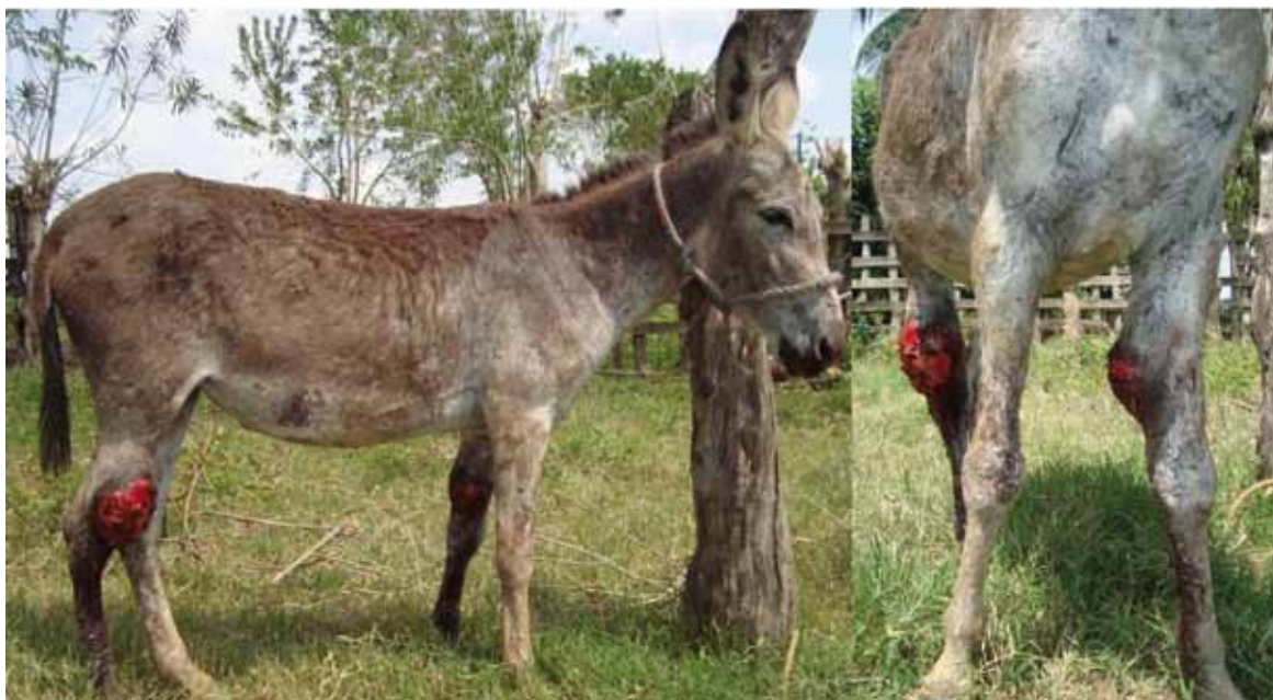
Figura 3. Ulceración granulomatosa y sobresaliente de la piel, a nivel de miembro posterior derecho y anterior izquierdo en una burra de 78 meses

La pitiosis es una de las causas más comunes de lesiones cutáneas en equinos, principalmente en épocas lluviosas, donde se forman cuerpos de aguas e inundaciones, por lo que se prenden las alarmas en torno a la vigilancia de la enfermedad en equinos de zonas inundables del departamento de Córdoba, Colombia, ya que la pitiosis es una de las enfermedades dermatológicas con mayores tasas de morbilidad y mortalidad en equinos, por lo que las condiciones agroecológicas son determinantes para el desarrollo del organismo en su ecosistema, debido a que la producción de zoósporos se da a temperaturas entre 30 y 40 °C y por acúmulo de agua e inundaciones (2), lo que coincide con lo reportado con Santuario et ál. (24), quienes expresan que la gran mayoría de los casos de pitiosis fueron observados durante o después de la estación lluviosa como sucede en algunos departamentos de la costa atlántica colombiana.