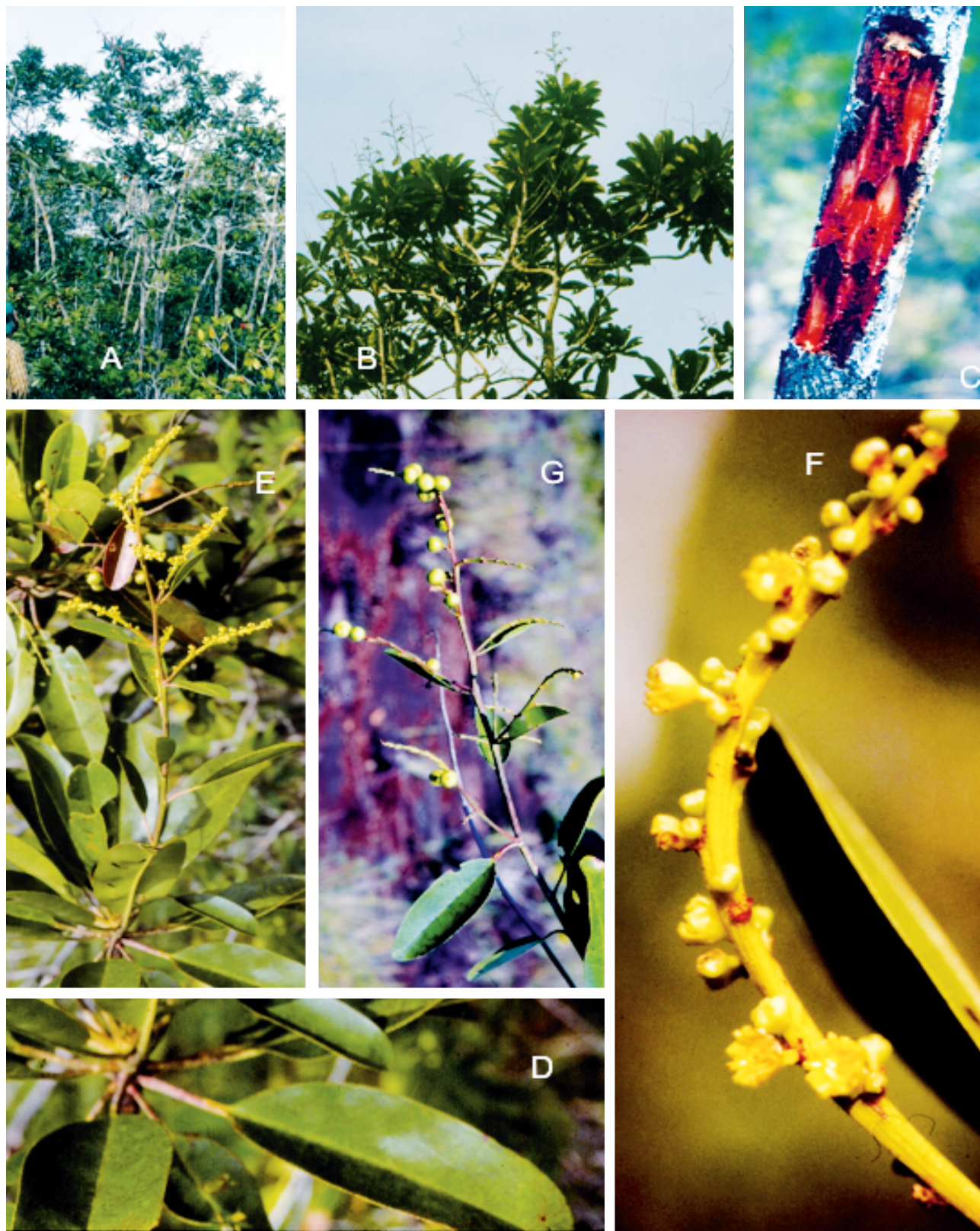
Fig. 2. Aracuara vetusta Fern. Alonso: A , porte de la planta en su ambiente natural; B , detalle de las partes superiores de la planta; C , detalle de la corteza interna y externa de un tronco; D , disposición de las hojas en un fascículo terminal; E , rama fértil con inflorescencia paniculiforme, partiendo de un fascículo de hojas; F , detalle de una rama primaria de la panícula, con grupos de fascículos de flores de origen cimoso, en antesis; G , rama fértil con frutos jóvenes en su posición natural. (de la población donde se recolectó el tipo: M.V. Arbeláez & al. 11455 ).