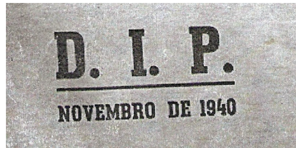
Figura 2. Carimbo do DIP presente no verso da capa da cartilha “Getúlio Vargas: O Amigo das Crianças”.

Figure 2. DIP stamp on the back cover of booklet “Getúlio Vargas: Friend of Children”.