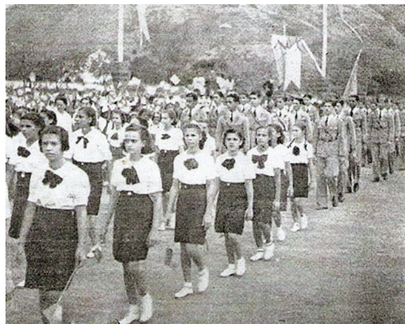
Figura 7. Patriotismo na cartilha "Getúlio Vargas: o amigo das crianças".

E continua argumentando que "façam o que fizerem os autores, não escrevem livros, os livros não são de modo algum escritos. São manufaturados por escribas e outros artesãos, por mecânicos, outros engenheiros e por impressores e outras máquinas" (Chartier, 1990, p. 126).