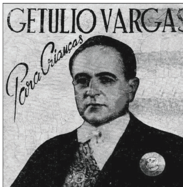
Figura 4. Capa da cartilha “Getúlio Vargas para crianças”. Figure 4. Cover of the booklet “Getúlio Vargas for Children”.

Já, a cartilha “Getúlio Vargas para Crianças” (Figura 4) foi escrita por Alfredo Barroso, ilustrada por Francisco Dias da Silva e editada em 1942. Publicada pela Empresa de Publicações Infantis Ltda., no Rio de Janeiro e financiada pelo Departamento de Imprensa e Propaganda. O formato do material é 13 x 11,5 cm, acompanhado de 112 páginas, sendo elas distribuídas entre um texto de tom formal, de fácil compreensão e de 52 ilustrações