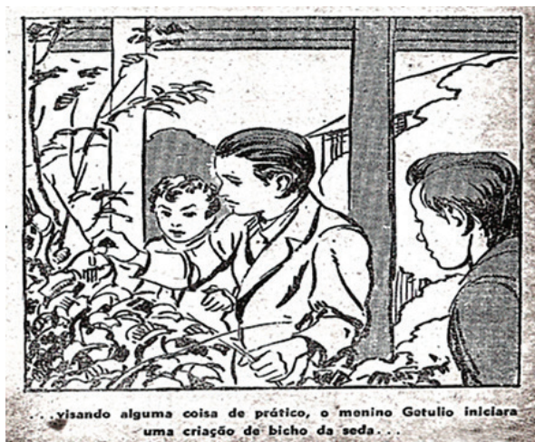
Figura 6. Iniciativa pessoal na cartilha "Getúlio Vargas para crianças" Figure 6. Personal initiative in the booklet "Getúlio Vargas for Children".