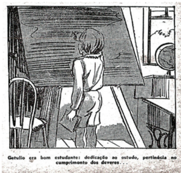
Figura 5. Disciplina escolar na cartilha "Getúlio Vargas para crianças" Figure 5. School discipline in the booklet "Getúlio Vargas for Children".