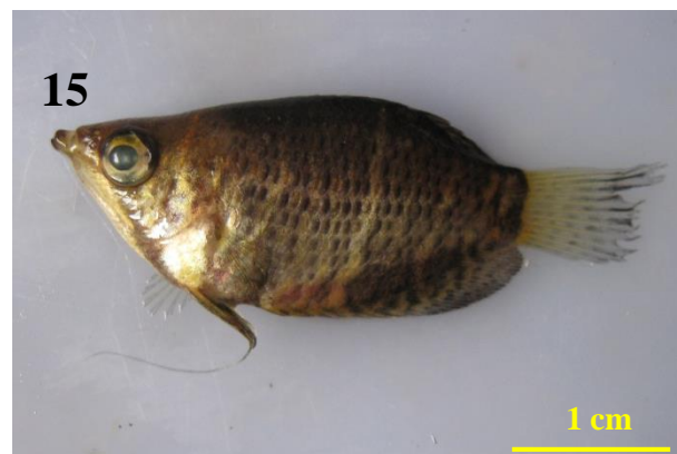
Gambar 2. Spesies endemik Kalimantan yang ditemukan di perairan gambut Arut-Kumai, Kotawaringin Barat: (1) Desmopuntius rhombochellatus , (2) Nemachilus saravacensis , (3) Hemibagrus sabanus , (4) Rasbora kalbarensis , (5) Nematabramis borneensis , (6) Labiobarbus festivus , (7) Kryptopterus lais , (8) Phalacrotonotus parvanalis , (9) Osteochilus kelabau , (10) Hemirhamphodon chrysopunctatus , (11) Hemirhamphodon tengah , (12) Betta anabatoides , (13) Betta dimidiata , (14) Betta patoti , (15) Sphaerichthys selatanensis .