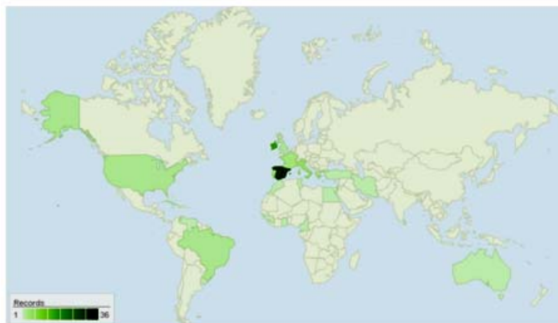
Figura 2. Distribución de Gigartina acicularis (Roth) J.V.Lamouroux, 1813.

Gigartina skottsbergii . Tiene un distribución sobre Sur América, donde se ha reportado en Argentina (Boraso & Zaiso, 2011), en Chile (Buschmann, et al. 2001), en las Islas Malvinas (Wincke & Clayton, 2002), y sobre Antartida y en algunas Islas Subantárticas (Figura 3) (Guiry, M.D. & Guiry, G.M. 2011).