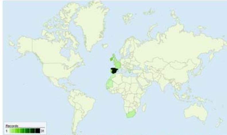
Figura 4. Distribución de Gigartina pistillata (S.G.Gmelin) Stackhouse, 1809.