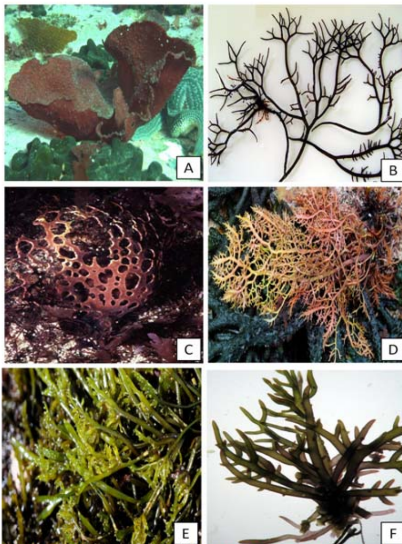
Figura 1. Algunos representantes del género Gigartina . A: Gigartina skottsbergii Setchell & N.L.Gardner., B: G. pistillata (S.G.Gmelin) Stackhouse. C: G. bracteata (S.G.Gmelin) Setchell & N.L.Gardner., D: G. disticha Sonder. E: G. minima Kylin., F: G. brachiata Harvey in J.D.Hooker.