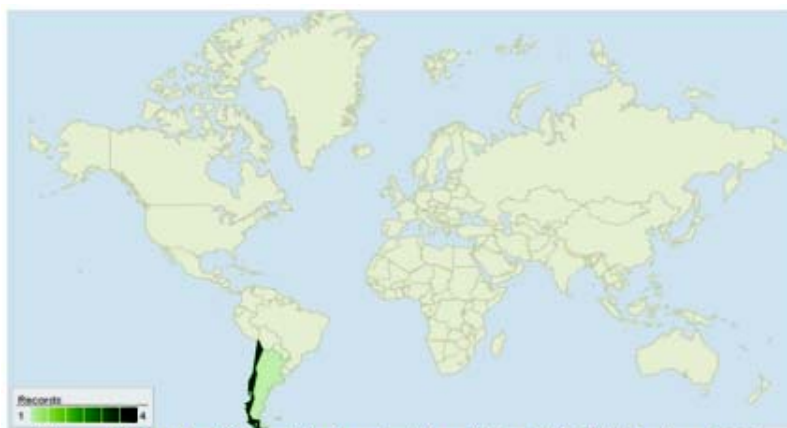
Figura 3. Distribución de Gigartina skottsbergii Setchell & N.L.Gardner, 1936.

Gigartina skottsbergii . Tiene un distribución sobre Sur América, donde se ha reportado en Argentina (Boraso & Zaiso, 2011), en Chile (Buschmann, et al. 2001), en las Islas Malvinas (Wincke & Clayton, 2002), y sobre Antartida y en algunas Islas Subantárticas (Figura 3) (Guiry, M.D. & Guiry, G.M. 2011).