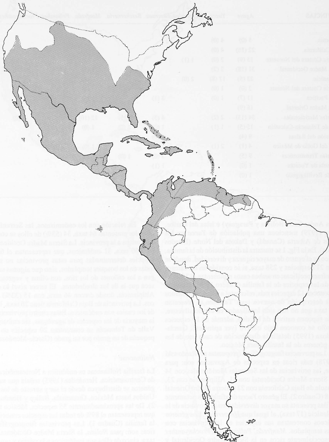
FIGURA 1. Distribución de la familia Agavaceae.