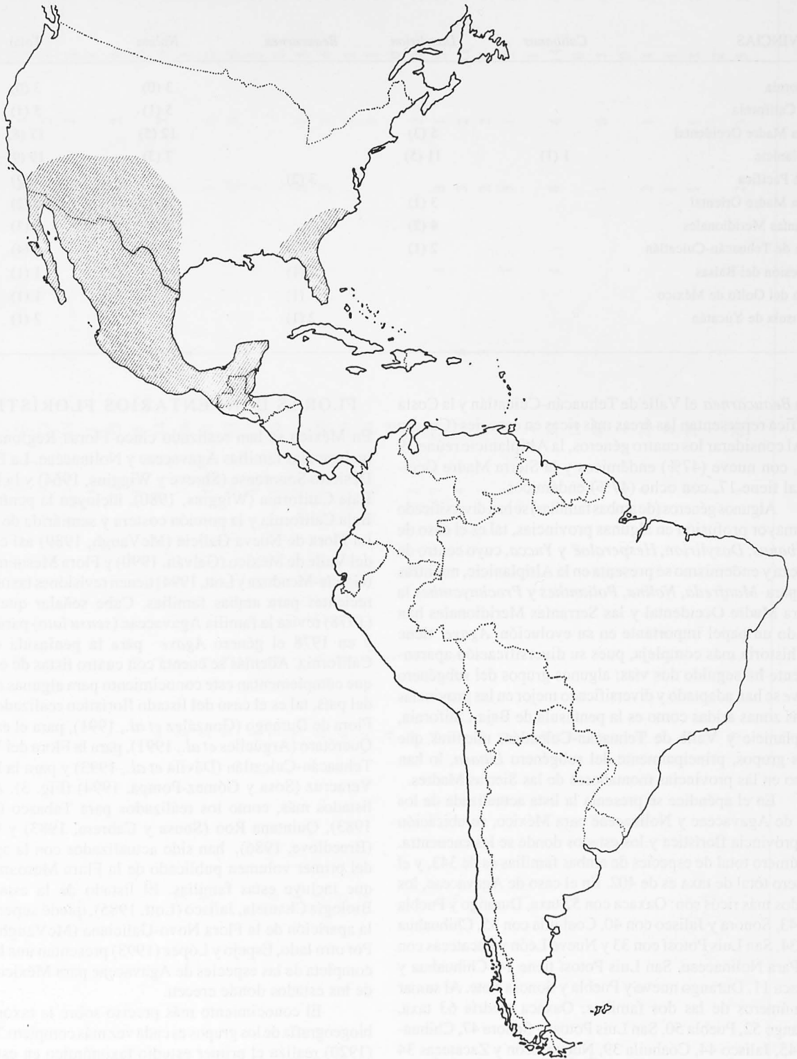
FIGURA 2. Distribución de la familia Nolinaceae (modificado de Hernández, 1993).