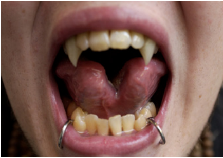
Abb. 7 25-jähriger Tattoo-Künstler mit tongue splitting, Lippenpiercing und Eckzahnkronen in Form von Reißzähnen