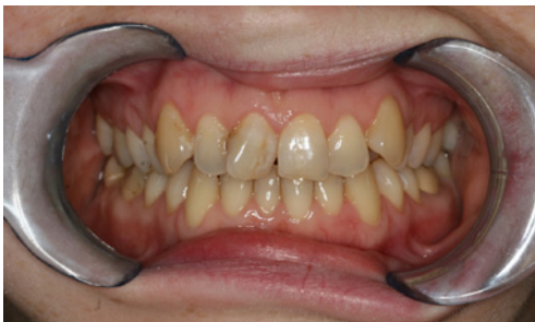
Abb. 2 Vorher: Idealisierung der Zahnstellung und Zahnform bei einer erwachsenen Patientin durch kieferorthopädische Behandlung

Die Kieferorthopädie ist im Rahmen der Körpermodifikationen auch deshalb ein Sonderfall, weil die erreichten Ergebnisse nicht nur ästhetisch, sondern häufig auch funktionelle (z.B. für Kaufunktion und Sprache) Verbesserungen bedeuten. Dies trifft für die allerwenigsten Elemente des invasiven Körperkultes zu.