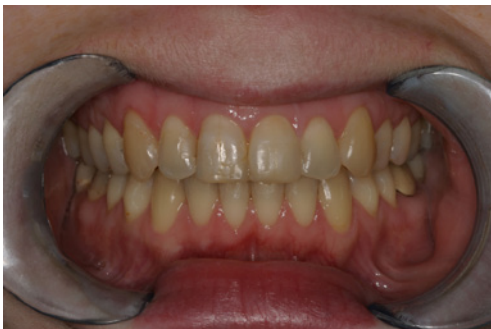
Abb. 3 Nachher: Idealisierung der Zahnstellung und Zahnform bei einer erwachsenen Patientin durch kieferorthopädische Behandlung