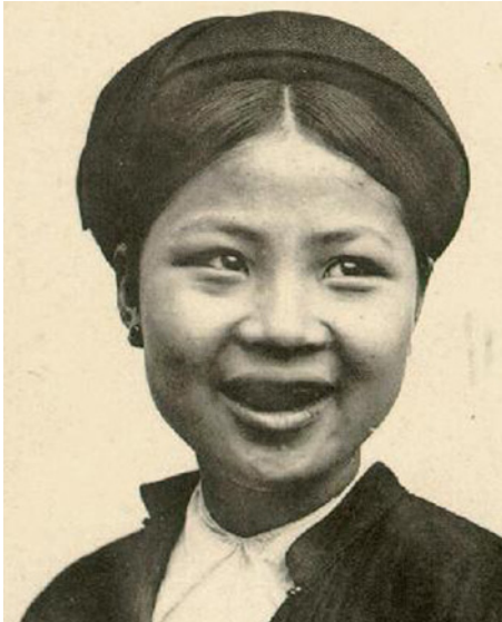
Abb. 11 Porträt einer vietnamesischen Frau mit geschwärzten Zähnen (Tonkin ca. 1905, Public Domain, http://nguyentl.free.fr/autrefois/scenes/peuple/tonkin_femme1.jpg )

Auch wenn die meisten der genannten Maßnahmen nicht aus Eitelkeit erfolgen, so werden sie offenbar dennoch als schön empfunden. Das zugrundeliegende ästhetische Empfinden kann mit dem in Europa bis heute nachwirkenden klassizistischen Ideal der Makellosigkeit nicht verglichen werden.