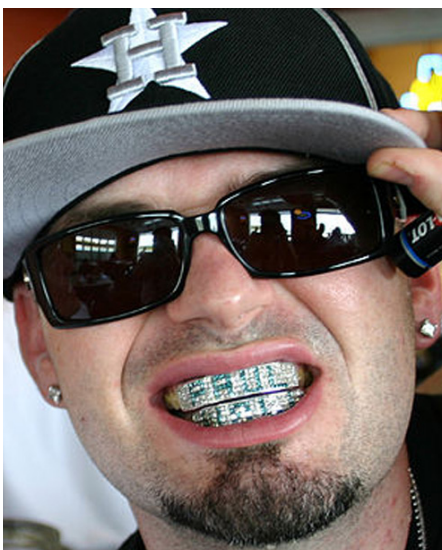
Abb. 6 Rapper Paul Wall mit Grillz (Creative Commons Licence, http://en.wikipedia.org/wiki/ File:Paul_Wall.jpg#file )

Eine besonders außergewöhnliche Zahnverblendung stellen Kronen in Form von Vampir- oder Raubtierzähnen dar (s. Abb. 7).