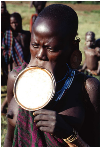
Abb. 8 Surma-Frau mit eingesetztem Lippenteller (Sammlung Dr. Garve, Private University Krems)

Während das tongue splitting in Nordamerika und Europa als relativ neuer Trend gelten kann, sind vergleichbar invasive Eingriffe an den Lippen bei Völkern in Nordostafrika und Südamerika seit langem in Gebrauch. Bekannt ist das „Lippentellern“ z.B. bei den Frauen der Mursi und Suri (Äthiopien, früher auch in Tschad und Sudan weit verbreitet). Hierbei werden Ober- bzw. Unterlippe unter Erhalt der Kontinuität des Lippenrotes aufgeschnitten und mit Ton- oder Holzscheiben gedehnt (s. Abb. 8). Neben runden, massiven Tellern sind auch Ringe bzw. Trapeze im Einsatz (van der Steppen 1996). Ähnlich beeindruckende Modifikationen lassen sich bei zahlreichen südamerikanischen Völkern nachweisen, so z.B. bei den Zoé, den Yanoama, den Surui und den Cayapó. Die Zoé beginnen bei beiden Geschlechtern mit dem Durchstechen der Unterlippe bereits im 7.-8. Lebensjahr und setzen einen Holzpflock ein (s. Abb. 9). Infolge der Verwendung immer größerer Pflöcke wird der Defekt