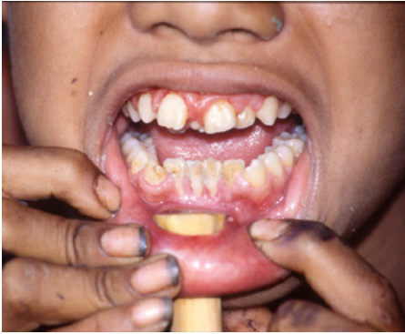
Abb. 9 Zoe-Indianer mit eingesetztem Lippenpflock