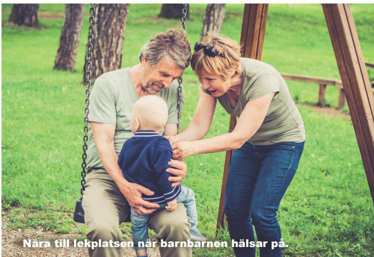
Nära till lekplatsen när barnbarnen hälsar på.