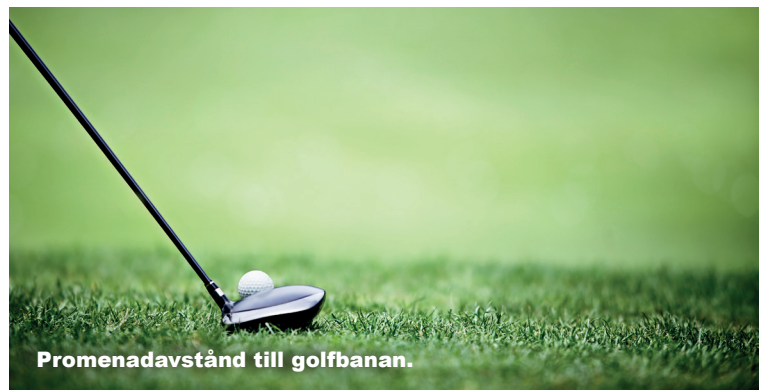
Promenadavstånd till golfbanan.