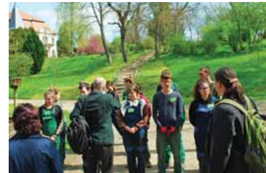
A versenyzők gyakorlati feladataik előtt