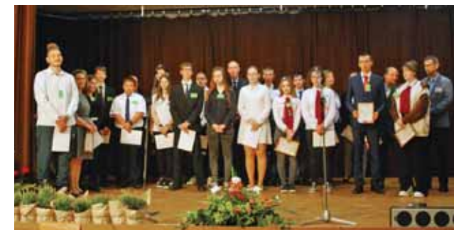
Versenyzők és felkészítőik a díjátadón

A kétnapos rendezvényhez támogatók sora adta nevét és ajándékait, többek között az Agrárminisztérium, az Auchan Maglód, az Anger Kertészet, a Gardena, a Specialmix Kft. és a Pálmaház Kertészet. A támogatók között többen az iskola volt tanulói, akik azóta szakmájuk elismert képviselői.