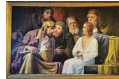
Lingauer István festménye, a „12 éves Jézus és a vének”