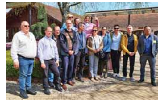
Kirándulás a Lázár Lovasparkban