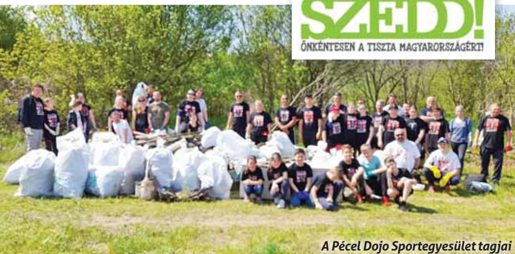
A Pécel Dojo Sportegyesület tagjai