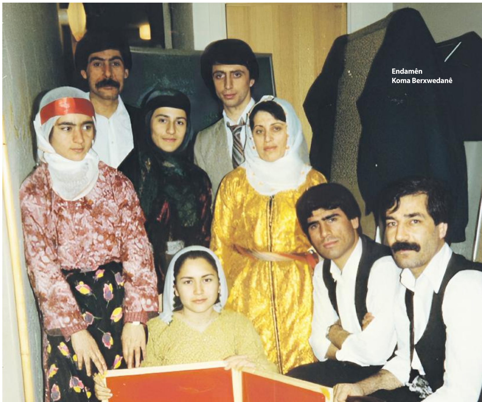
Endamên Koma Berxwedanê