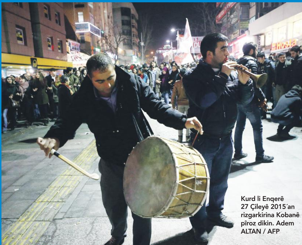
Kurd li Enqerê 27 Çileyê 2015'an rizgarkirina Kobanê pîroz dikin.

Muzîk, di têkoşînên milletan a ji bo azadî û rizgariyê de her tim bûye mezintirîn amûrê motîvasyonê. Lê belê dîtina muzîkê bes wekî amûrê motîvasyonê mezintirîn xefka giştî ye. Wekî hunerên din hemûyan, muzîk jî yek ji karîgertirîn amûrên polîtîk yên wan millet û civakan e ku li felata xwe digerin. Bindest, bi rêya muzîkê li aliyekî daxwazên xwe yên civakî, arezû û dîroka xwe vediguhezînin nîfşên nû, li aliyê din jî karakter û taybetmendiyên bingehîn ên têkoşînê diyar dikin. Koma Berxwedanê jî di têkoşîna rizgariyê ya milletê Kurd de xwe da ber mîsyoneke wiha. Dema mirov behsa muzîka şoreşgerî û propagandayî bike, li ser navê muzîka Kurdî, bêguman serê pêşî, Koma Berxwedan tê. Helbet wê huner, rêûresmên muzîka Kurdî jî îcra kir, parast û bi pêş ve jî bir. Her çiqas di van salên dawî de sewta wan neyê bihîstin jî berhemên komê li dû xwe hiştî, hîna jî hestên şoreşgerî yên pîrraniya civakê têr dikin. Koma Berxwedan jî bo muzîka Kurdî di nav çarçoveyeke dîrokî de teqabulî serdemekê dike. Serdemekê ku ji bo milletê Kurd têra xwe dijwar e. Lê ew di vê qonaxê de, di vê serdemê de asê nema û hêza xwe ya ragihandinî ew qas xurt emi-