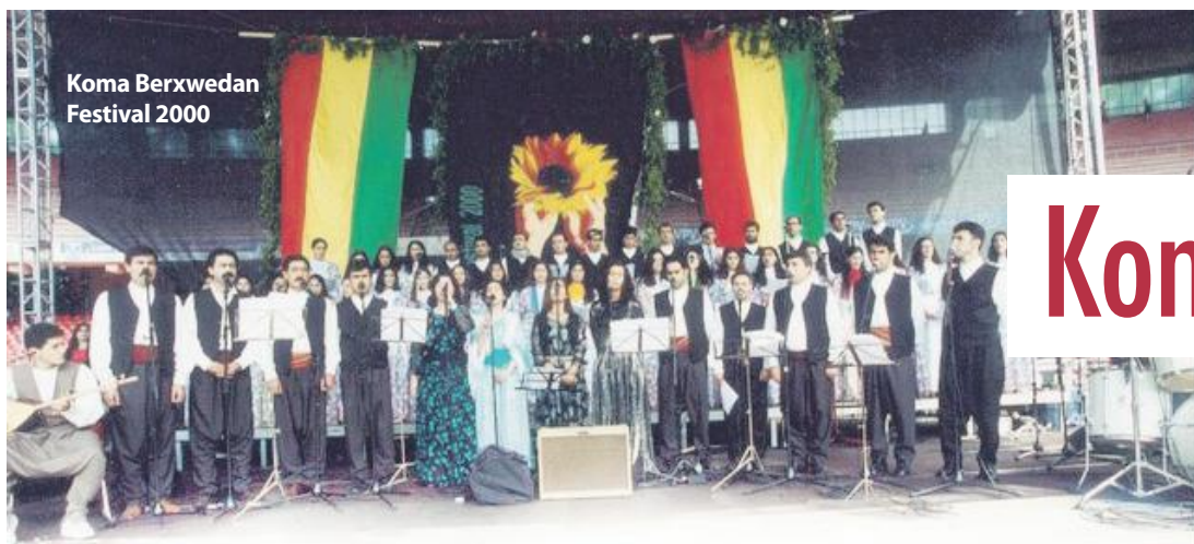
Koma Berxwedan Festival 2000

★ Xebatên Koma Berxwedanê, sala 99'an jî têde, lê bi taybetî di salên 97-98'an de êdî gihîştin asteke têr û tijî. Piştî salên 92-93'an bi telîmata Rêber Apo, bi keda wî, li derveyî welat salê carekê konferanseke çandê pêk dihat ku ji her aliyê Kurdistanê û çîhanê pisporên çand û hunerê, rewşenbîr, wêjekar beşdar dibûn. Di van konferansan de rewşa hunerê Kurdî dihat nîqaşkirin û encamên pir bibandor derdiketin.