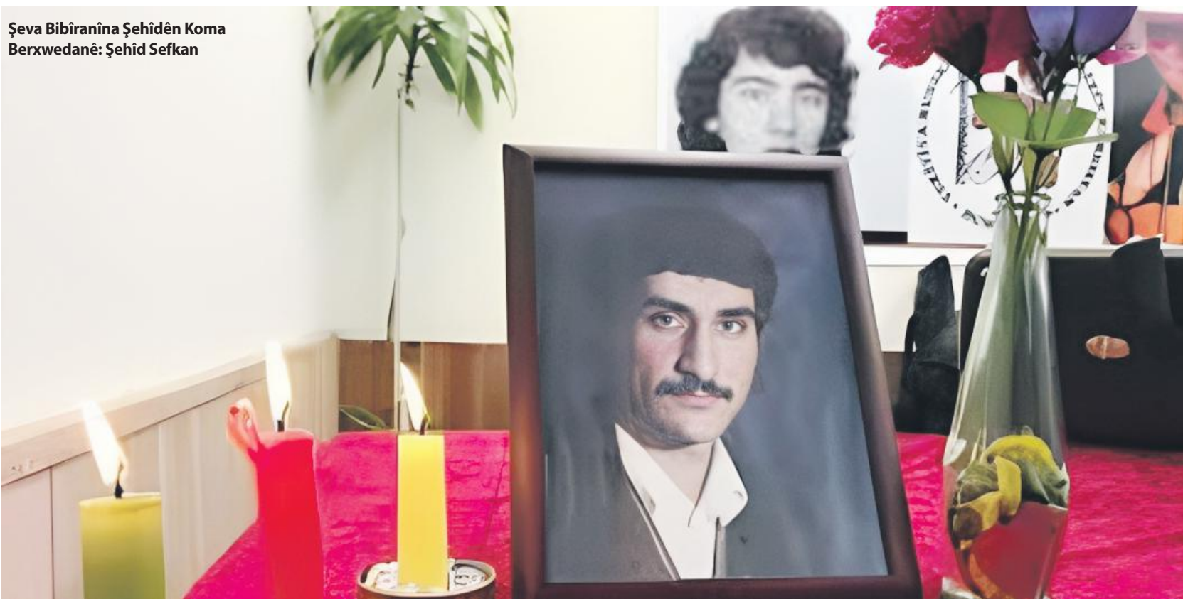
Şeva Bibîranîna Şehîdên Koma Berxwedanê: Şehîd Sefkan

Bêguman xebatên kolektîf jî xebatên giring in, heta salên nodî hem kom mezin bû hem saziya me û şaxên wê mezin û zêde bûn. Dema me pîrozbahî an jî konserên bi gel re çêdikirin, panzde bîst hezar insan kom dibûn. Mirov dikare bibêje partiyên herî mezin ên Ewrûpayê nedikarin evqas insanî kom bikin. Lê me dikarî. Ev jî dibû motîvasyoneke mezin, tu dengê xwe digihîni gel. Serdema propagandayê serdema avakirinê bû. Ew serdemên avakirinê pir taybetiyên cuda hene. Tu nû ava dikî, kelecana wê gelek mezin e, zehmetiyên wê gelek mezin in, endamên te gelekî kê m in, bi tişt a ku te heye tu dimeşîni.