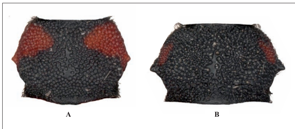
Fig. 2. Pronotum de A) P. globulicollis et B) P. kaehleri . Mêmes individus que Fig. 1.