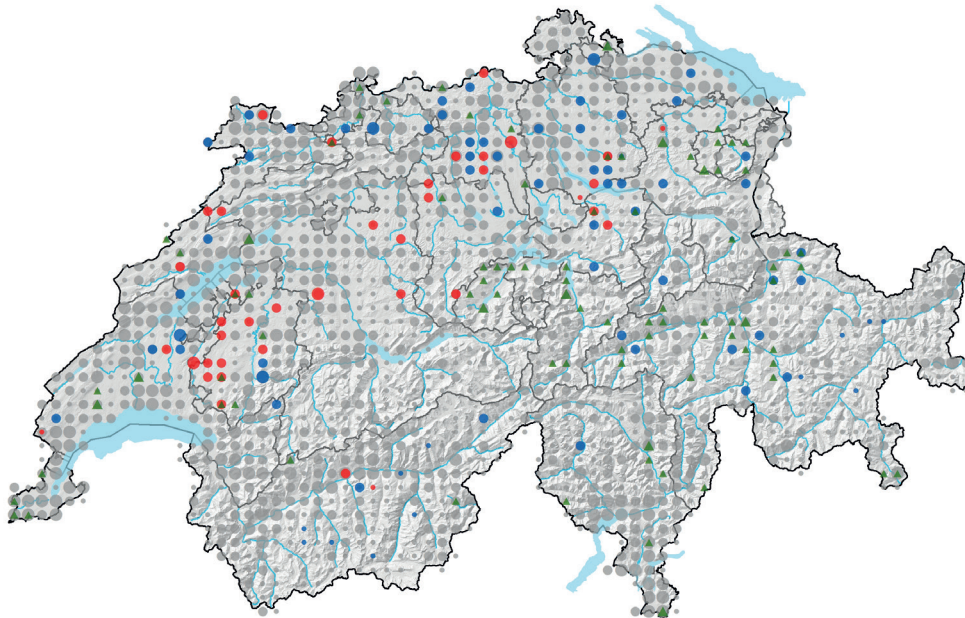
Fig. 1. Localisation des carrés échantillonnés en 2018–2019 ( bleu ) et en 2016–2017 ( rouge ), et des recherches spécifiques ( vert ). Le nombre d'espèces connues par surface de 5 x 5 km est également mentionné ( gris ), selon l'état de la banque de données d'info fauna – CSCF (état 03.02.2020). Taille des points et triangles: petit = 2–24 espèces; moyen = 25–70 espèces; grand = >70 espèces.