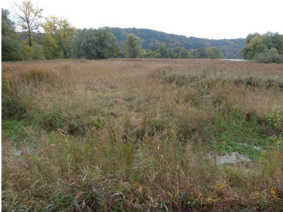
Fig. 4. Lieu de découverte de B. gilvipes en Suisse (Hemishofen SH).

totallement lisses (sauf à l'apex) et sans reflets bleus alors qu'ils sont complètement chagrinés à reflets bleu-vert chez B. schueppelii (Müller-Motzfeld 2006) (Fig. 3). Des recherches complémentaires menées le 12.11.2019 n'ont malheureusement pas permis de découvrir de spécimens supplémentaires de B. gilvipes . Néanmoins, plusieurs autres espèces rares ont pu être découvertes: Agonum lugens , Bembidion fumigatum , Platynus livens et Pterostichus gracilis . Toutes sont nouvelles pour le canton de Schaffhouse.