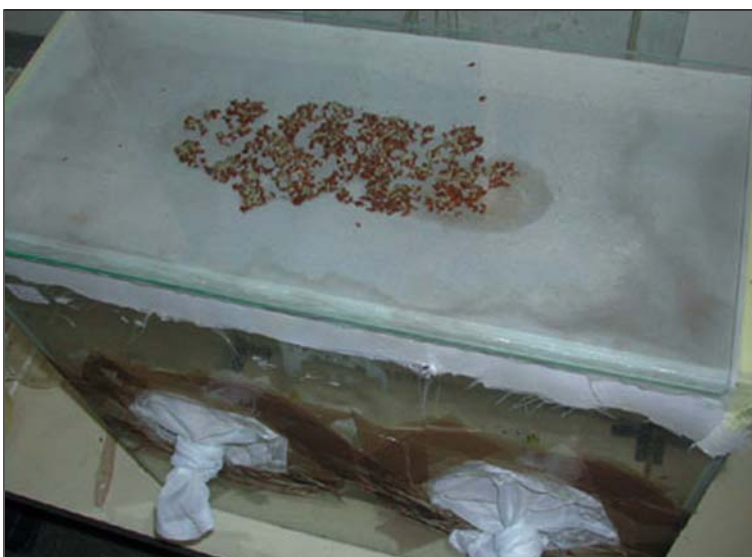
Foto 6. Sistema de puesta para D. tryoni .