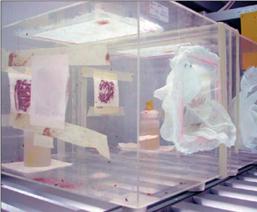
Foto 3. Jaula de adultos de F. arisanus .