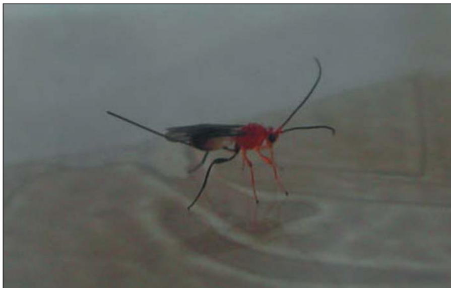
Foto 2. Hembra de D. tryoni .

Actualmente, y en el marco del ya mencionado Plan Integral de Actuación contra la Mosca de la Fruta, de nuevo se ha planteado la posibilidad de utilizar parasitoides exóticos para colaborar en el control de C. capitata . En el Laboratorio de Entomología del IVIA se ha iniciado esta línea de investigación, teniendo en cuenta los nuevos métodos existentes para la cría controlada de la mosca y de sus parasitoides y su posterior liberación en campo, que pueden contribuir a facilitar el éxito de este método de