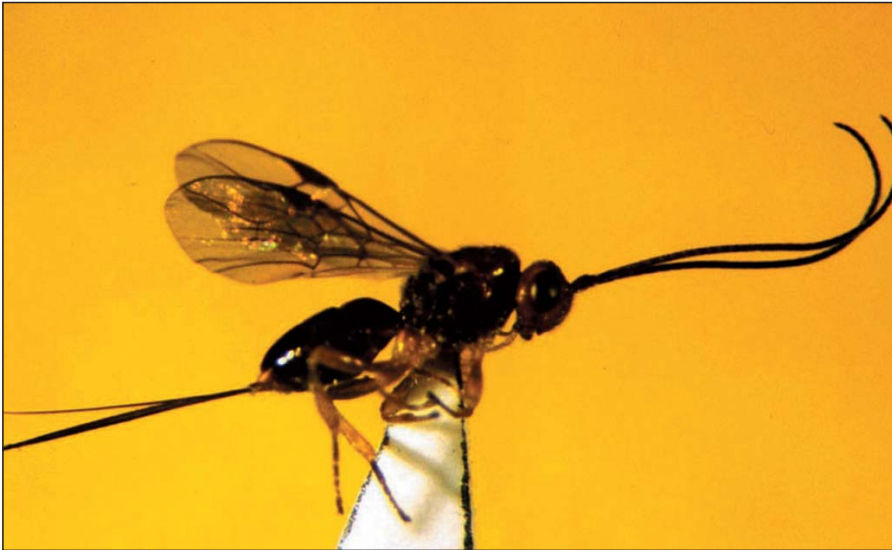
Foto 1. Hembra de F. arisanus ..