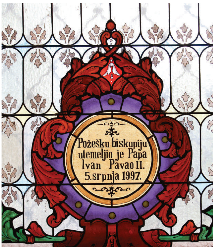
Oslikani prozor na pjevalištu požeške Katedrale

»Tko mene ljubi, njega će ljubiti i Otac moj, i ja ću ljubiti njega i njemu se očitovati« (Iv 14,21). U navedeno zajedništvo uvodi nas Duh Istine tako što u nama čini živim Isusovo djelo pobjede nad smrću te u njemu istina nije tek teoretska razumska spoznaja, nego konkretno životno stanje koje nam Bog daruje. Sveti Pavao uvjerava Rimljane: »Onaj koji uskrisi Krista od mrtvih, oživjet će i smrtna tijela vaša po Duhu svome koji prebiva u vama« (Rim 8,11). Isti Apostol dodaje: »Ta ljubav je Božja razlivena u srcima našim po Duhu Svetom koji nam je dan!« (Rim 5,5). – Ljubav pobjeđuje i daruje život vječni!