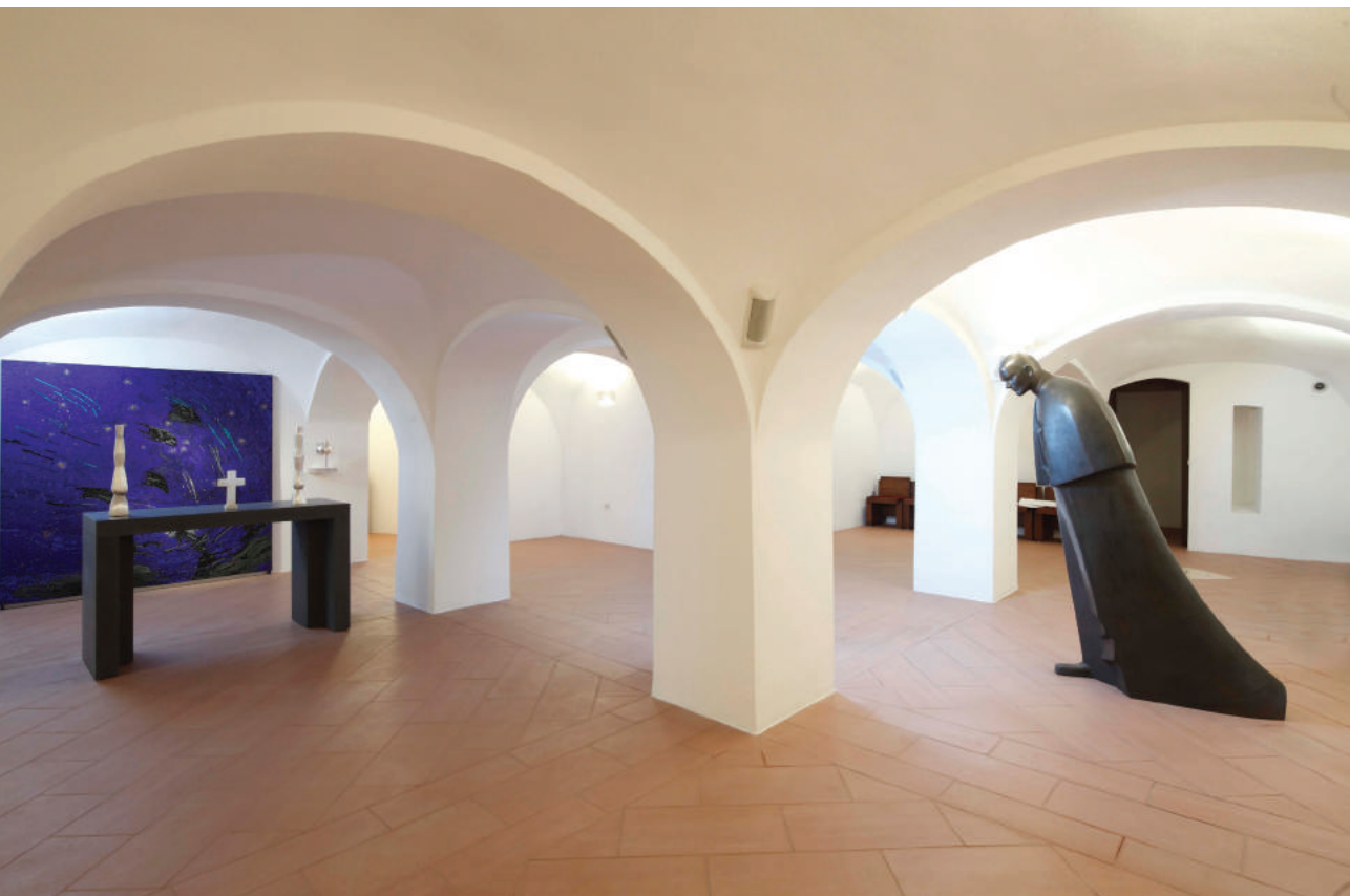
Marija Ujević Galetović, brončani kip sv. Ivana Pavla II., kripta požeške Katedrale

U nedjelju 17. svibnja 2020., u predvečerje 100. rođendana sv. Iva-na Pavla II., svećenici će u svim župama i na svakoj svetoj misi podsje-titi vjernike na dar koji nam je Bog udijelio po životu i služenju pape Wojtyły. Pozvat će ih da mu zahvale za dobrotu, utjehu i ohrabrenje