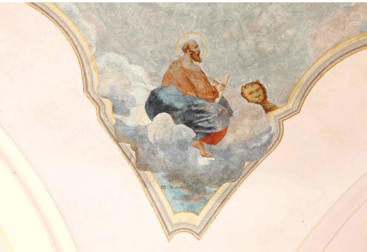
Celestin Medović, Sv. Marko evangelist , freska na svodu požeške Katedrale

Braćo i sestre! Stanje u kojem se trenutačno nalazimo postavlja pitanje: Kako na svjetskoj razini posvjedočiti da smo na temelju sadašnjega iskustva odlučili svoj odnos bahatosti prema Božjem daru popraviti? Kako ugraditi poniznost u svjetski gospodarski sustav da budemo pravedni prema prirodi i svakom čovjeku? Molimo svjetskim vođama svjetlo Božje, da u savjesti prepoznaju što im je činiti i to u djelo provoditi. Amen.