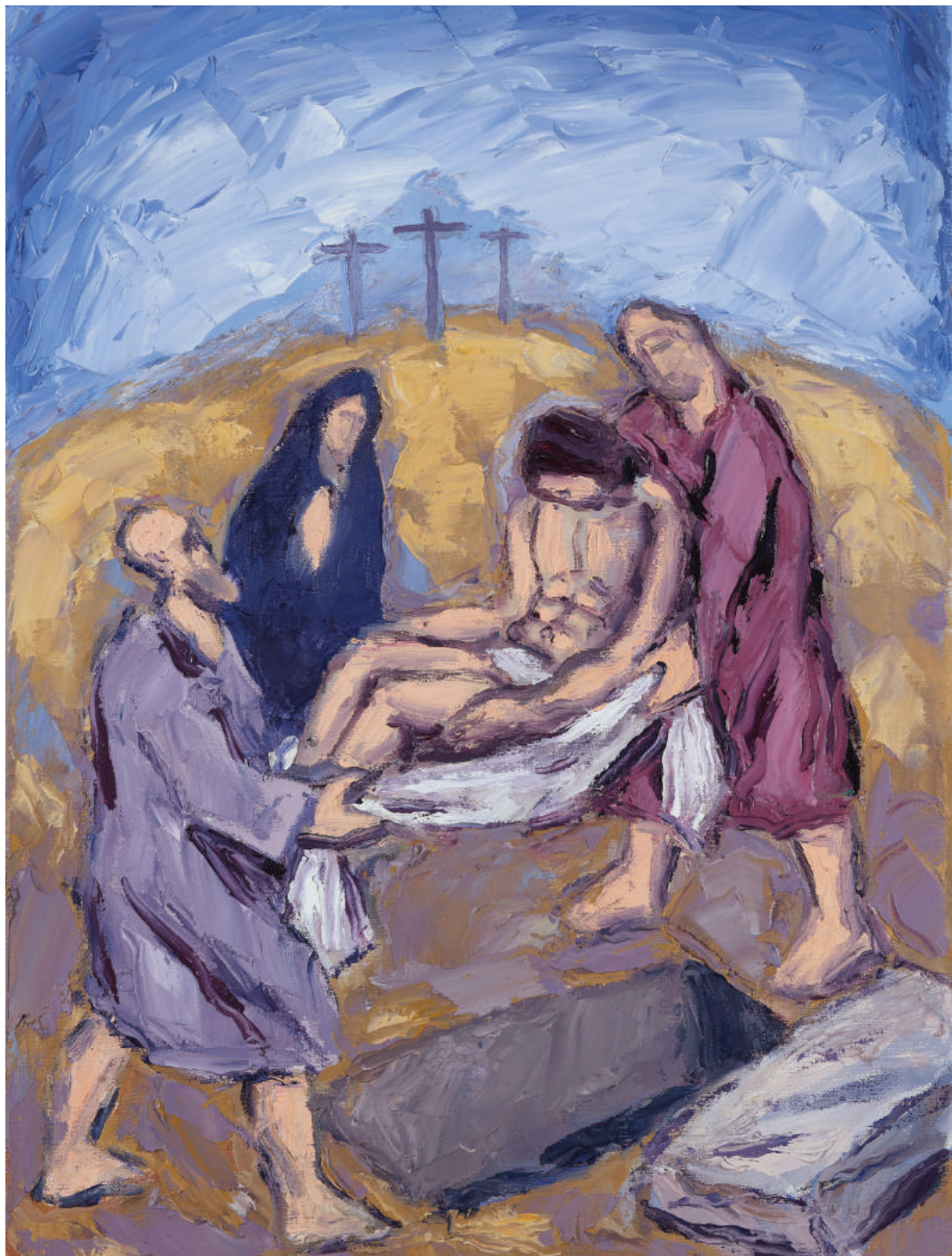
Đuro Seder, XIV. postaja križnoga puta u požeškoj Katedrali