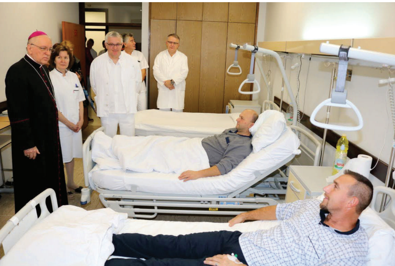
Biskup Antun kod bolesnika u Općoj županijskoj bolnici u Požegi