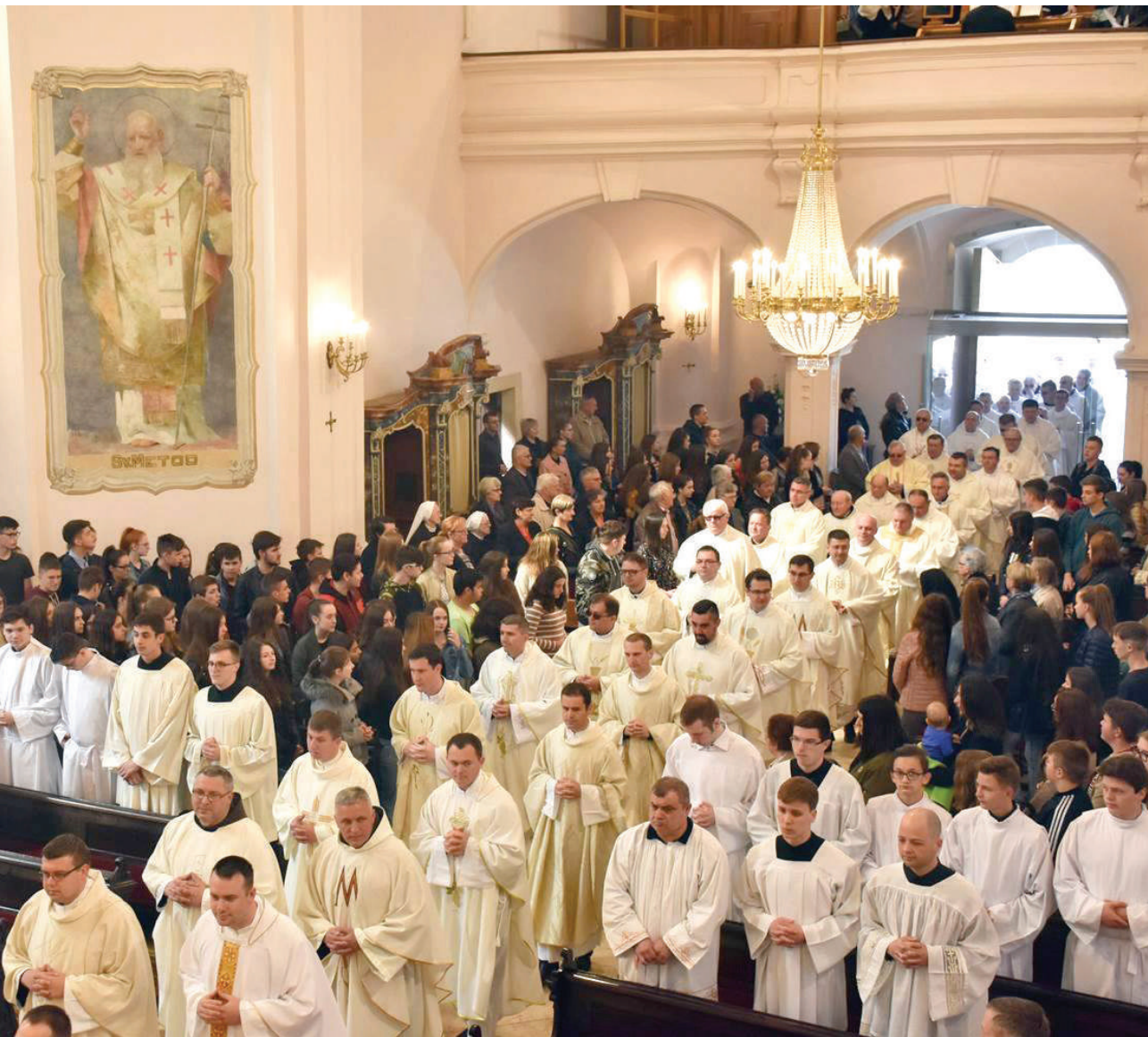
Misa posvete ulja na Veliki četvrtak u požeškoj Katedrali