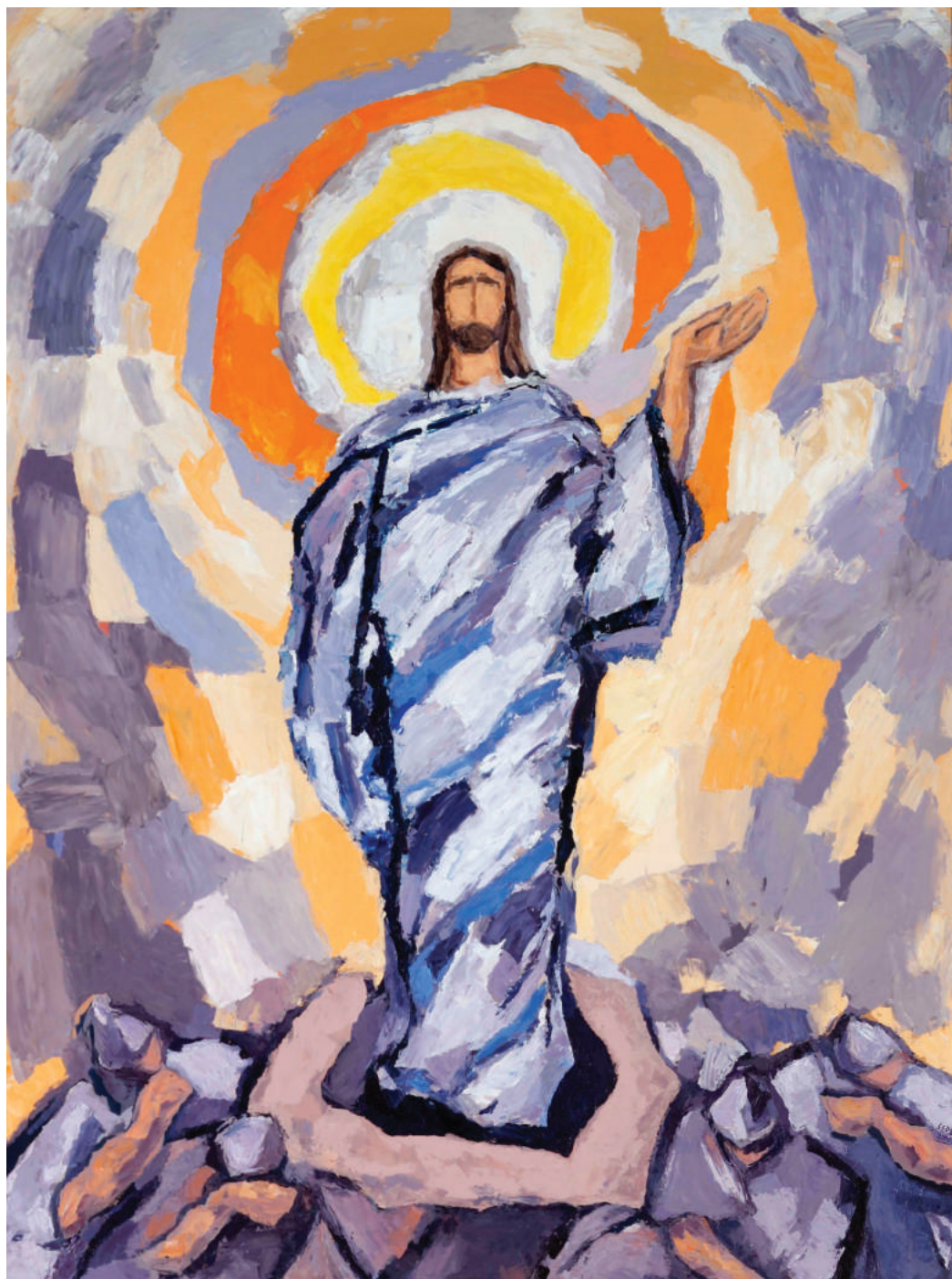
Đuro Seder, Isusovo uskrsnuće , požeška Katedrala