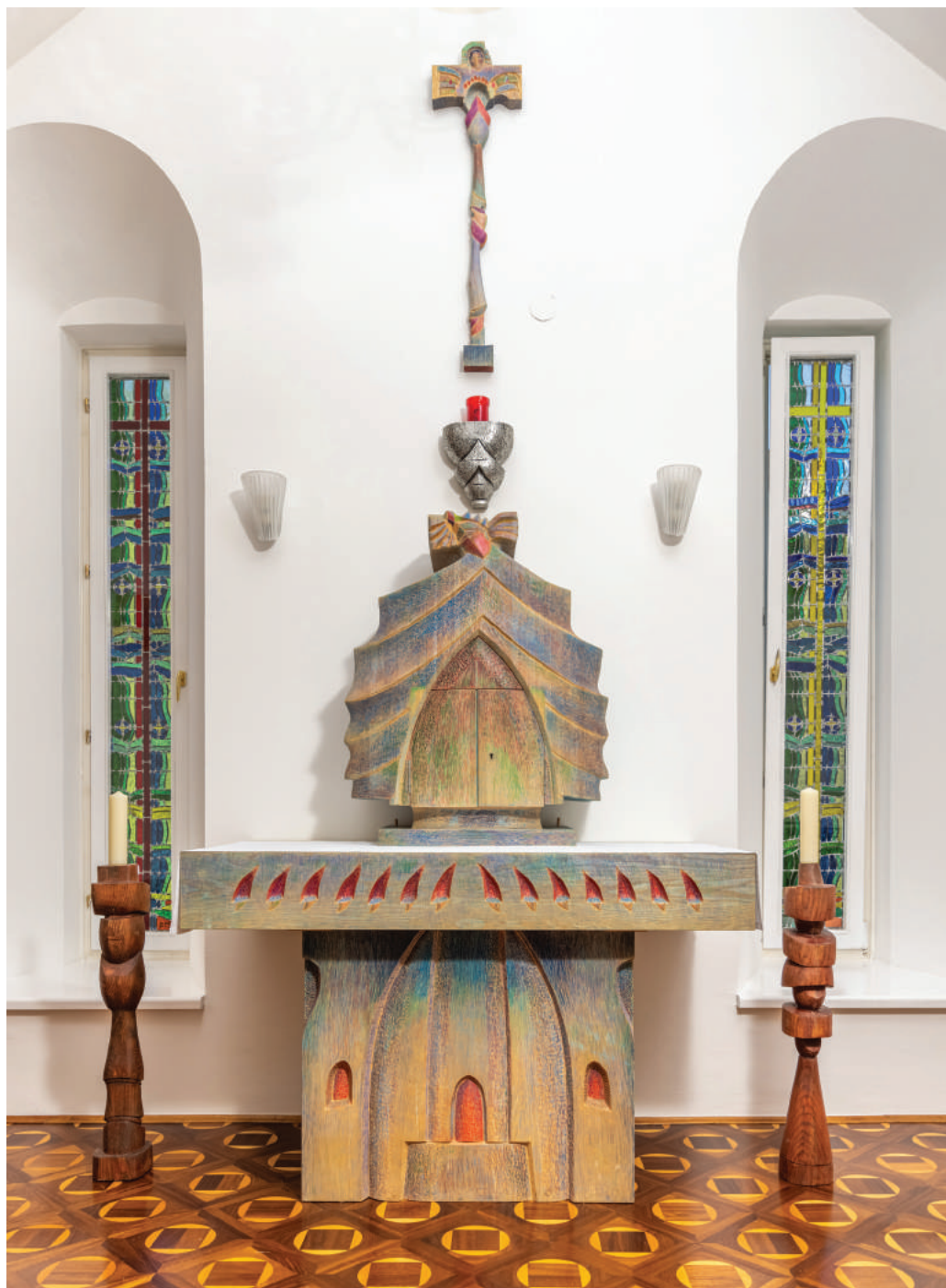
Šime Vulas, drveni oltar, kapela Sv. Josipa Biskupskog doma u Požegji