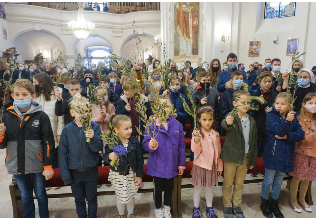
Slavlje Nedjelje Muke Gospodnje u požeškoj Katedrali

Premda izvanredno mudar nositelj Riječi, udaran je po leđima kao luda, okružen je agresivnim prezirom, pljuvanjem u lice i čupanjem brade. On svjesno ide ususret tim posljedicama svoga proročkog služanja jer u njemu trpljenje postiže novo vrednovanje: ono nije više znak odbačenosti nego izabranosti od Boga.