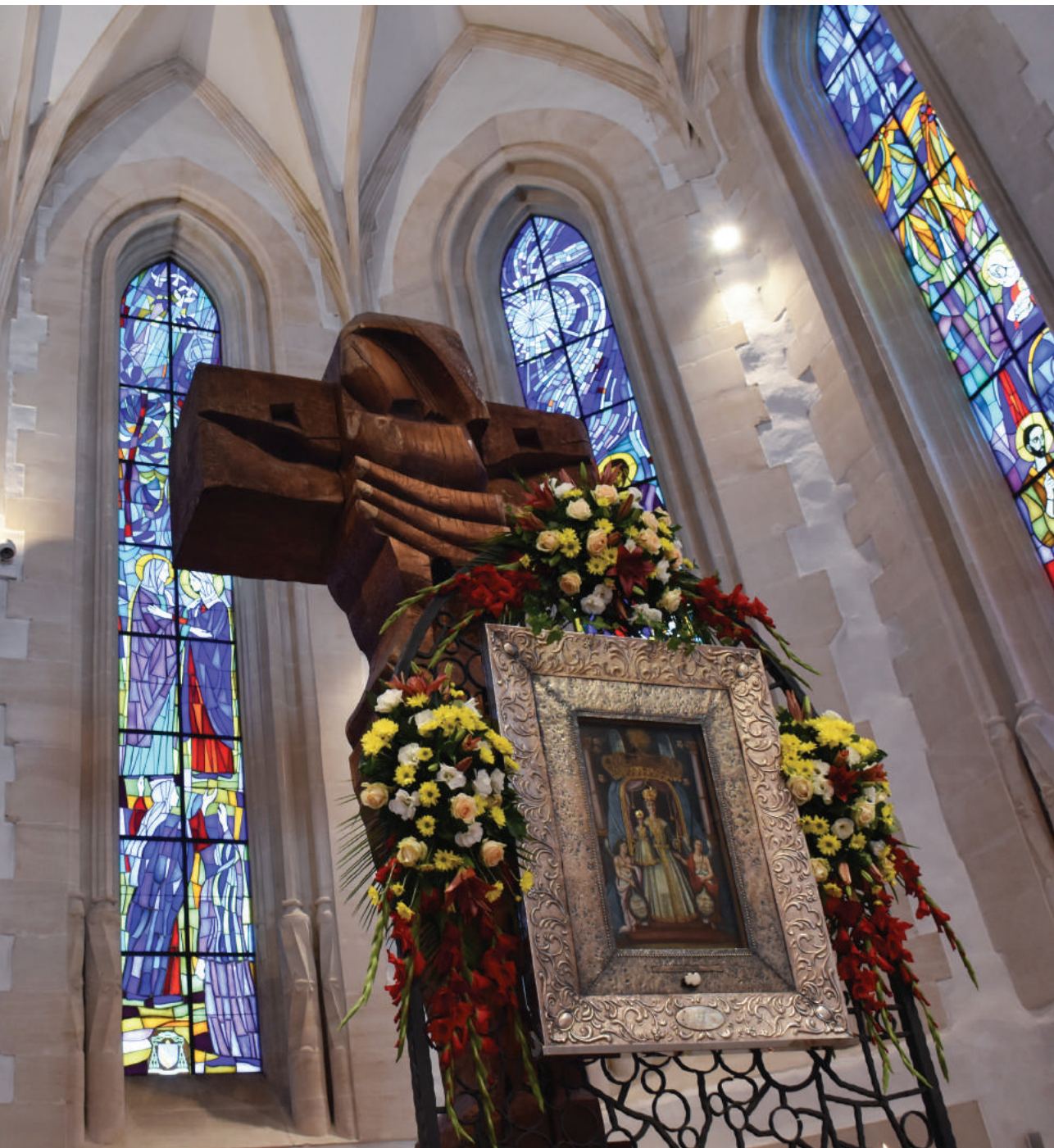
Slika Gospe Voćinske u njezinu svetištu