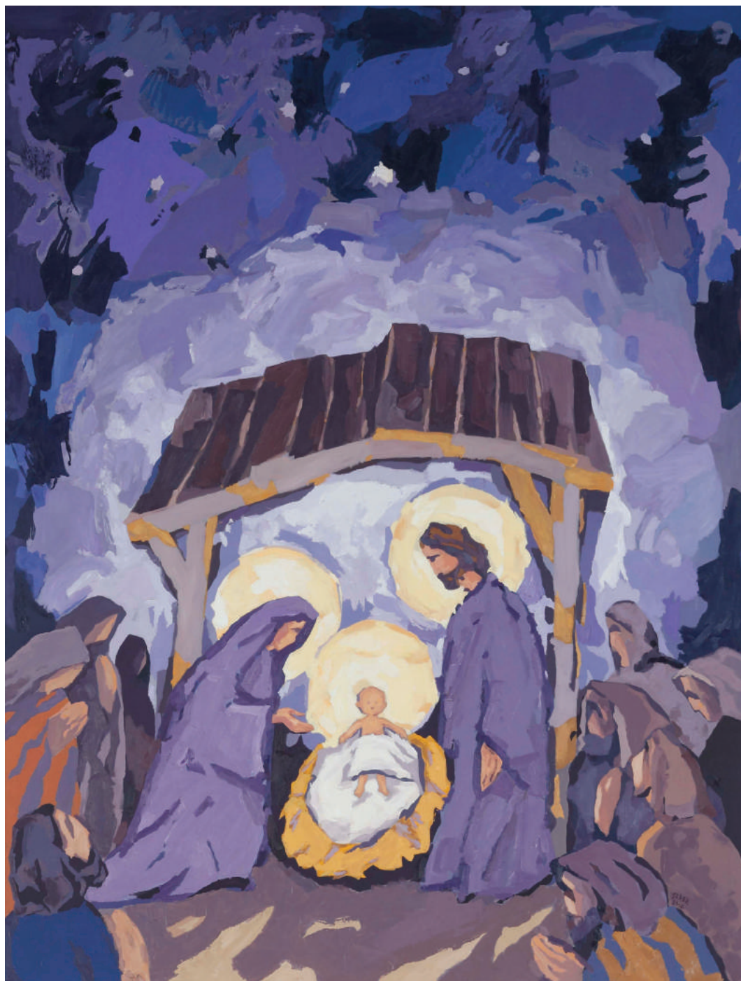
Đuro Seder, Rođenje Isusovo , požeška Katedrala