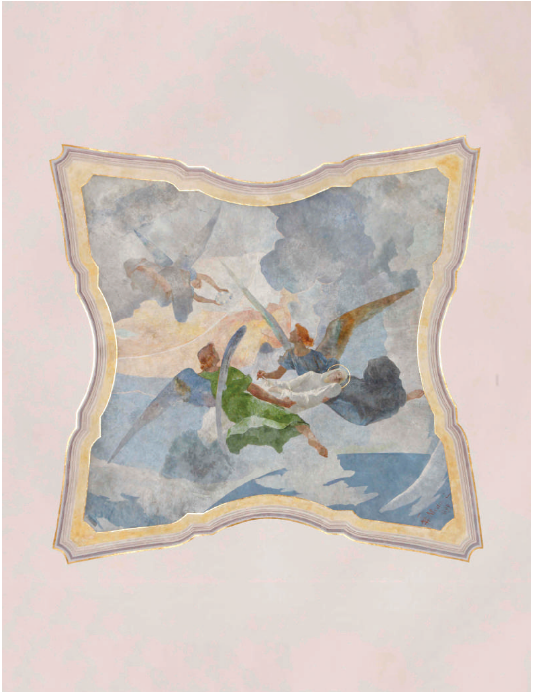
Celestin Medović, Uznesenje sv. Terezije u nebo , freska na svodu svetišta požeške Katedrale