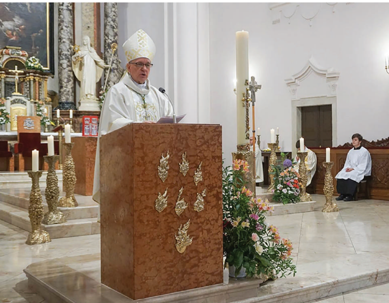
Biskup Antun naviješta otajstvo Isusove pobjede nad smrću

Jednostavnom tvrdnjom u današnjem drugom čitanju: »Sve mu podloži pod noge, a njega postavi nad svime« (Ef 1,23), sv. nas Pavao potiče, a svetkovina Uzašašća ohrabruje da se ne udaljujemo od svijeta, nego u njemu tako djelujemo te bude što očitija Isusova pobjeda nad prolaznošću i punina njegove preobrazbe koja svijetu daje smisao. Neka tako bude. Amen.