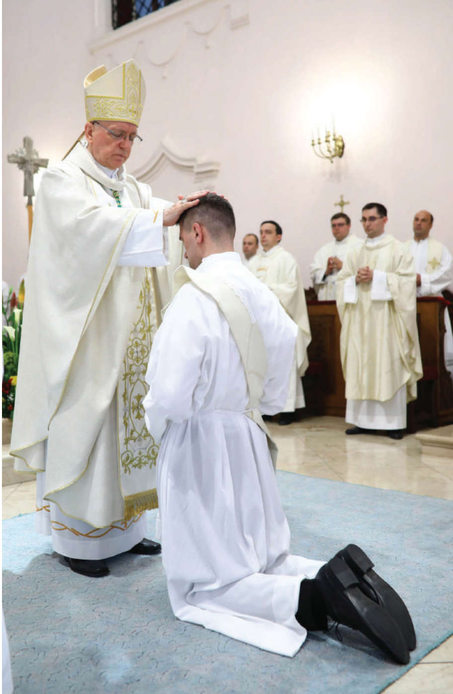
Prezbiterско ređenje u požeškoj Katedrali