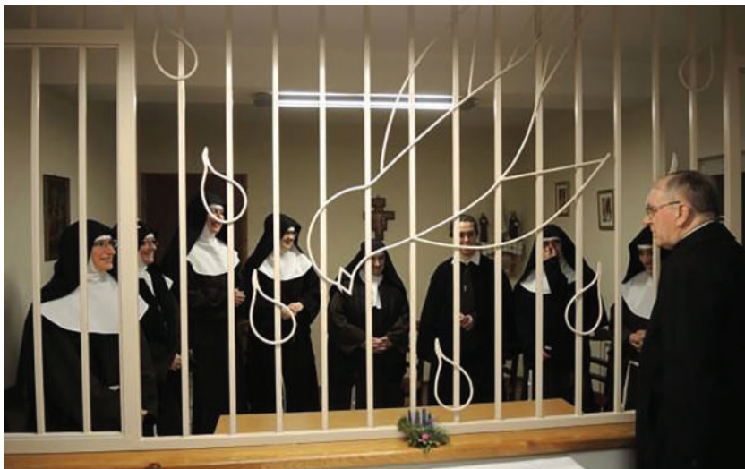
U samostanu požeških sestara klarisa

majčinskom ljubavlju. Po njezinu moćnom zagovoru i molitvi svetoga oca Franje i majke Klare ustrajale u svom daljnjem vjernu svjedočenju potpune predanosti Isusu Kristu u našoj mjesnoj Crkvi.