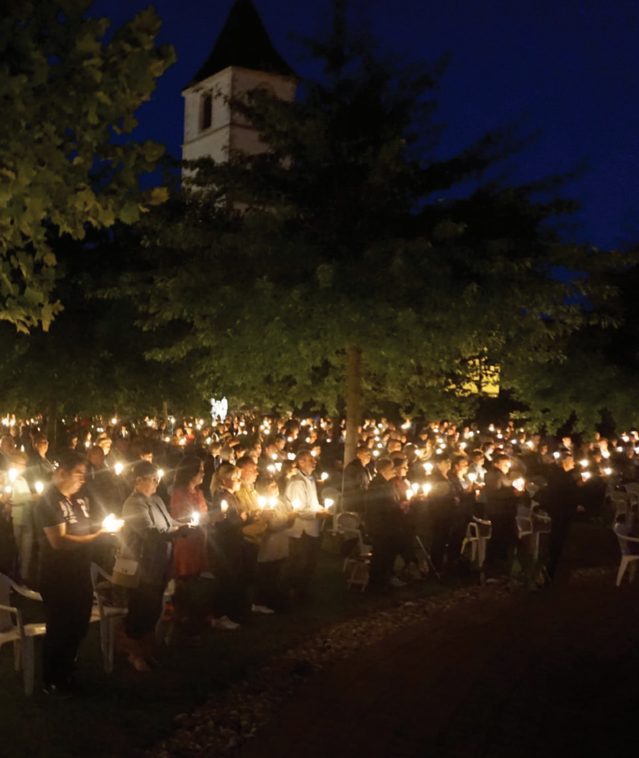
Hodočasničko slavlje svjetla u voćinskom svetištu