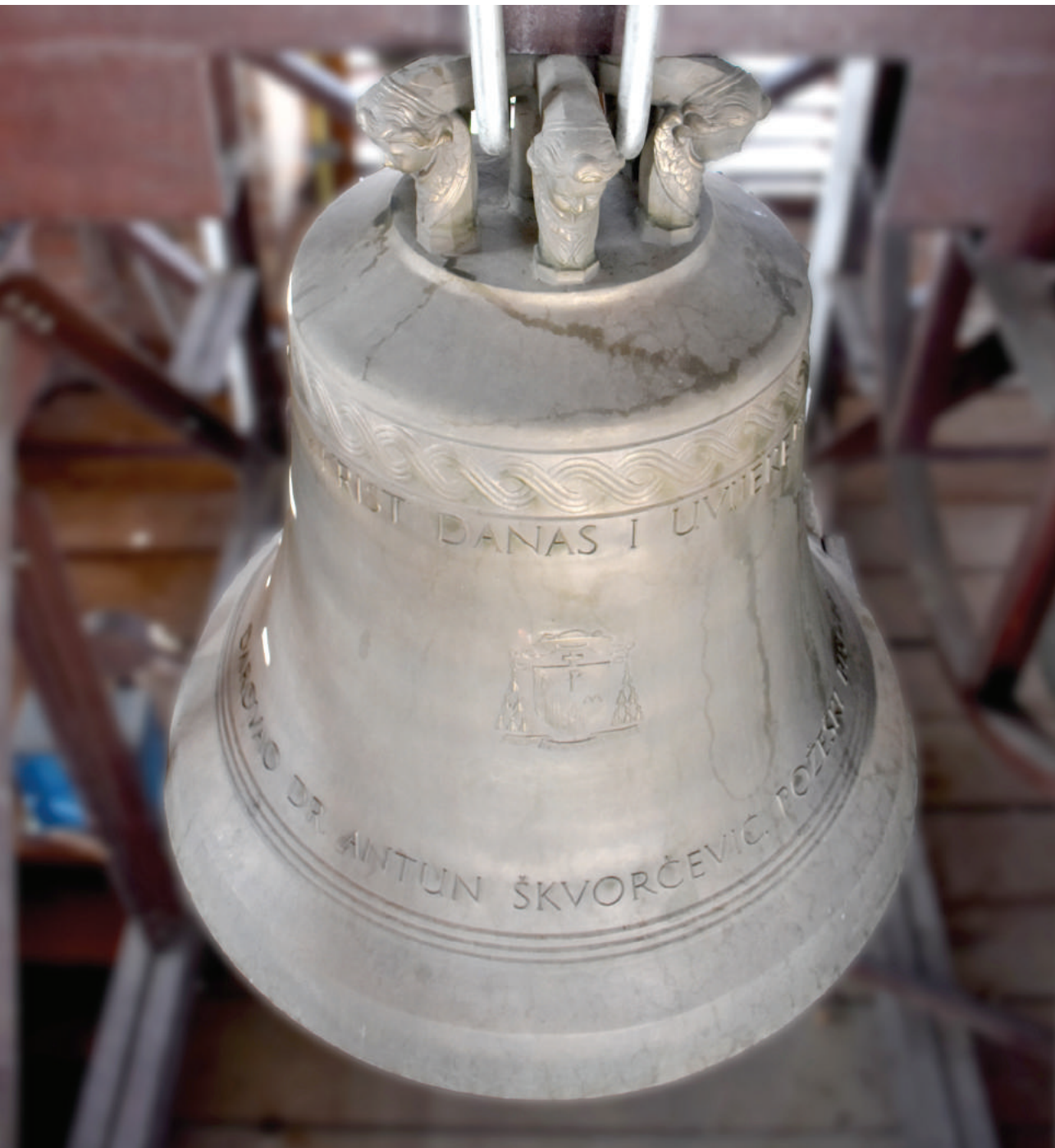
Veliko zvono požeške Katedrale