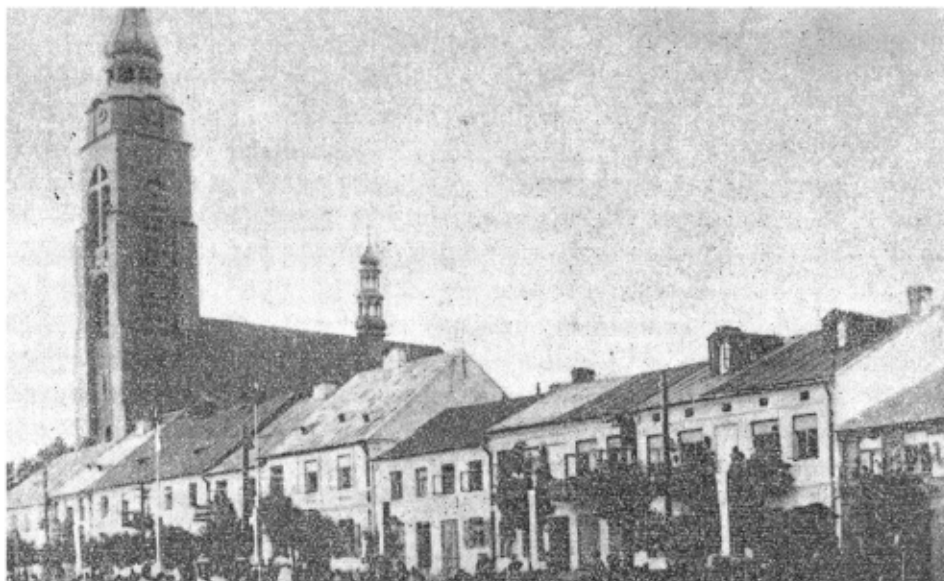
Zdj. 10. Fragment Starego Rynku w Gąbinie z widokiem na kościół. Rok 1925.