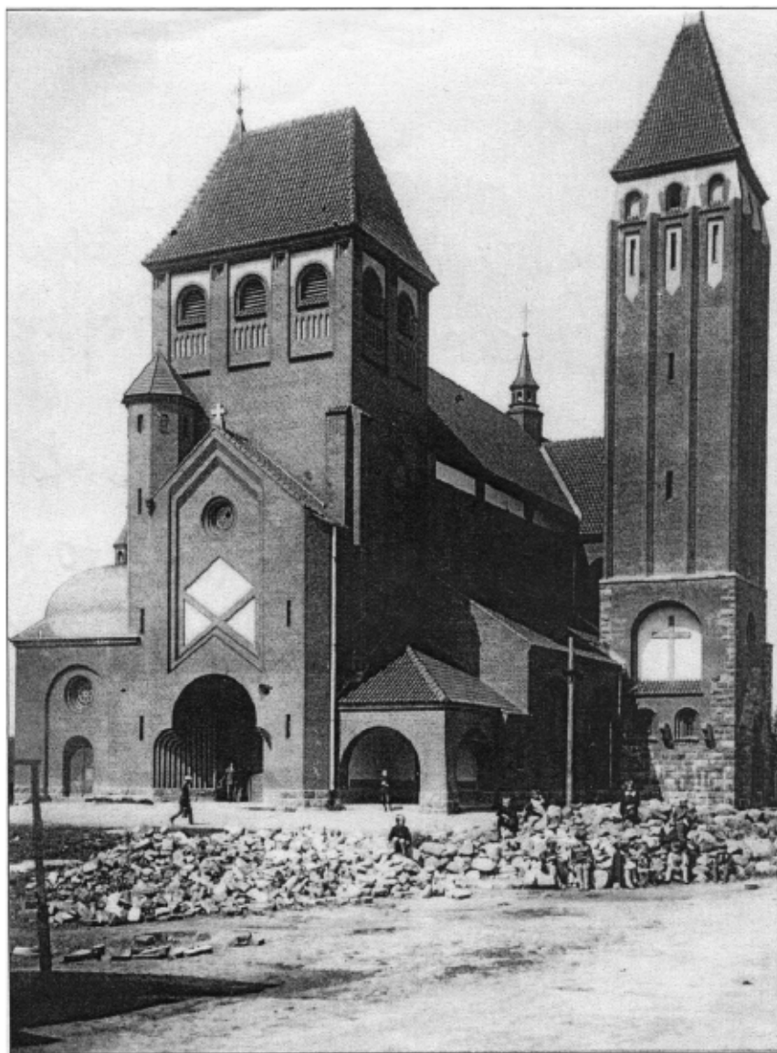
Wybudowany kościół. Około 1925 r.

Zdj. 7. Nowo wybudowany kościół św. Marcina w Gostyninie. Rok 1925.