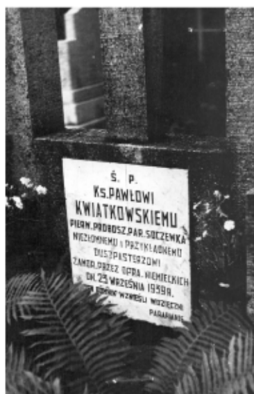
Grób ks. P. Kwiatkowskiego na cmentarzu w Soczewce. 1975