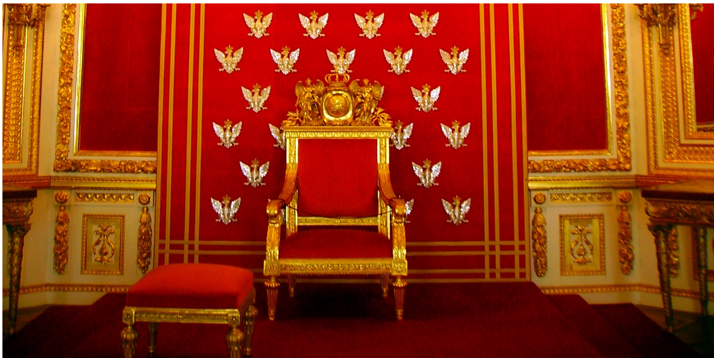
Tron Stanisława Augusta Poniatowskiego na Zamku Królewskim w Warszawie.

https://przystanekhistoria.pl/pa2/tematy/rada-regencyjna/96382,Monarchisci-II-RP.html