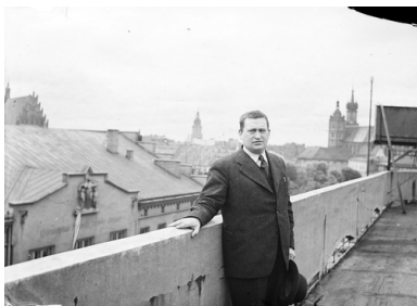
Stanisław Cat-Mackiewicz - redaktor naczelny wileńskiego „Słowa” w latach 20. XX w. Na fotografii z maja 1939 stoi na dachu Pałacu Prasy w Krakowie.