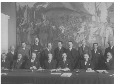
Obrady organizacji monarchistycznej - Warszawa, 19 grudnia 1926 r.