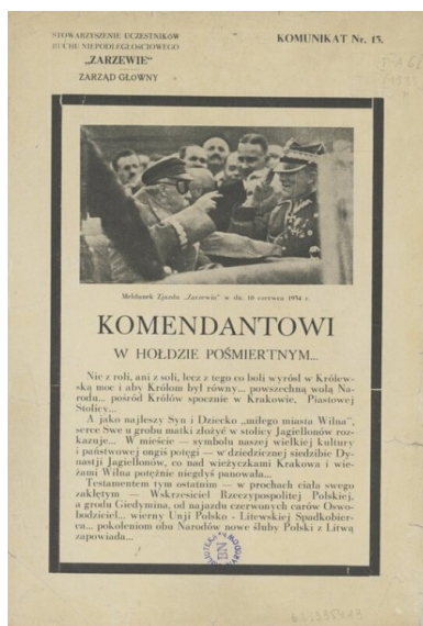
Druk Komendantowi w hołdzie pośmiertnym , rozpoczynający się od słów: „Nie z roli, ani z soli, lecz z tego co boli wyrósł w Królewską moc i aby Królom był równy... powszechną wolą Narodu... pośród Królów spocznie w Krakowie (...).”