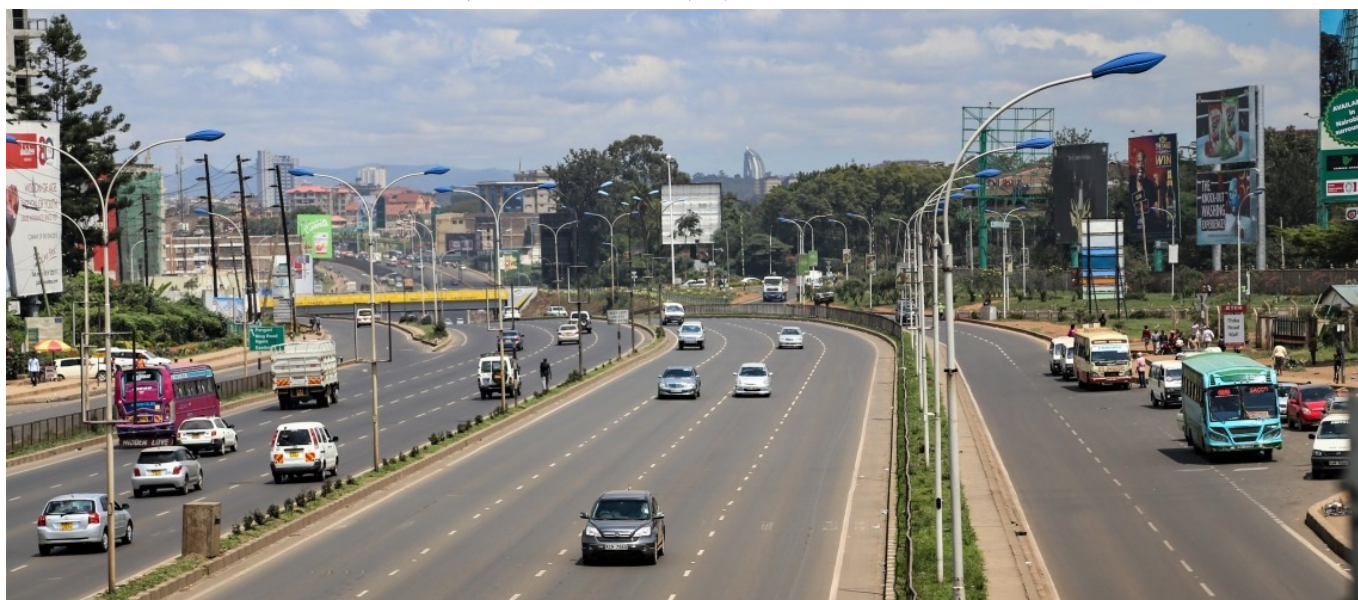
ケニアの高速