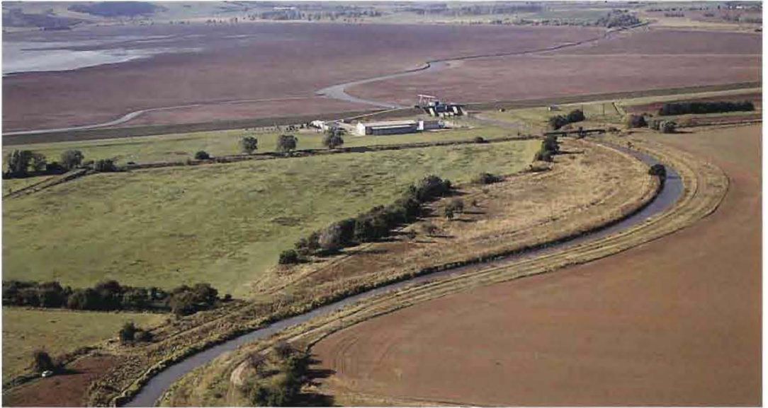
Abb. 7: Gipswerke in Rottleberode (Oktober 1992)