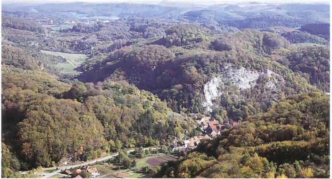
Abb. 3: Helmeaue bei Brücken (Oktober 1998)