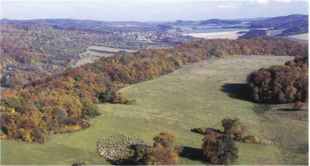
Abb. 5: Halden bei Hainrode (Oktober 1992)