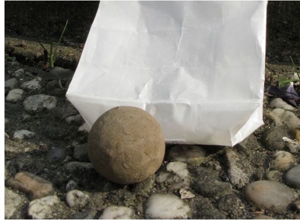
Abb. 4: Seedbomb im Rahmen des Guerilla Gardening „für eine buntere Stadt“ (Bochum, 20.05.2011,).