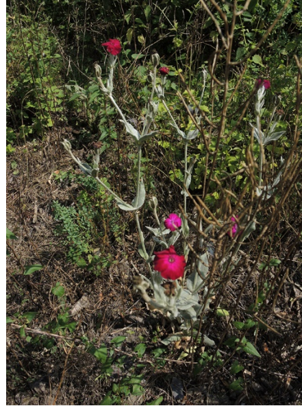
Abb. 16: Lychnis coronaria (Kronen-Lichtnelke) auf einer Brachfläche in Unna (09.07.2017,).

Ein deutliches Zeichen für gezielte, direkte Ansaaten in der Landschaft ist das Vorkommen von gleich mehreren typischen „Bientüten-Arten“ an einem Ort. In solchen Fällen kann davon ausgegangen werden, dass der Standort Opfer einer Guerilla Gardening-Aktion wurde. In vielen Fällen bleibt dies jedoch völlig unklar, z. B. wenn nur einzelne Arten bzw. Pflanzen auftreten oder diese an schlecht zugänglichen Orten wachsen.