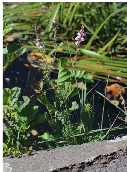
Abb. 14: Linaria purpurea (Purpur-Leinkraut) in einer Uferbefestigungsmauer der Ruhr in Mülheim/Ruhr (08.09.2018,).