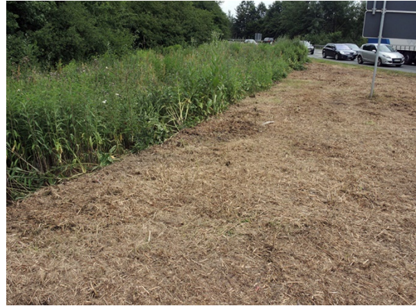
Abb. 2: Gemulchter Straßenrand in Witten-Annen/Ennepe-Ruhr-Kreis (21.07.2018,).

Allerdings spielt die aktuelle Medienpräsenz des „Insektensterbens“ dem Naturschutz in gewisser Weise auch in die Karten: Es sind dadurch grundsätzliche Sachverhalte bereits im Bewusstsein der Bevölkerung verankert und es herrscht eine hohe Bereitschaft, aktiv zu werden. Doch während es offensichtlich seitens des ehrenamtlichen und behördlichen Naturschutzes oft noch an Orientierung, einheitlichem Rat und Kommunikationsstrategien mangelt, haben Marktwirtschaft und Politik die Zeichen der Zeit rasch erkannt: In so gut wie jedem Baumarkt, Discounter, aber auch auf Werbeveranstaltungen sind mittlerweile Samentütchen für „die Bienen“ erhältlich, die sich entweder für verhältnismäßig teures Geld oder aber als Maßnahme für einen ökologischen Anstrich von Firmen und Parteien gut unter die Leute bringen lassen. Ansprechende Namen wie „Schmetterlingswiese“, „Bienenschmaus“ und „Hummelmagnet“ auf einem attraktiven Cover mit bunten Blumen halten jedoch ihr ökologisches Versprechen nur selten.