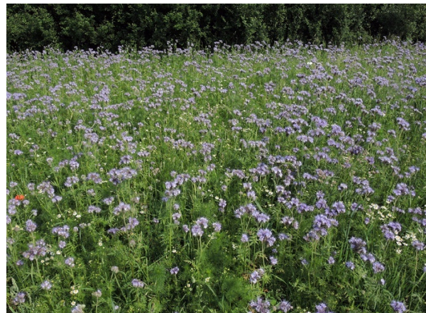
Abb. 26: Einjährige „Bienenweide“ mit Phazelle als Zwischensaat auf einem Acker (Geseke/Krs. Soest, 05.06.2016,).

Eine Saatmischung mit einjährigen Arten, die zudem noch im Hochsommer blühen, ist für die Nutzung als Mähwiese somit eine denkbar ungeeignete Wahl. Aber auch ohne Mahd wachsen einjährige Pflanzenarten, sofern sie nicht aus mitteleuropäischem Klima stammen, im nächsten Jahr kaum mehr nach. Es muss also nicht nur eine neue Tüte gekauft werden, sondern für eine erneute Einsaat auch der Boden umgebrochen werden – der Tod für alle Insekten, deren Larven in abgestorbenen Halmen oder in Bodennähe überwintern.