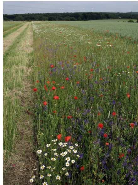
Abb. 32: Blühender Ackerrandstreifen auf Kalk mit Feld-Rittersporn in Geseke/Krs. Soest (30.06.2013,).