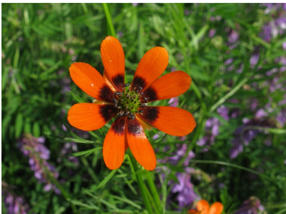
Abb. 9: Adonis aestivalis (Sommer-Adonisröschen), ein in Deutschland stark gefährdetes Ackerunkraut (Thüringen, 06.06.2010,).

Wenn die Arten nicht auf dem Tütchen aufgelistet sind, kann der Inhalt ohne Konsequenzen variieren. Aber auch auf die Aussaat von Samen aus definiertem Saatgut mit nur einer Art ist nicht unbedingt Verlass. So enthielt eine Samentüte nicht das auf dem Cover angegebene, in Deutschland seltene und stark gefährdete Ackerunkraut Sommer-Adonisröschen ( Adonis aestivalis , Abb. 9, vgl. BFN 2018), sondern das im Mittelmeergebiet heimische Herbst-Adonisröschen ( Adonis annua , Abb. 10), das in Deutschland als unbeständiger Neophyt auftritt (FLORAWEB 2018). Ähnliches passierte auch gattungsübergreifend bei Ipomoea purpurea (Purpur-Prunkwinde) und Convolvulus tricolor (Dreifarbige Winde), verkauft als Ipomoea tricolor . Beide lassen sich aber schon aufgrund der Keimblätter deutlich unterscheiden (Abb. 11 & 12).