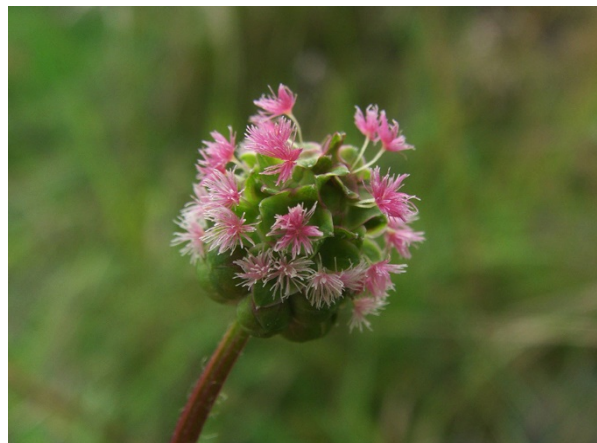
Abb. 22: Sanguisorba muricata subsp. balearica (Höckerfrüchtiger Wiesenknopf) aus einer Ansaat in Bochum-Weitmar (07.03.2005,).