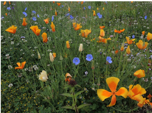
Abb. 25: „Einjährige Wiese“ aus der Samentüte mit verschiedenfarbigem Kalifornischem Kappenmohn, Bart-Nelke und Lein (Bielefeld, 05.06.2016,).