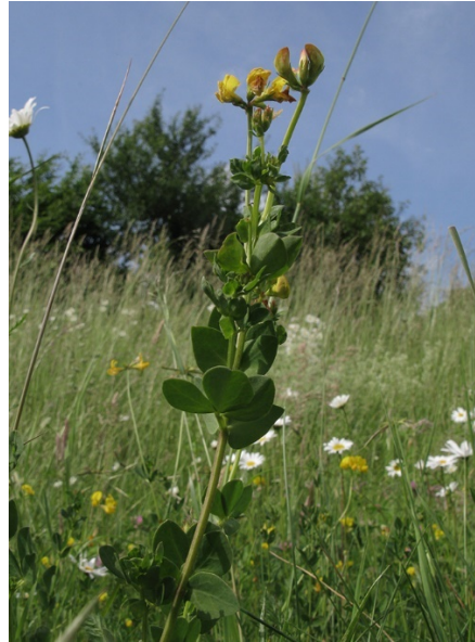
Abb. 20: Lotus sativus (Saat-Hornklee) an einer Böschung bei Augustdorf/Kreis Lippe (15.06.2013).