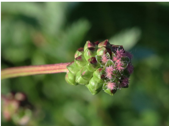
Abb. 21: Sanguisorba minor subsp. minor (Kleiner Wiesenknopf) in einer Obstwiese in Bochum (20.04.2019,).