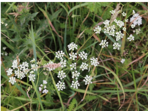
Abb. 23: Die heimische Kleine Bibernelle ( Pimpinella saxifraga) in der Pöppelsche im Kreis Soest (29.07.2018,).