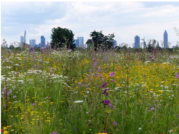
Abb. 17: Angesäte „Wildwiese“ in Frankfurt/Main (26.06.2016,).