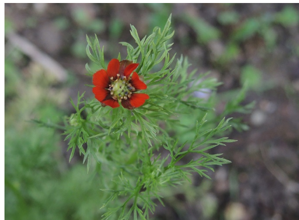
Abb. 10: Adonis annua (Herbst-Adonisröschen) aus einer Samentüte mit der Aufschrift „Adonisröschen, Blutströpfchen ( Adonis aestivalis)“ (04.08.2018,).