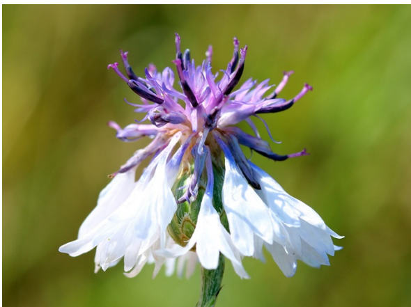
Abb. 5: Centaurea cyanus (Kornblume) mit weißen Randblüten (Mülheim/Ruhr, 18.08.2018,).