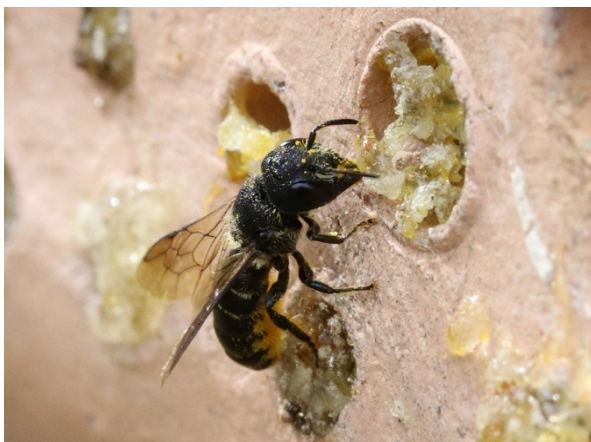
Abb. 29: Die Gewöhnliche Löcherbiene ( Osmia trunctorum) an einer Insekten-Nisthilfe (Bochum, 30.07.2018,).

Der durch die deutlich angestiegene Nachfrage ausgelöste, allgegenwärtige Verkauf von Wildbienen-Nisthilfen (Abb. 29), sog. „Bienenhotels“, in Discountern und Baumärkten, die häufig mit ungeeigneten Füllmaterialien produziert wurden, ist neben dem Verkauf von Samentütchen ein weiteres Beispiel für die Kommerzialisierung des Themas. Sie können zwar im Sinne von Umweltbildung zielführend sein, sind aber für Wildbienen nur dann geeignet, wenn sie fachgerecht hergestellt wurden.