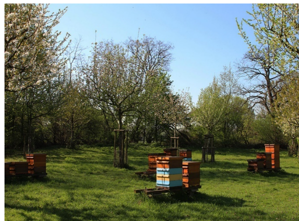
Abb. 30: Bienenstöcke auf einer Obstwiese im blütenarmen Grünland (Duisburg, 18.04.2018,).