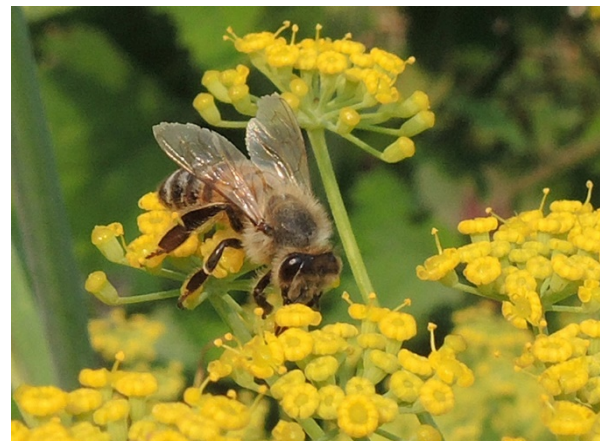
Abb. 28: Apis mellifera (Honigbiene) an Fenchel ( Foeniculum vulgare) in einem Schrebergarten in Bochum (21.07.2018,).