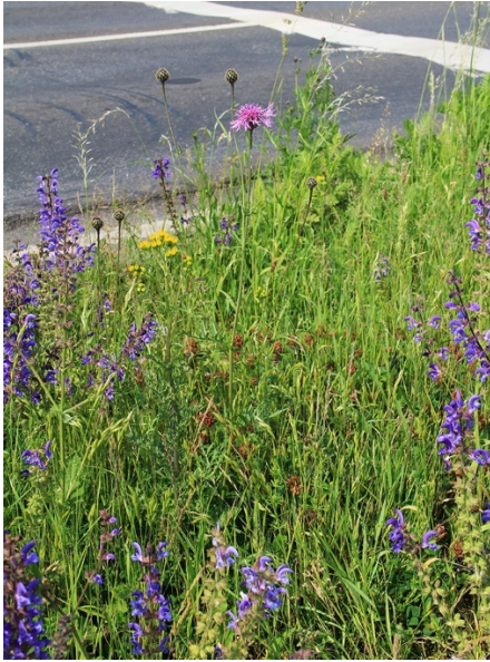
Abb. 1: Bunt blühender Straßenrand in Duisburg (28.05.2016,).