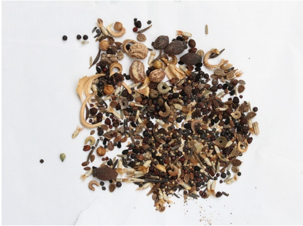
Abb. 3: Inhalt einer Samenmischung für eine Schmetterlingswiese aus einem Baumarkt (Mülheim, 28.04.2018,).