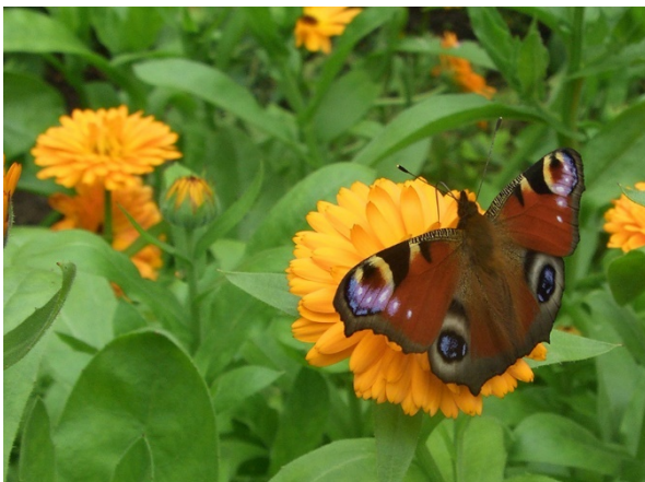
Abb. 27: Calendula officinalis (Garten-Ringelblume) mit Tagpfauenauge ( Aglais io) in einem Vorgarten in Bochum (25.07.2008,).

Dies kann kaum pauschal beantwortet werden, da gerade faunistische Gefüge sehr komplex sind. Festzustellen ist allerdings, dass gerade in den wenigen Wochen des Hauptblühaspekts zwar viele Insekten an den Blüten solcher Aussaaten zu finden sind, es sich jedoch in der Regel um häufige Arten ohne besondere Ansprüche handelt wie z. B. Tagpfauenauge (Abb. 27), Kleiner Kohlweißling und die allgegenwärtige Honigbiene (Abb. 28). Hier wäre also lediglich ein positiver Effekt auf die absolute Biomasse an Insekten nachvollziehbar. Betrachtet man jedoch die Arten der Roten Listen, wird klar, dass es sich bei den stark gefährdeten und vom Aussterben bedrohten Insektenarten mehrheitlich um auf bestimmte heimische Pflanzenarten stark spezialisierte Arten handelt, die auf intakte Artengemeinschaften, natürliche Lebensräume und traditionelle Bewirtschaftung angewiesen sind.