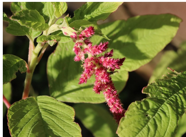
Abb. 6: Amaranthus caudatus (Garten-Fuchsschwanz) (Bochum, 30.07.2018,).