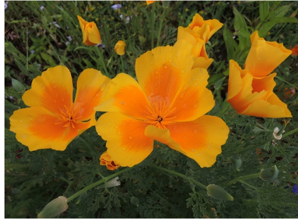
Abb. 8: Eschscholzia californica (Kalifornischer Kappensmohn) (Bielefeld, 29.05.2016,).

Vermutlich wurden vor allem Arten ausgewählt, die sich effektiv vermehren und deren Samen sich entsprechend kostengünstig herstellen lassen. Möglicherweise stammt ein nicht unerheblicher Teil in den Samenmischungen sogar aus Überschüssen sonstiger Produktionen, die sich in den undefinierten Mischungen noch gut vermarkten lassen.