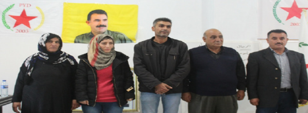
الأيدي أمام هذه الهجمات.

منوهاً أن كلاً من «أمريكا وفرنسا» قاموا بإصدار التهديدات وبخافطون ع مناطقهم وأرضهم. متابعاً الدولة التركية تود اليوم أن تهجم مناطقا، مشيراً إلى أن تركيا تسعى من خلال هذه الهجمات إبعاد الأنظار عن عفرين، ولكن مخطئة بهذا التفكير لأن عفرين من أولويتنا وهدفنا الأساسي، إضافة إلى ذلك هدف تركيا إبالة عمر داعش، و لا تود الحزب عليه القيام بواجبه تجاه شعبه وقضيته وأن يحافظ على مكتسبات هذا الأرض