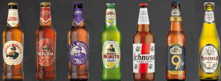
Moretti Moretti Rossa Moretti Ipa Moretti Radler Ichnusa Poretto Ipa Menabrea