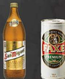
San Miguel Faxe Premium