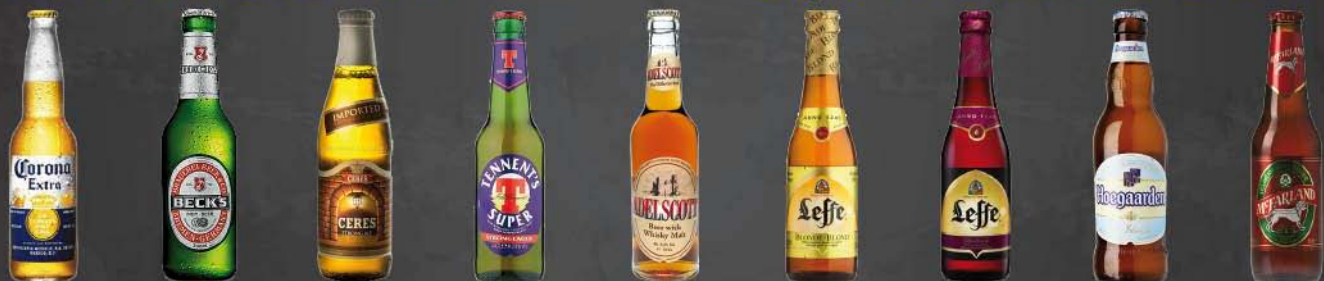
Corona Beck's Ceres Tennent's Adelscott Lefte Blonde Lefte Radiuse Hoegaarden Blanche Mc Farland Rossa