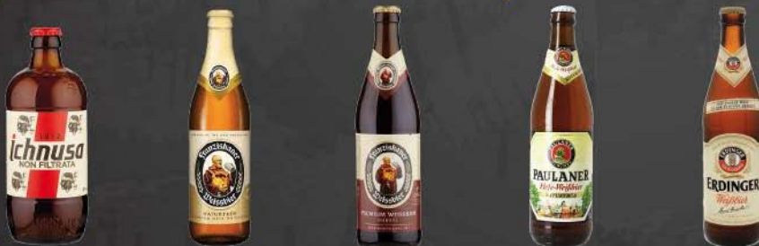
Ichnusa non filtrata Franziskaner Weissbier Franziskaner Dunkel Paulaner Hefe-Weissbier Erdinger Weissbier