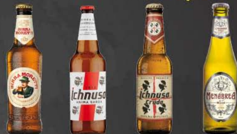
Moretti Ichnusa Ichnusa Cruda Menabrea