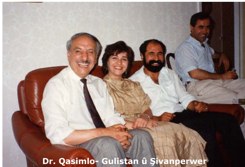
Dr. Qasimlo- Gulistan û Şivanperwer