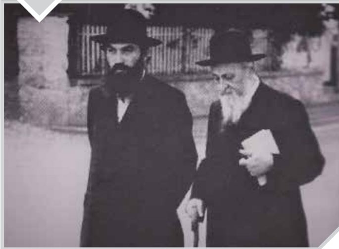
הגרי"ז מבריסק זצ"ל עם תלמידו האדמו"ר מסטריקוב זצ"ל

"אֲנִי אֶעֱרְבֶנּוּ מִיְדֵי תְּבַקְּשָׁנוּ" (בראשית מ"ג, ט')