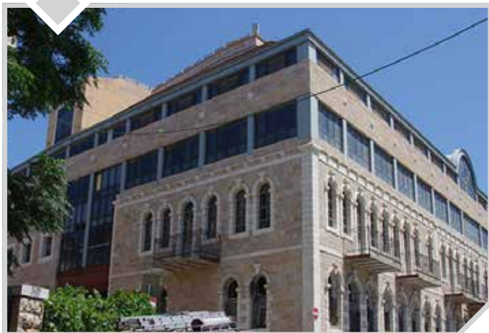
בניין ישיבת אור החיים

בשבוע שעבר, יצא לי לבקר בישיבת 'אור החיים' בירושלים, כדי להאזין לשיחה מיוחדת של אחד מראשי ארגון 'אחינו', שהתבקש לשאת דברים בפני תלמידי הישיבה. אני מכיר את האיש, ויודע שכשהוא מדבר, יש משהו שמוע... אז החלטתי לשבת בבית המדרש, בתוך קפסולה עטופת ניילון כמובן, ולשמוע את דבריו היוצאים מן הלב. הוא סיפר להם שני סיפורים שלכאורה הם הפוכים זה מזה, אבל לאחר מחשבה קלה מתברר שמדובר בשני צדדים של אותו המטבע. וכה היו דבריו: