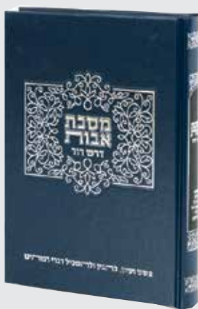
דרש דוד אבות 33 ש"ח בלבד!