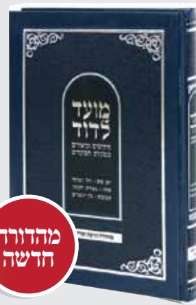
מועד לדוד 33 ש"ח בלבד!