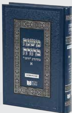
משנה ברורה א' 33 ש"ח בלבד!