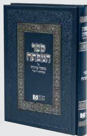
ספר המפתח על המ"ב 33 ש"ח בלבד!