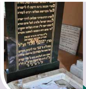
מצבת רבי הראשון מקוסוב, בעל ה'בני שלשים'

נפטר בכ"ג בחשוון תרע"ב ומנוחתו כבוד בבית העלמין בקוסוב.