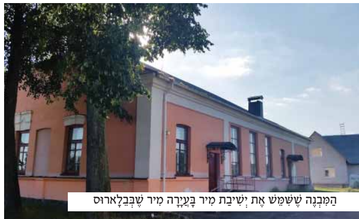
המבנה ששמש את ישיבת מיר בעירה מיר שבבלארוס

הבחור קרא את המכתב שוב ושוב. הדברים שנכתבו בו דברו בעד עצמם, והוא הבין כי לא דבר ריק הוא שמפל תושבי מיר, יהודים כגויים, מן השמים זמנו את המכתב דוקא לידיו, והוא החליט להועץ בענין עם מורו ורבו.