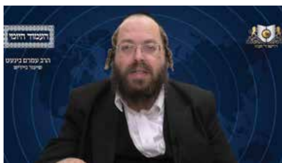
הרב עמרם בינעט שליט"א - אידיש