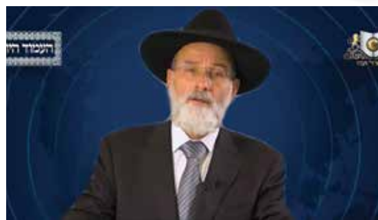
הרב דוד הופשטטר שליט"א - אנגלית