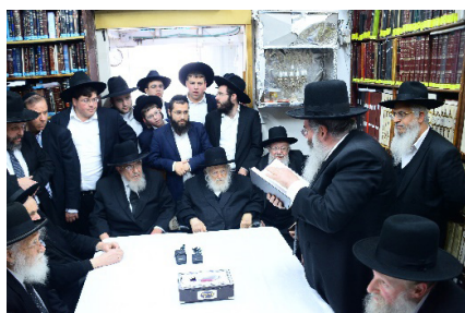
כינוס בבית רבינו ובראשות לטובת ישיבת 'עטרת ישראל', כשלצידו הגר"ב מ'אזורתי זכר צדיקים לברכה

הגיב על כך רבינו: 'בעתה' הכוונה ליום השמיני. 'בזמנה' הכוונה ביום ולא בלילה.