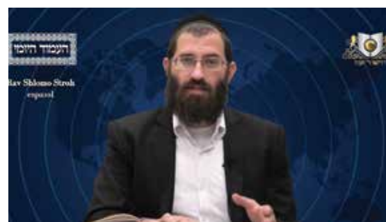
הרב שלמה סטרו שליט"א - ספרדית