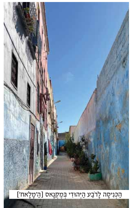
הכניסה לרבע היהודי במקנאס [המלאח]