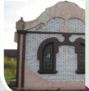
האהל על ציינו של המגיד ממזריטש