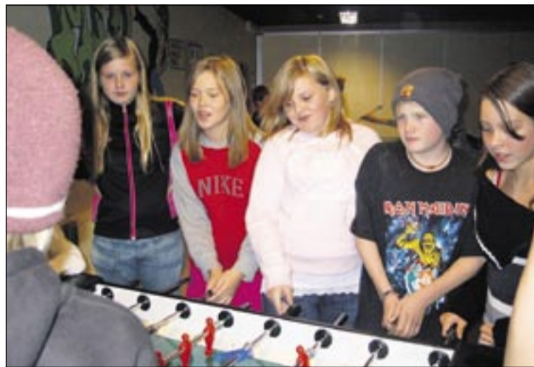
Öflugt starf fer fram í félagsmiðstöðvum í Breiðholti. Þessi mynd er tekin í Árseli.

Í haust hafði hverfislögreglan virkt eftirlit með því að börn og unglingar virtu reglur um útivist-