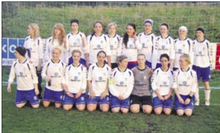
Meistaraflokkur ÍR í kvinnaknattspyrnu 2006.

ÍR-ingar hafa ekki enn, þegar þetta er skrifað, fengið að fagna almennilega nýfengnu sæti sínu í úrvalsdeild kvenna vegna kærur andstæðinganna og málaferla í kjölfarið. Eftir erfiða útsláttarkeppni þar sem ÍR-stelpurnar þurftu að takast á við öfluga andstæðinga tók við þrautaganga fyrir dómstólum KSÍ, fyrst í undirrétti og síðan í yfirrétti. Og nú er beðið átekta eftir því hvort ÍSí taki málið fyrir. Síðan er það spurning hvort mótherjarnir færu með þetta fyrir einhvern alþjóðadómstól ef þeir hefðu tækifæri til þess.