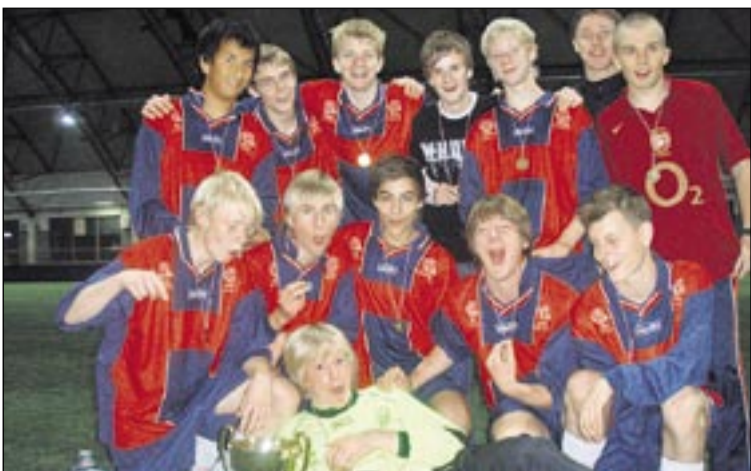
Breiðholtsskóli varð í síðasta mánuði sigurvegari í grunnskólamóti Knattspyrnuráðs Reykjavíkur.

sögðu var pöntuð pítsa því allir þurftu að fá næringu í kroppinn.