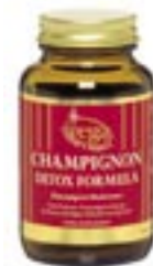
Champignon DETOX + FOS og Spirulina