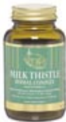
Vega Milk Thistle Lættir undir hreinsunarferli líkamans

Með hverjum keyptum Champignon DETOX FORMULA fylgir Milk Thistle frítt með