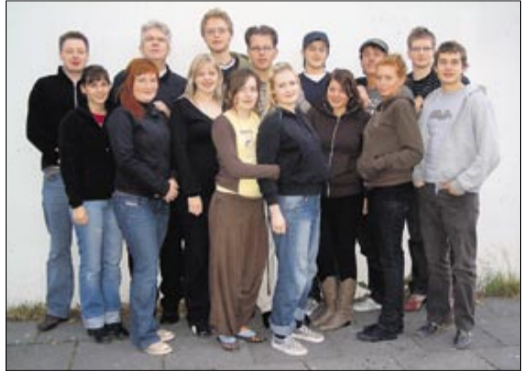
Þarna er fjölmiðlahópurinn ásamt kennurunum samankomin af aflokinni Grindavíkurferð.

Eftir að nemendurnir komu til baka í bæinn fóru þeir beint í skól-