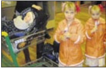
Heilu fjölskyldurnar mættu saman. Þessar tvær voru ánægðar með ísinn sinn.

er litirnir að þessu sinni. Svolítið sérstakt en margir venjast því vel.” Kósí konukvöldið var unnið í samstarfi við marga aðila sem komu og kynntu vörur sínar og að sögn Jónínu var reynt að binda valið við árstíðina og þá viðburði sem framundan eru. Breiðholtsblaðið var á staðnum og myndirnar segja e.t.v. fleira en orðin.