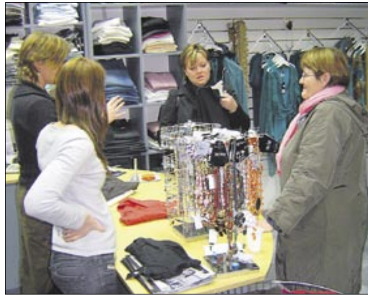
Tilbúnað að versla.