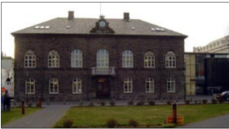
Spurningar eru um eftir hverju kjósendur muni fara þegar þeir velja menn til þess að starfa í þessu húsi næstu fjögur árin.

Framsóknarflokkurinn virðist eiga í umtalsverðri kreppu. Um hann gildir að einhverju leyti hið sama og um aðra hefðbundna bænda- og landsbyggðaflokka í Evrópu sem hafa átt í erfiðleikum með að finna sér farvegi í breyttu þjóðfélagi. Um miðjan síðasta ára-