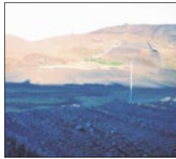
Framtíðarskíðavæði ÍR í Bláfjöllum. Vonandi verur svæðið í ljósari lit þegar kemur fram á veturinn.

Skíðadeild ÍR flytur nú í haust í Bláfjöllin en skíðadeildin hefur haft aðstöðu á Hengilssvæðinu undanfarna áratugi. Samningur milli skíðadeildarinnar og Reykjavíkurborgar var undirritaður á dögnum og á næsta ári fær deildin afhentan nýjan skála á Suðursvæðinu í Bláfjöllum. Í vetur mun deildin vera með aðstöðu á fyrirhuguðum byggingarreit en bygging skálans hefst væntanlega í loka skíðatímabili. Flutningurinn hefur mikil áhrif á æfingaraðstöðu deildarinnar sem verður nú fjölbreyttari en áður. Þá verður aðgengi foreldra og iðkanda að fjölbreyttum skíðaleiðum betra en áður. Skíðadeild ÍR hlakkar til að sjá Breiðholtsbúa á skíðum í