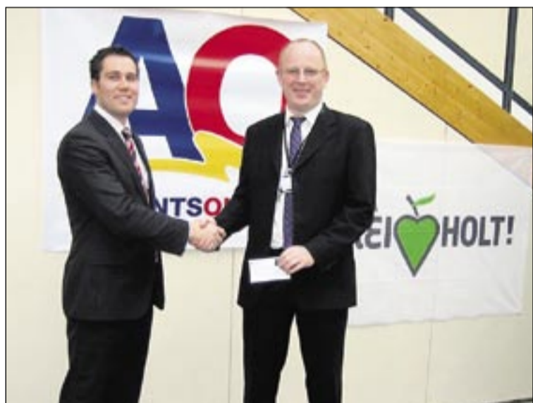
Styrkur Atlandsolíu og Breiðholtsbúa til umsjónarfélags einhverfra athentur.