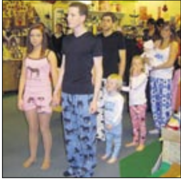
Náttföt fyrir börn og fullorðina voru sýnd á tískusýningu. Yngsti sýningarmeðlimurinn var aðeins um eins árs og sat á mömmuhandlegg.