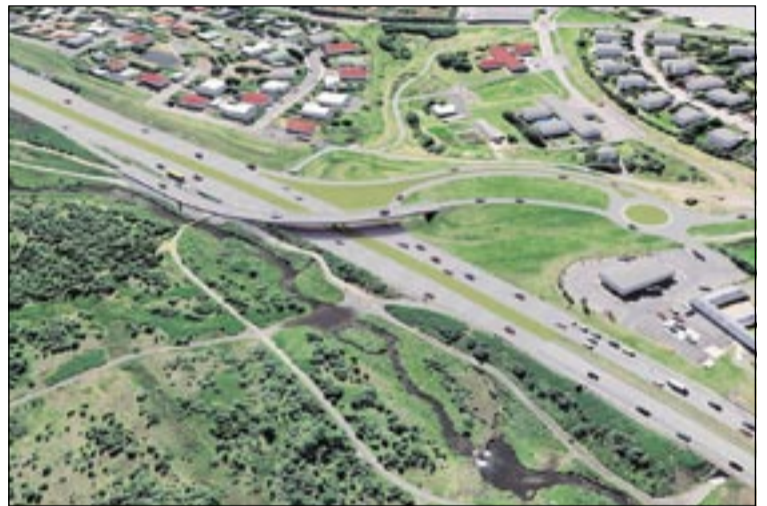
Bústaðahugmynd 1 og Bústaðahugmynd 2. Sem sjá má gerir önnur hugmyndin ráð fyrir undirgöngum undir Reykjanesbraut en hin fyrir brú yfir brautina. Hvorug hugmyndin þykir ásættanleg að mati borgarráðs.

valda óæskilegu raski á nánasta umhverfi. Greið umferð um gatnamót Reykjanesbrautar og Bústaðavegar er mikilsvert atriði fyrir