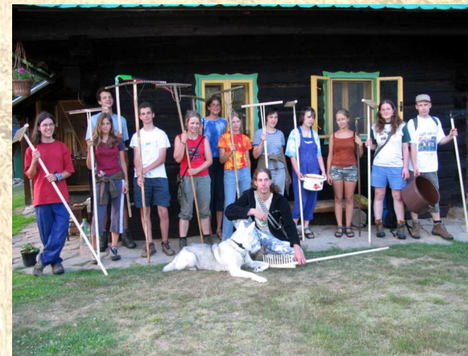
Bez práce dobrovolníků by se Kudlačena neobešla.

Chceme-li zachovat pestrost beskydských luk, je třeba pravidelná péče, neboť louka jako taková je přímo závislá na člověku, který ji kosí a seno suší a odváží z louky. Kosení bez transportu travní biomasy mimo louku je velmi nevhodné a vede k degradaci louky možná ještě rychleji než ponechání ladem. Na mokřích loukách nedostupných pro traktory či jinou techniku je nutno kosit ručně a nejlépe kosení doplňovat o pastvu ovcí či koz.