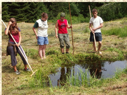
Tůňky jsou domovem např. kuňky žlutobřiché či mloka skvrnitého.

V roce 1994 bylo zřízeno několik tůňek, kde se nyní daří několika vzácným živočichům. Celkově však louka trpěla nepravidelným kosením a až do roku 2006 probíhalo mohutné zarůstání spojené s úbytkem druhů a celkovou degradací. Na jaře roku 2006 se o Kudlačenu začíná starat Hnutí Brontosaurus. V letech 2006 a 2007 proběhlo celkem 7 brigád, kdy dobrovolníci odstraňovali náletové dřeviny. Vše dovršilo kosení celé přírodní památky Kudlačena účastníky akce Beskydské řemeslné senobraní .