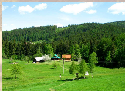
Pohled na část PP Kudlačena.

Projíždíte-li horskou obcí Horní Bečva, spatříte zdánlivě mnoho. Co však od cesty neuvidíte jsou osamělé osady na loukách nad údolím. Každá má své jméno, někdy i zvoničku, ale hlavně několik dřevěných chalup na louce obklopené lesem. V okolí chalup dodnes najdeme nemálo velmi vzácných luk. Těchto míst s prameništi či