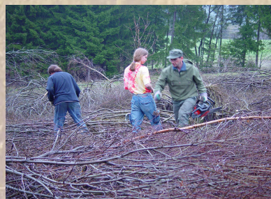
Kudlačena na první brigádě v dubnu 2006.

Tradiční malohospodářská péče o Kudlačenu skončila v roce 1974, kdy se na sušších místech začíná s intenzivní pastvou a hospodařením JZD. Když však jalovice na Kudlačeni zapadaly tak, že je museli z močálů vytahovat traktorem, bylo jasné, že zde intenzivní zemědělství neuspěje. I přesto byly některé části louky silně poničeny a jiné začaly trvale zarůstat náletem.