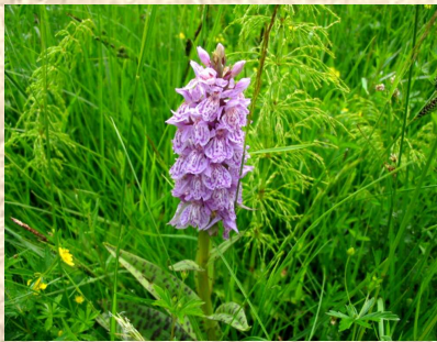
Na Kudlačeni se hojně vyskytují i ohrožené druhy rostlin, např. prstavec Fuchsův, prstavec májový, mečík střechovitý, kruštík bahenní či vachta trojlístá.

území o rozloze téměř 5,5 ha bylo v roce 1989 vyhlášeno přírodní památkou. Není divu, vždyť už v roce 1977 píše botanik prof. J. Duda v knize Rašelinné louky Kudlačena, že