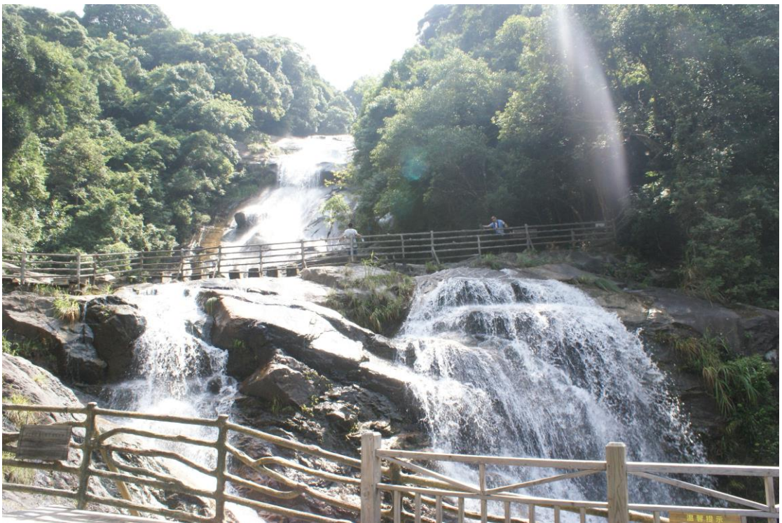
◎梁野山景區之通天瀑