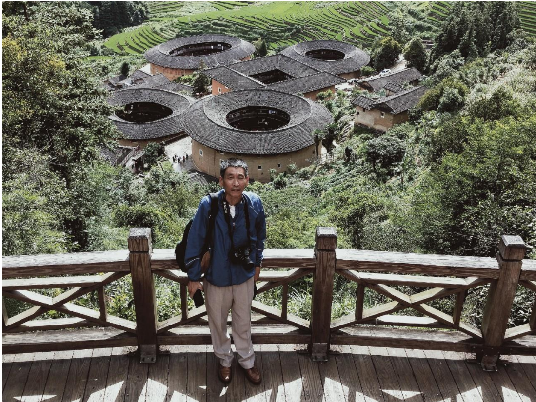
◎南靖田螺坑土樓群

樓最大的特點是柱子東倒西歪，最大的傾斜度為 15 度，看起來搖搖欲墜，但經受七百年風雨侵蝕和無數次地震的考驗，至今依然如故，有驚無險，成為古民居建築的活標本。結束上開行程後入住永定客都溫泉酒店休息。