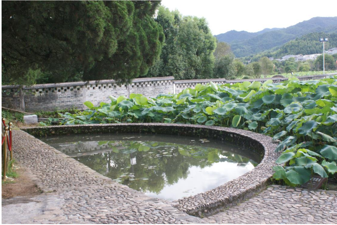
◎廖氏宗祠之半月池及蓮池