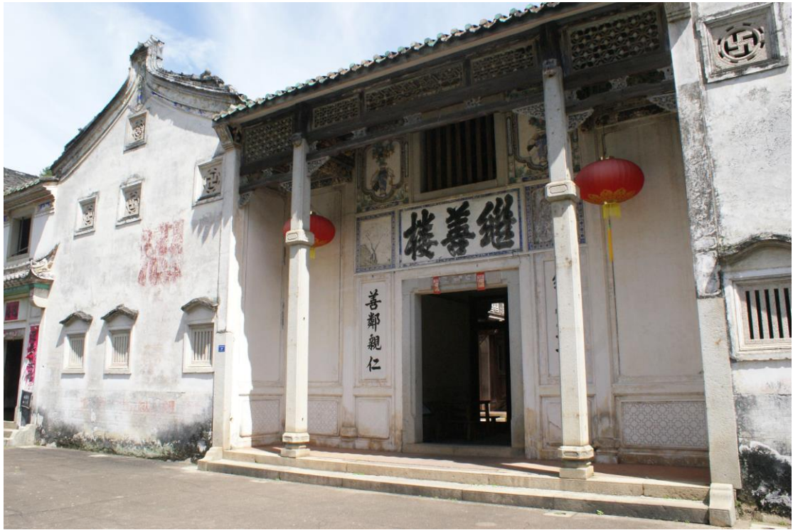
◎橋溪古韻之繼善樓