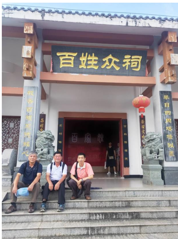
◎參觀中山鎮百姓眾祠