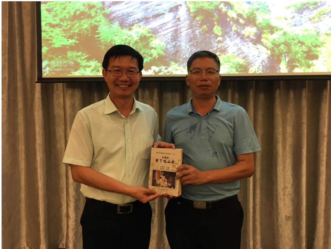
◎與閩西客家聯誼會交流