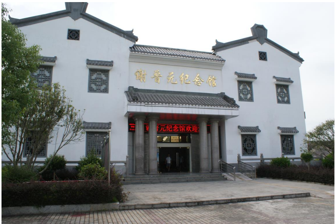
◎謝晉元將軍紀念館