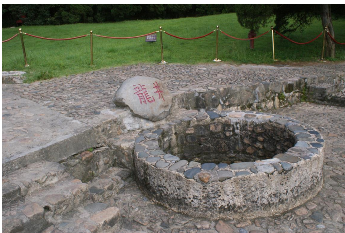
◎廖氏宗祠及其旁之龍井