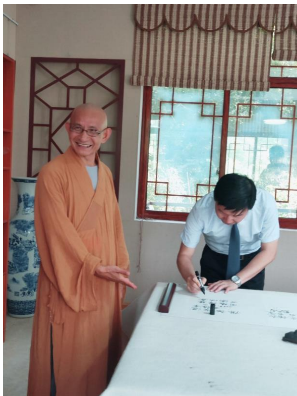
◎江主委應定光古佛廟住持之邀題名留念