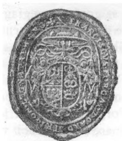
Forgách érseki pecsétje.

„Atyja a hős Forgách Simon volt, ki számos sebet kapott s osztott a csatatereken. Fiában is katonavér volt. Csakhogy fia nem a csaták babéraitra vágott. A katolicizmus iskoláiban s fővárosában az ellenreformáció eszméinek hatása alatt nevelkedett s e nagy mozgalom bajnokává lett.“ 2)