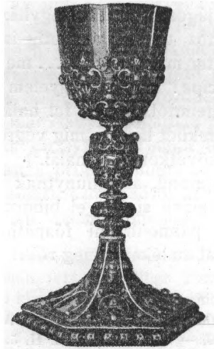
Forgách nyitrai kelyhe.

Az elhunyt szellemi alkotásai túléltek őt és Pázmány lelkén át megfinomulva vitték elő a kath. egyház törekvéseit. Bizonyos, hogy a magyar kath. egyház Pázmányon kívül neki köszönhet legtöbbet a nehéz években lezajlott küzdelmeiben.