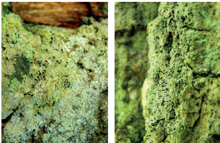
1. ábra. Chaenotheca ferruginea telepek idős csertölgy kéregpedésében Fig. 1. Chaenotheca ferruginea thalli on bark of old turkey oak tree

A szennyezésre adott reakciójuk kiértékelésén túl a konzervációs jellegű térképezések közé tartoznak az ökológiai folytonosság és az erdőfolytonosság indikátorfajait vizsgáló felmérések. Mint korai figyelmeztető szervezetek, eltűnésükkel és megjelenésükkel jelzik a magasabb rendű élőlények számára is fontos környezeti változásokat. Nemzetközileg fontossá vált bizonyos indikátorfajok kijelölése, melyek könnyebben megfigyelhetők, jelenlétükkel pedig egyértelműen alátámasztható egy-egy terület természetessége (NOSS 1990, LINDENMAYER et al. 2000). Külföldön régóta használnak ritka előfordulású zuzmófajokat az erdők egészségi állapotának, stabilitásának és diverzitásának indikátoraiként. Általánosan elfogadott, hogy az érett és idős erdők értékessége különösen fontos a