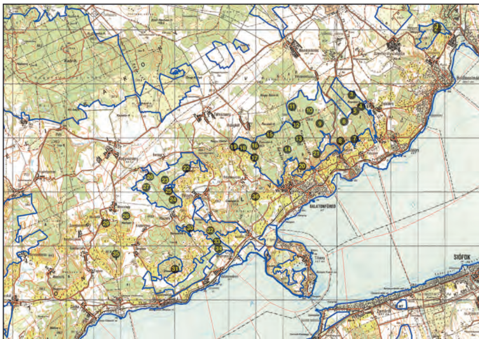
2. ábra. A vizsgált terület térképe a mintavételi pontokkal