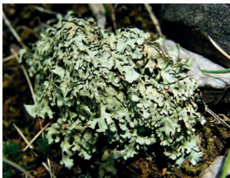
10. ábra. Magyar bodrány ( Xanthoparmelia pulvinaris )