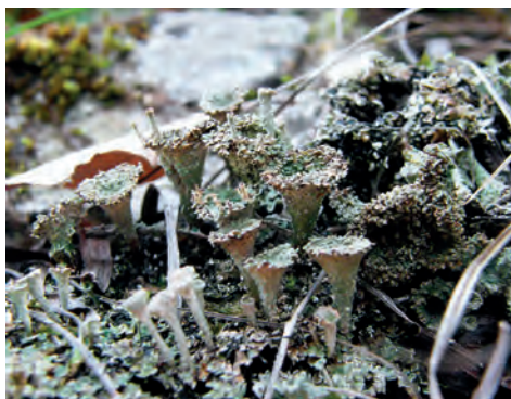
7. ábra. Magyar tölcsérzuzmó ( Cladonia magyarica )