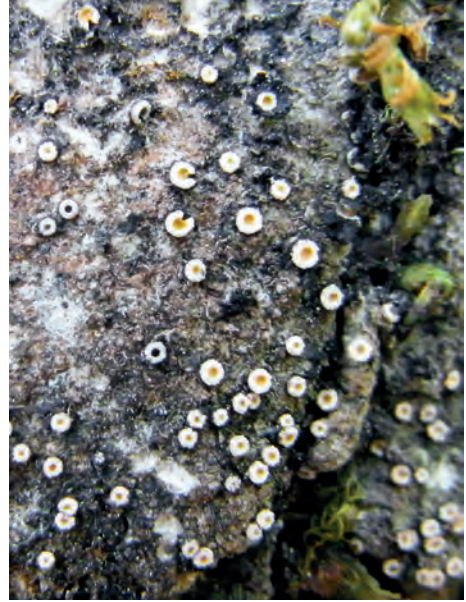
5. ábra. Urnazuzmó ( Gyalecta jenensis ) vörös listás (sebezhető) zuzmófaj Fig. 5. Gyalecta jenensis , a red-listed (vulnerable) lichen species

A védett fajok ( Cetraria aculeata , Cladonia magyarica , Solorina saccata , Xanthoparmelia pokornyi , X. pulvinaris ) jelenlegi előfordulási pontjai korábban nem voltak ismertek a Balaton-felvidékről. Továbbá számos ritka, vörös listás faj előfordulásáról nyertünk tudomást (pl. Anaptychia ciliaris , Cetrelia olivetorum , Chaenotheca chrysocephala , C. ferruginea , C. furfuracea , C. phaeocephala , C. stemonea , C. trichialis , Gyalecta jenensis ) (4. és 5. ábra).