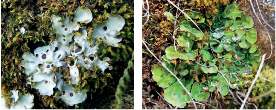
8. ábra. Pettyezetett tárcsalapony ( Solorina saccata ) telepe száraz (balra) és nedves (jobbra) állapotban

Meszes alapközetű, árnyas, nyirkos sziklafalakon szórványosan fordul elő a Dunántúli-középhegységben és a Bükkben (VERSEGHY 1994).