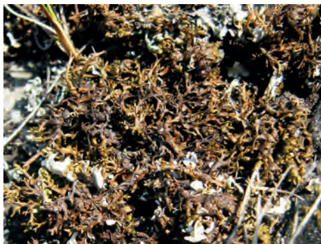
9. ábra. Pokorny-bodrány ( Xanthoparmelia pokornyi )

Magyarországról leírt faj és elterjedésének súlypontja is nálunk található. Hazai élőhelyein közepesen gyakorinak mondható. Előfordulása a Duna–Tisza között, a Gödöllői-domb-ság, a Velencei-hegység, a Bakony, a Balaton-felvidék és a Bükk területéről ismert (MOLNÁR et al. 2012).