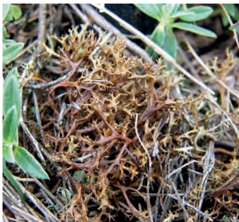
6. ábra. Tüskés vértvecs ( Cetraria aculeata )

A vizsgálati területek közül a herbárium példányokat átnézve, egyedül a balatonfüredi Tamás-hegyről, Verseghy Klára korábbi gyűjtéséből ismert a faj. A jelenlegi terepbejárás során a Tamás-hegyről begyűjtött Cladonia példányok a HPTLC-vizsgálat alapján Cladonia pyxidata/pocillum -nak bizonyultak.