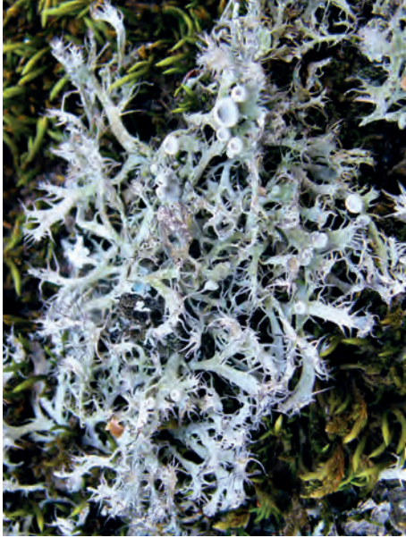
4. ábra. Szürke pillászuzmó ( Anaptychia ciliaris ) vörös listás (sebezhető) zuzmófaj Fig. 4. Anaptychia ciliaris , a red-listed (vulnerable) lichen species