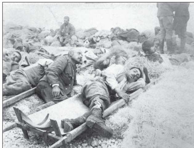
7. ábra. A gáztámadás olasz sebesültjei