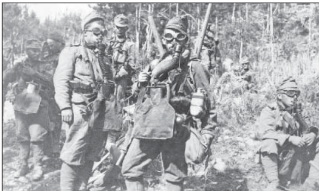
5. ábra. Gáztámadás előtt. Volt némi német felszerelésük, gázmaszk és sűrített levegő

percbe tellett, míg kifúvatták a gázt (ennek éles hangja volt). Hatalmas felhő keletkezett. Az ellenség katonái heves torokfájdalmakkal, fülzúgással, fejfájással menekültek, többen vért köptek, vízért kiáltottak, a földön vonaglottak, rettenetes kínokat éltek át [1].