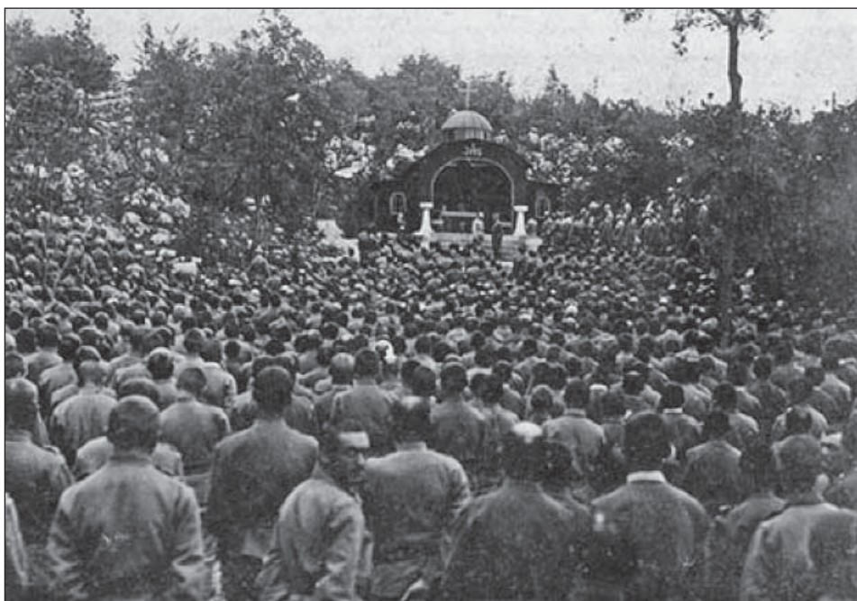
10. ábra. Tábori mise Segetiben

gedi, aradi) épült utcákkal, kőből készült barakkokkal. Az utcákat otthoni helyekről nevezték el. Mindenkinek megvolt a saját ágya. A táborban volt kórház és segélyhelyek, vasútállomás, fürdő, vurstli, sportolási lehetőségek, mozi és négy kápolna. A katonák tíz nap lövészárokharc után tíz nap pihenőt kaptak. Az volt az elv, hogy akkor szórakozzanak, addig nincs honvágyuk.