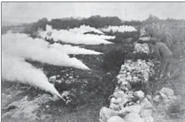
6. ábra. Gáztámadás 1916. június 29-én

A sorozatos isonzói csaták során az egyik fél sem ért el átütő sikert. Elkezdődött a felkészülés egy döntő ütközetre. 1915 nyarán a hadvezetőségnek gondoskodnia kellett az új