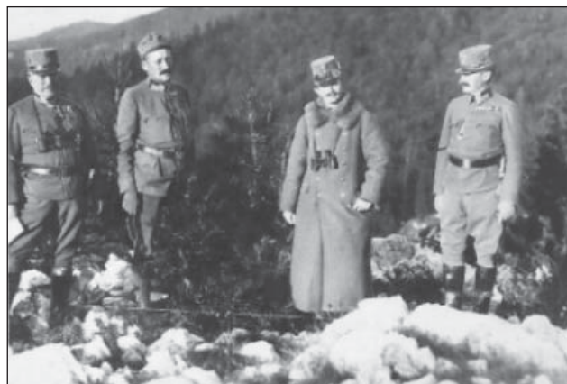
8. ábra. Őfelsége IV. Károly király és kísérete

hadszíntérre érkező nagyszámú katonatömeg megfelelő szállításáról, mozgásáról, elhelyezéséről, különböző testi és lelki szükségleteinek kielégítéséről is, hogy az hadra fogható legyen és az első vonalakban megfelelően helyt tudjon állni.