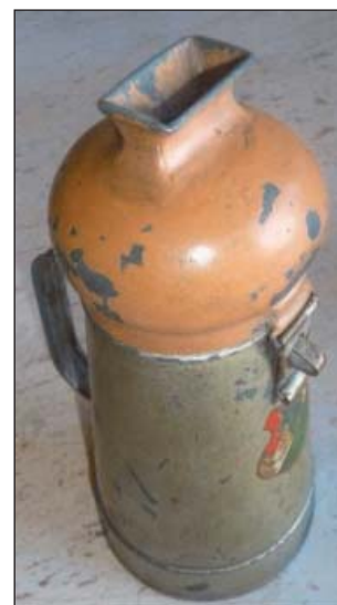
12. ábra. A segeti tábor a háború után nyomtalanul eltűntették, de a tábori kápolnából megmaradt egy tárgyi emlék: a tábori lelkész perselye