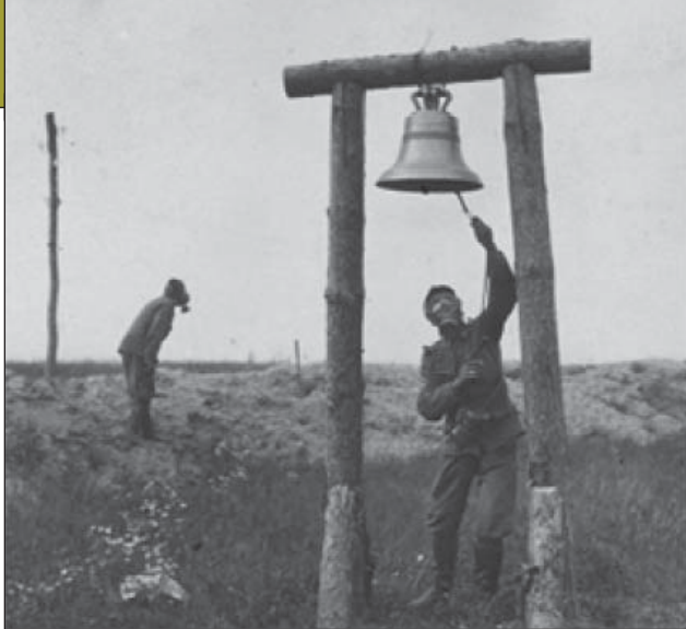
4. ábra. Eljött a gázriadó napja