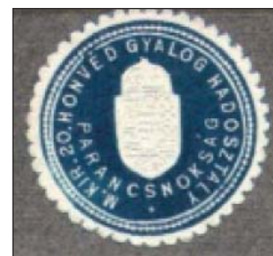
13. ábra. A magyar királyi honvéd 20. gyaloghadosztály parancsnokságának körpecsétje