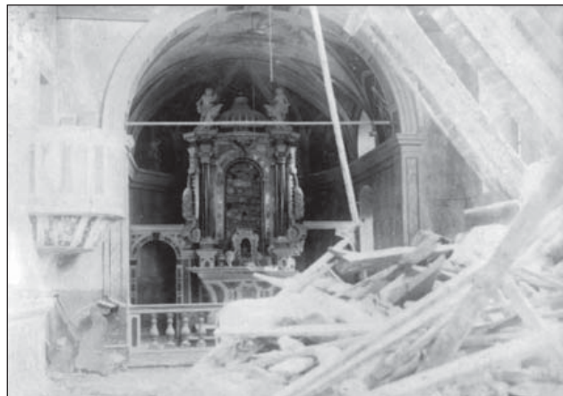
9. ábra. A templomok addigra már szét voltak löve, vagy kórházként szolgáltak

A táborhely inkább egy kisvárosra hasonlított városrészekkel, az egyes alakulatoknak (debreceni, fehérvári, sze-