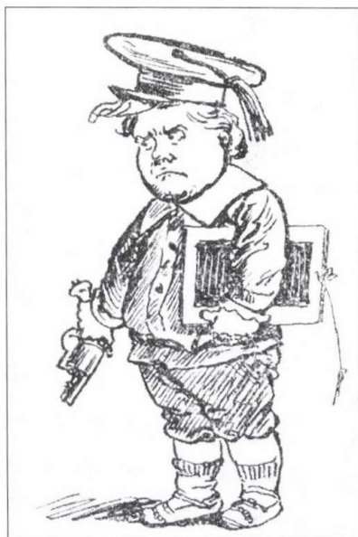
4. kép. 1891. XXIV. évf., július 5., 4. o.

A bottal vagy pálcával kapcsolatos szerkesztői vélemény nemcsak a tanítók szájába adott gúnyos szövegek formájában vagy képi ábrázolásokban jelenik meg, hanem egy sajátos karakter, Vigyázó Laczi iskolás gyermek gondolataiban is, aki állandó szereplője az újságnak. Ez a gyerekfigura az öntudatos iskolás gyermek stilizált alakja, aki rendre megosztja gondolatait a hírlap olvasóival, levelez a szerkesztővel, panaszkodik, kérdez, felháborodását fejezi ki, gyermeknyelven reflektál az őt körülvevő világra, főképp irodalmi, közéleti, politikai kérdésekben. Képi alakja