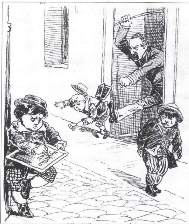
2. kép. 1882. XV. évf., november 12., 7. o.

Bár vélhetően nem lehet egy az egyben levezetni belőle, az iskolai testi fenytés ügye összefüggésben lehetett a büntetőeljárássokban használt botbüntetés társadalmi hasznosságának vagy ártó voltának kérdésével is, amellyel kapcsolatban a 19. század első