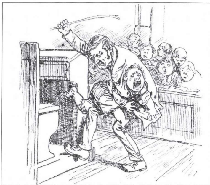
3. kép. 1895. XXVIII. évf., november 17., 13. o.

Hogy a régi sebecske Nem fáj semmikép.” 13