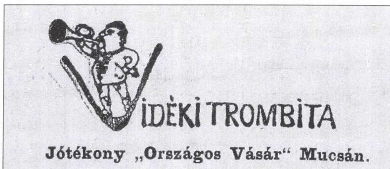
1. kép. 1893. XXVI. évf., június 25., 8. o.

Ebből a rövid idézetből is kitűnik, hogy az élc céltáblája nem a tanító, hanem a tanítót megítélő, vele és családjával lekezelően viselkedő, hívalkodó ruházatú özvegy és az ő műveltsége. A jelenetben szereplő tanítót egyébiránt Keszeg Andris nak hívják. Ez után az ízelítő után érdemes tematikusan csoportosítani a tanítóval kapcsolatban fellelhető jelenségeket.