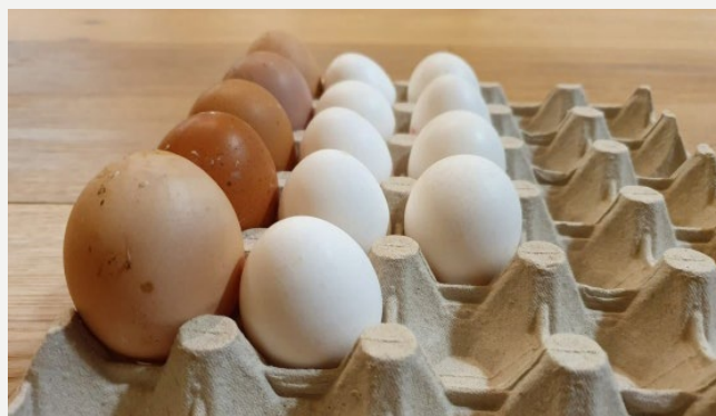
Není vejce jako vejce.

Těsto na ně připravíme vždy ze tří základních ingrediencí . Mouky, v našem případě Červené směsi PASTA & GNOCCHI , vajec a špetky soli . Málokterý druh pokrmu je tak nenáročný na suroviny. Červená směs je na bezlepkové těstoviny perfektní, proto jsme jejich italský název „PASTA“ vtělili i do samotného označení směsi. Co se týče vajec, tady musíme být obezřetní, protože není vejce jako vejce. Pokud budou vejce malá, budeme muset při-