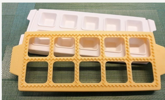
Forma od Tescomy, Foto: Adveni

V této kapitole se naučíme připravovat nudle, špagety, fettuccine ve strojku i ručně . Osvojíme si základní pravidlo, jak je vařit – tj. kolik vody a soli na každých 100 g těstovin . Řekneme si také, jak je sušit a mít připravené do zásoby . Na plněné těstoviny ravioly použijeme buď rádlíko, anebo tvořítko od Tescomy a vyhraje si i s náplněmi.