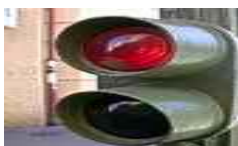
Continuer jusqu'au feu rouge