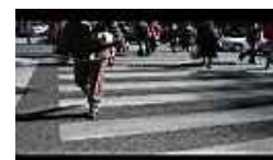
Traverser la rue par le passage piétons.