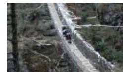
Traverser le pont