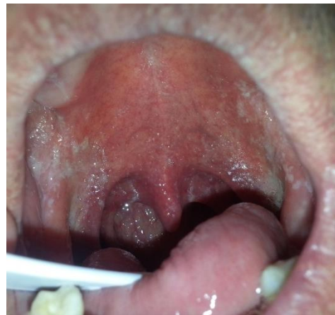
Figura 7. Candidiasis orofaríngea

El diagnóstico se realiza mediante cultivo de las lesiones y el tratamiento con antifúngicos orales habitualmente.