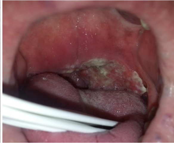
Figura 9. Carcinoma de amígdala

Futuras investigaciones son necesarias para evaluar la historia natural de la persistencia de la infección oral del HPV y su transformación maligna, el desarrollo de unos protocolos de screening efectivo y el desarrollo de técnicas de prevención como la vacunación y la educación sanitaria adecuada.