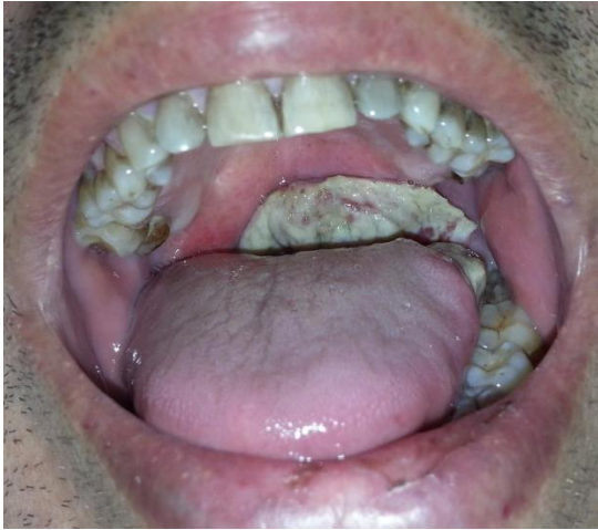
Figura 8. Carcinoma de paladar blando