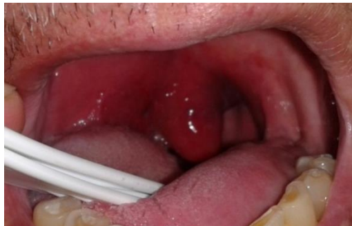
Figura 10. Hematoma de paladar secundario a sexo oral traumático

Cuando se realiza una felación es de esperar un contacto del pene con el velo del paladar con una variable intensidad pudiendo provocar un hematoma, equimosis o edema en la zona de contacto, habitualmente en la zona de unión entre el paladar blando y el duro (figura 10). Aunque estas lesiones pueden aparecer en el contexto de abusos sexuales también se ven en contexto del sexo consentido, con frecuencia en mujeres jóvenes o en varones homosexuales 143 .