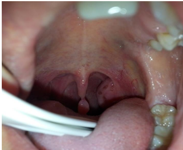
Figura 1. Papiloma de orofaringe

Los papilomas escamosos y las verrugas orales, transmitidas por vía sexual, se describen como placas o pápulas verrucosas exofíticas, situadas en cualquier superficie mucosa oral o faríngea (figura 1). Los papilomas escamosos tienden a ser pequeñas pápulas rosas pediculadas, mientras que las verrugas son sésiles con apariencia papilomatosa.