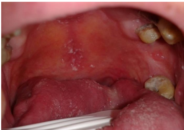
Figura 6. Candidiasis orofaríngea

A nivel de la cavidad oral y faringe, puede producir aftas transmitidas a través del sexo oral. Producen lesiones que se describen como placas blanquecinas (candidiasis pseudomembranosa aguda) (figuras 6 y 7), aunque pueden manifestarse como lesiones atróficas u otras lesiones no específicas.