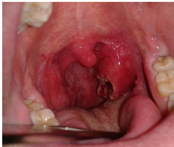
Figura 3. Úlcera amigdalal en paciente con sífilis primaria