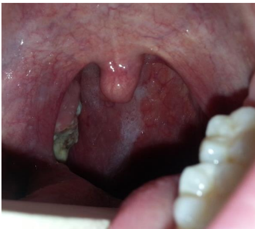
Figura 2. Chancro sifilitico asociado a adenopatía laterocervical

La sífilis primaria se caracteriza por una lesión conocida como chancro (figura 2), que se origina en el lugar de penetración del microorganismo en la mucosa (genital u oral). Consiste en una úlcera indolora e indurada con bordes sobrelevados, que dura entre 3 y 6 semanas, y es altamente contagiosa. Aunque es infrecuente su presentación en la faringe, tenemos que pensar en ella ante la presencia de úlceras necróticas de gran tamaño, en la zona amigdalal habitualmente, con adenopatías ipsilaterales asociadas (figura 3) 25 . La presencia de una ulceración mucosa implica un aumento de riesgo de contagio de otras enfermedades de transmisión sexual, sobre todo VIH.