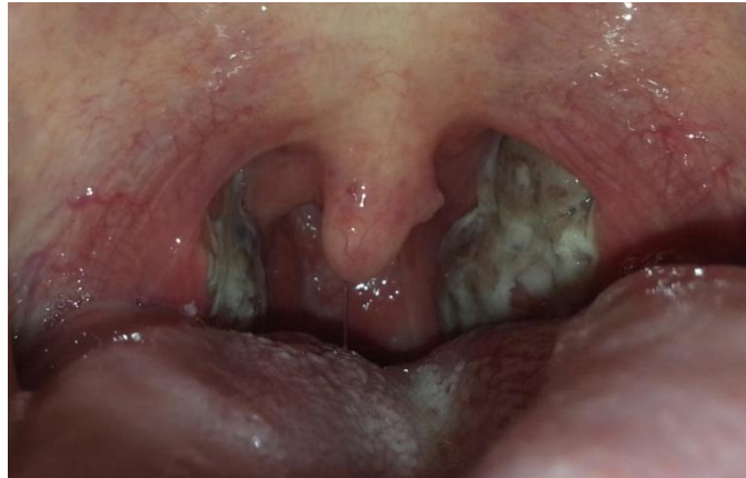
Figura 4. Faringitis gonocócica

La faringitis gonocócica es generalmente asintomática (Pearson, 2004) aunque algunos pacientes pueden presentar dolor de garganta y adenopatías cervicales 52 .