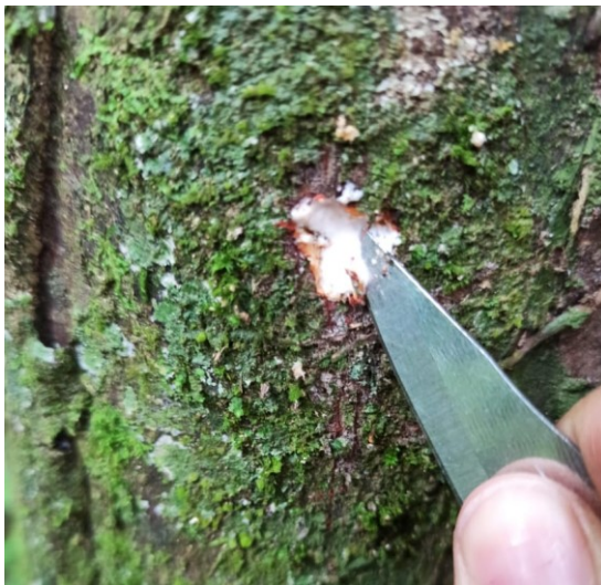
Fig. 5 Identificación de especie mediante incisión en el fuste