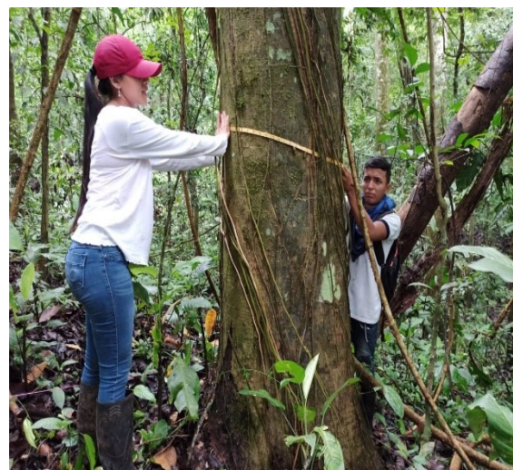
Fig. 6 Medición de diámetro con la cinta diamétrica