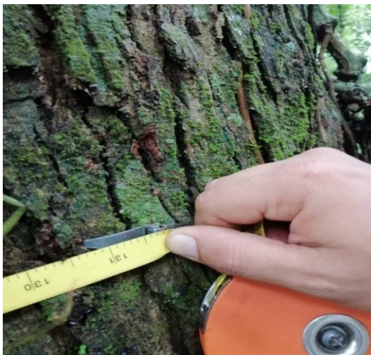
Fig. 3 Toma de diámetro de una especie.