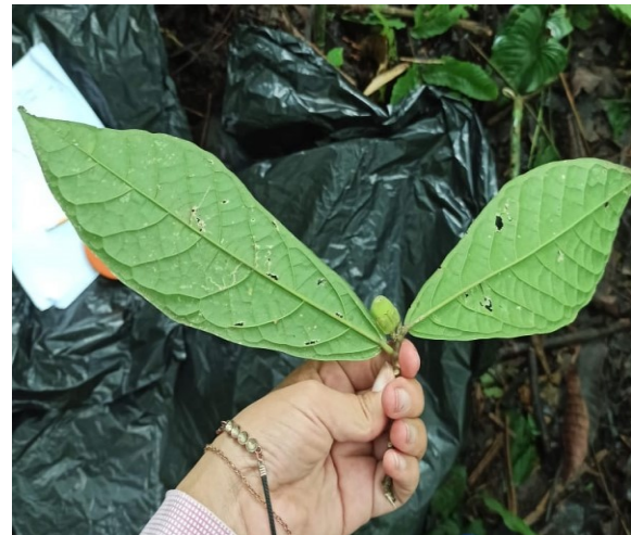
Fig. 4 Toma de muestras a identificar