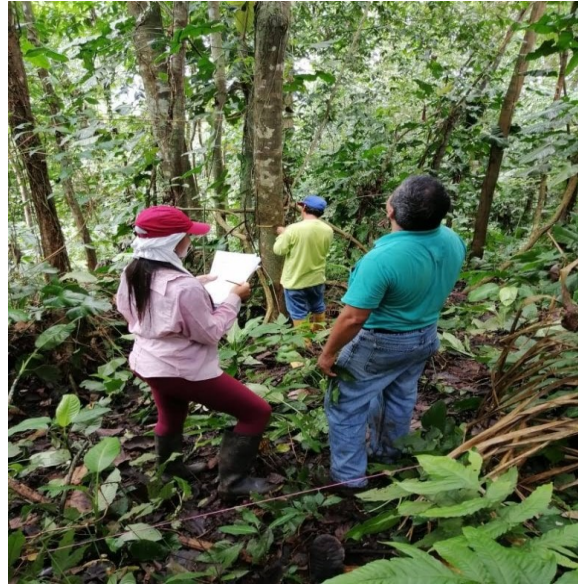
Fig. 2 Llenando hoja de campo.