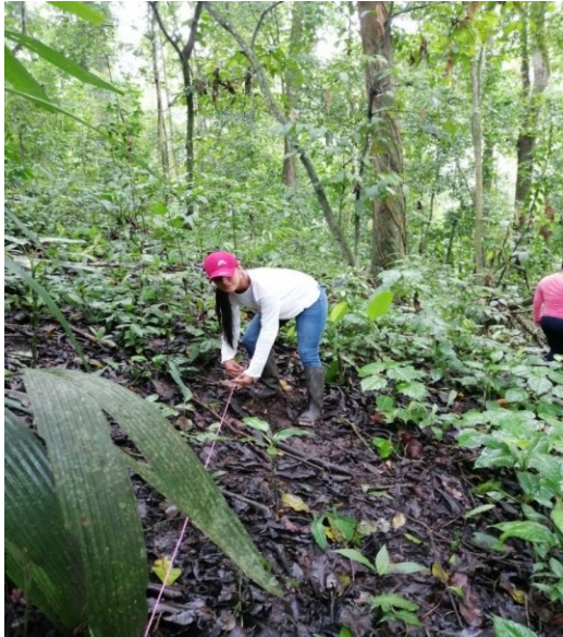
Fig. 1 Establecimiento de parcelas.