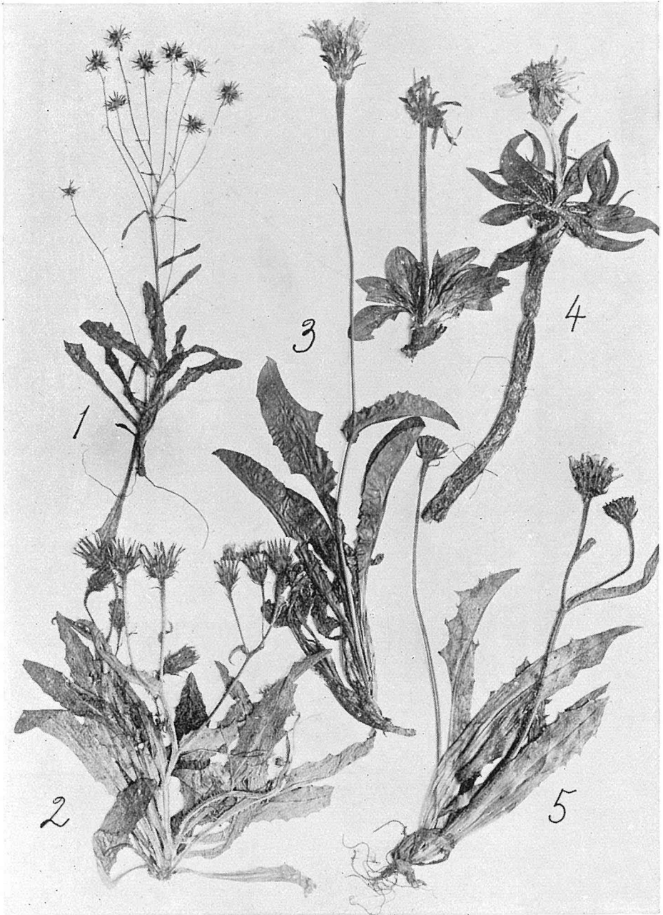
Fig. 5. 1. Hieracium pinanense KITAM. from mt. Pinanshuzan, prov. Takao. 2. Picris hieracioides subsp. Ohwiana KITAM. from mt. Nankotaisan, prov. Taihoku. 3. Hypochaeris crepidioides TATEWAKI et KITAM. from mt. Apei, prov. Hidaka. 4. Scorzonera rebunensis TATEWAKI et KITAM. from insl. Rebun, prov. Kitami. 5. Crepis hokkaidoensis BABCOCK from insl. Shikotan, Kuriles. \times 0.38 .