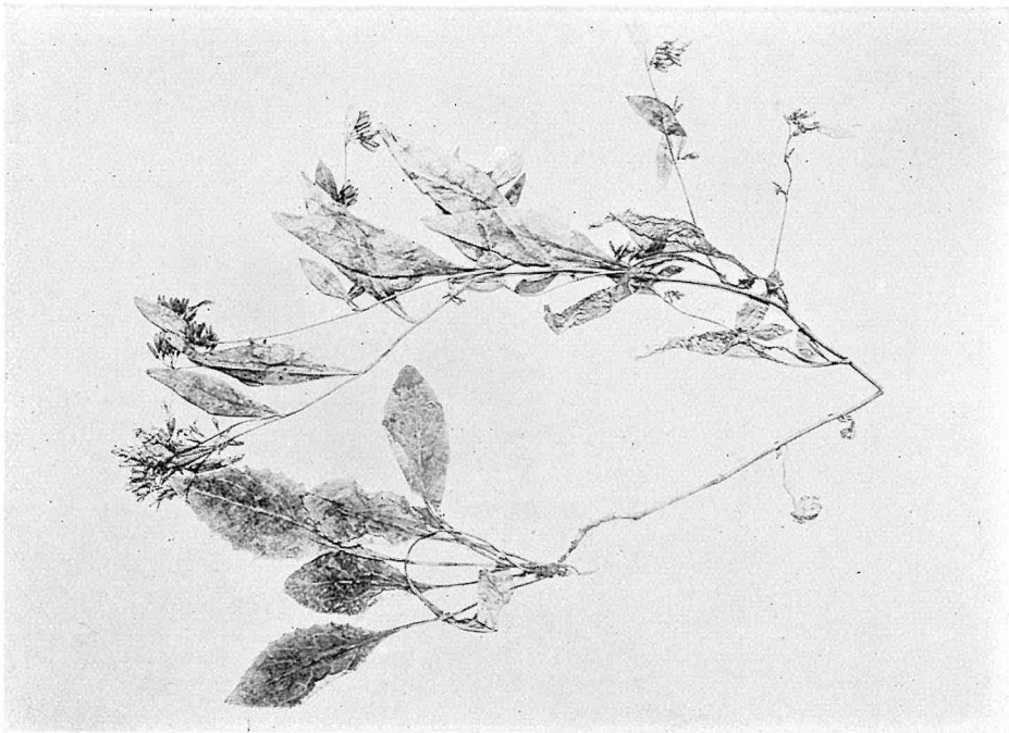
Fig. 3. Youngia Yoshinoi KITAMURA from Kusama, prov. Bitchu. \times 0.28 .