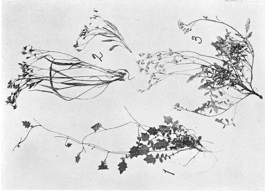
Fig. 4. 1. Lapsana Tahasei KITAMURA collected between Hattskwan and Rakuraku, prov. Taichu. 2. Iaeris transnokoensis KITAMURA collected between Kiraihumampo and Noko, prov. Taichu. 3. Ixyangia Sekimotoi KITAMURA from Kunimoto, prov. Shimotsuke. \times 0.29 .